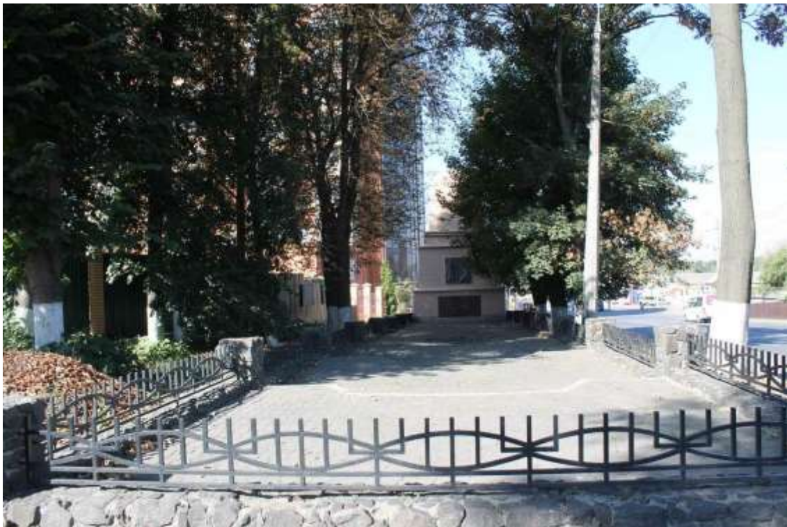
135. Братська могила жертв петлюрівського погрому, 1919 р., 1925 р., вул. Толстого, 7/1. Фото жовтень 2016 р. Пам'ятка історії місцевого значення.