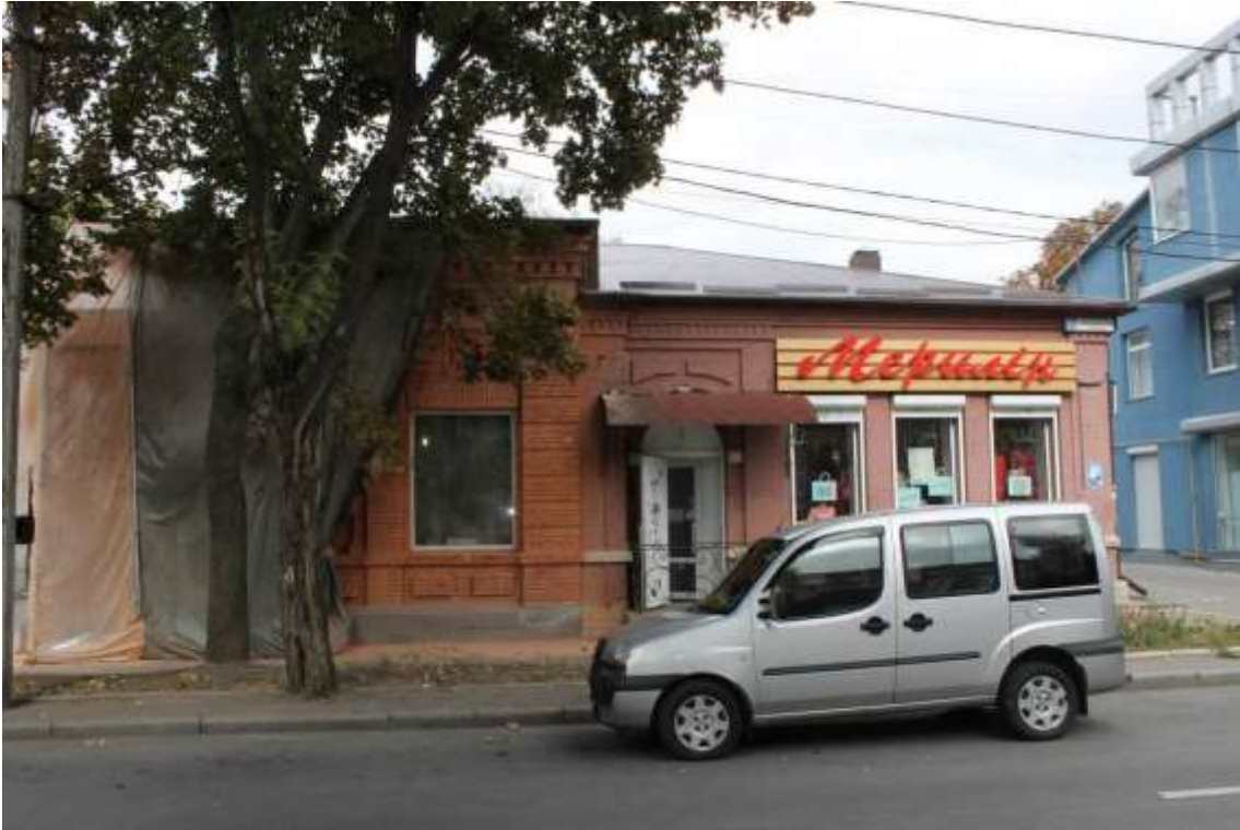
119. Будинок житловий, кін. XIX ст., вул. Проскурівського підпілля, 70. Фото жовтень 2016 р. Щойно виявлений об'єкт культурної спадщини за видом архітектури.