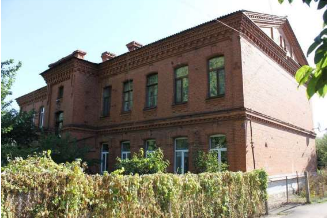
145. Будинок житловий, 1890-ті рр., вул. І. Франка, 45.