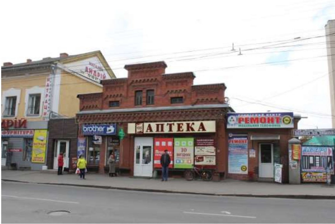
51. Будинок В. Епштейна, кін. XIX ст., вул. Кам'янецька, 14. Фото жовтень 2016 р. Щойно виявлений об'єкт культурної спадщини за видом архітектури.