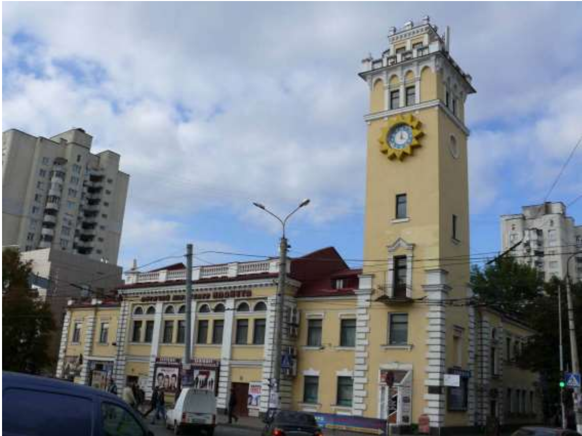
81. Будівля Пожежного депо, 1954 р., вул. Подільська, 39. Фото жовтень 2016 р. Щойно виявлений об'єкт культурної спадщини за видом архітектури.