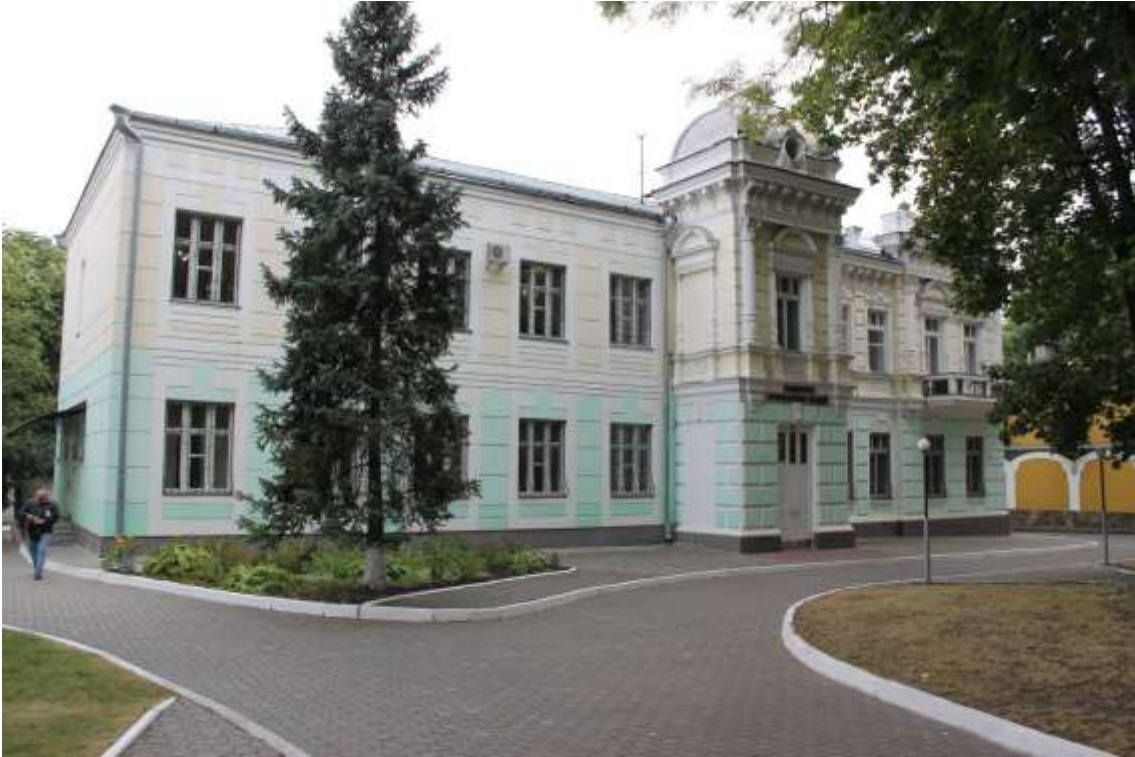
19. Особняк, в якому проживали відомі військові та політичні діячі, 1903 р., 1928 р., 1970-ті рр., вул. Гагаріна, 4.