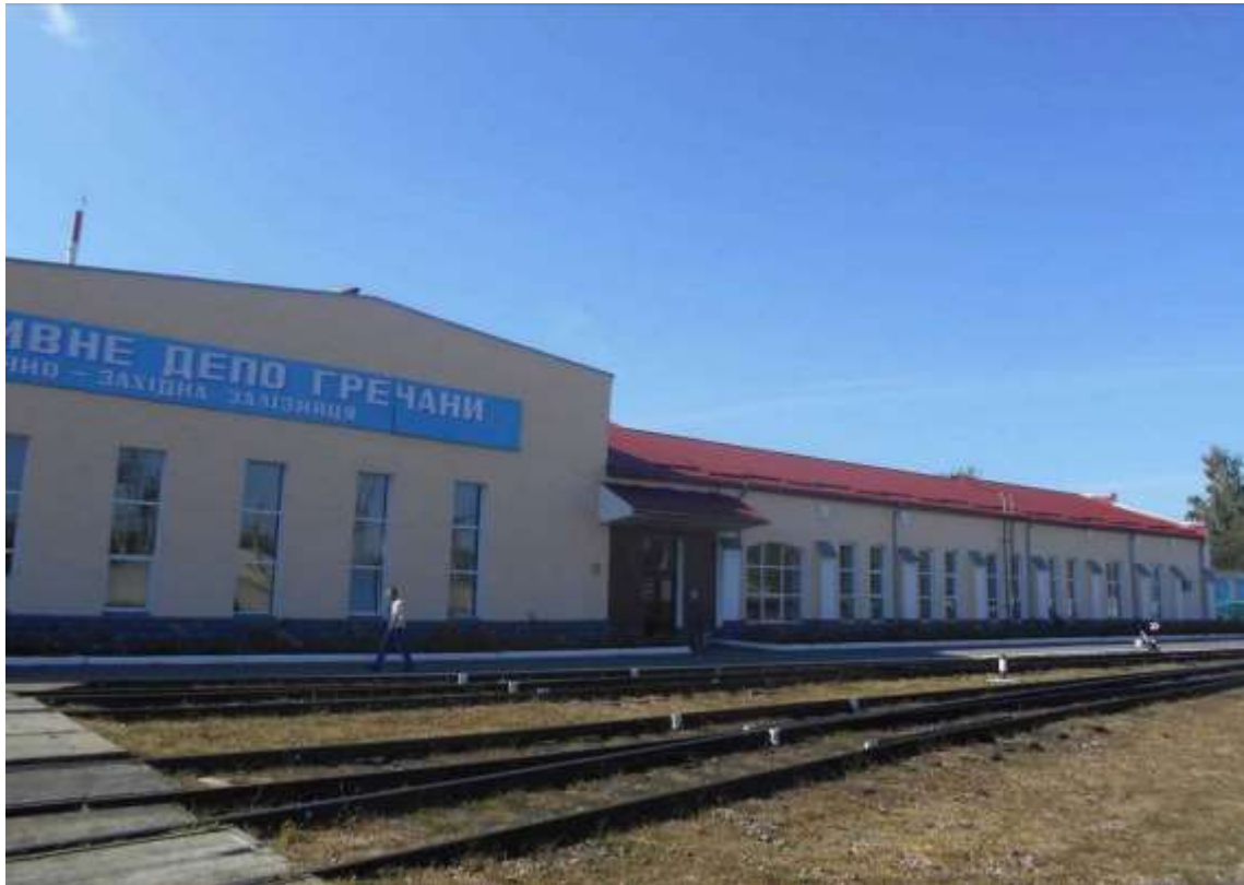
17. Комплекс споруд вагонного депо, 1910-ті рр., вул. Волочиська, 10. Фото жовтень 2016 р. Пам'ятка історії місцевого значення.