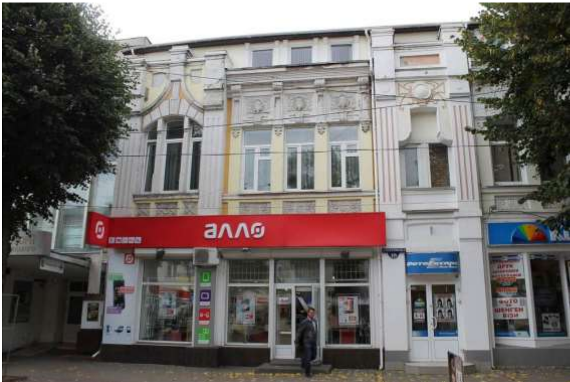
98. Будинок прибутковий, поч. ХХ ст., вул. Проскурівська, 28. Фото жовтень 2016 р.

Щойно виявлений об'єкт культурної спадщини за видом архітектури.