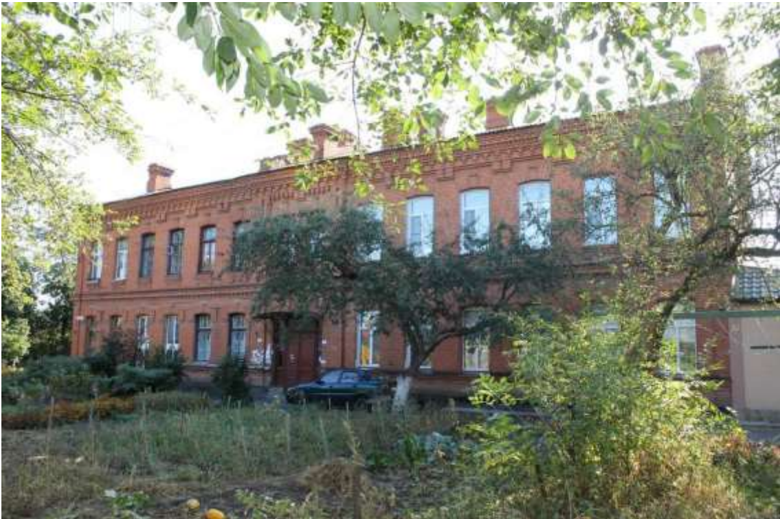
142. Будинок житловий, 1890-ті рр., вул. І. Франка, 39.

Щойно виявлений об'єкт культурної спадщини за видом архітектури.