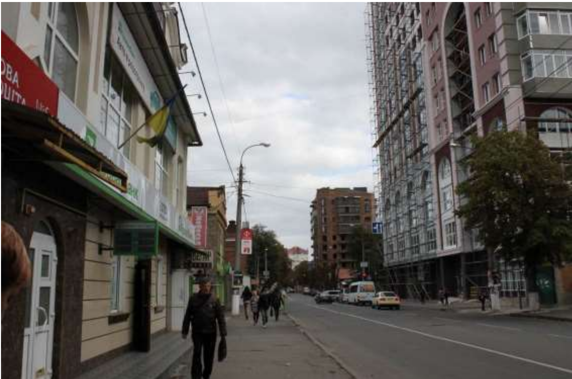
13. Забудова вул. Подільської в районі будинків №№ 58, 73, 75. Вигляд в бік вул. Свободи. Фото жовтень 2016 р.