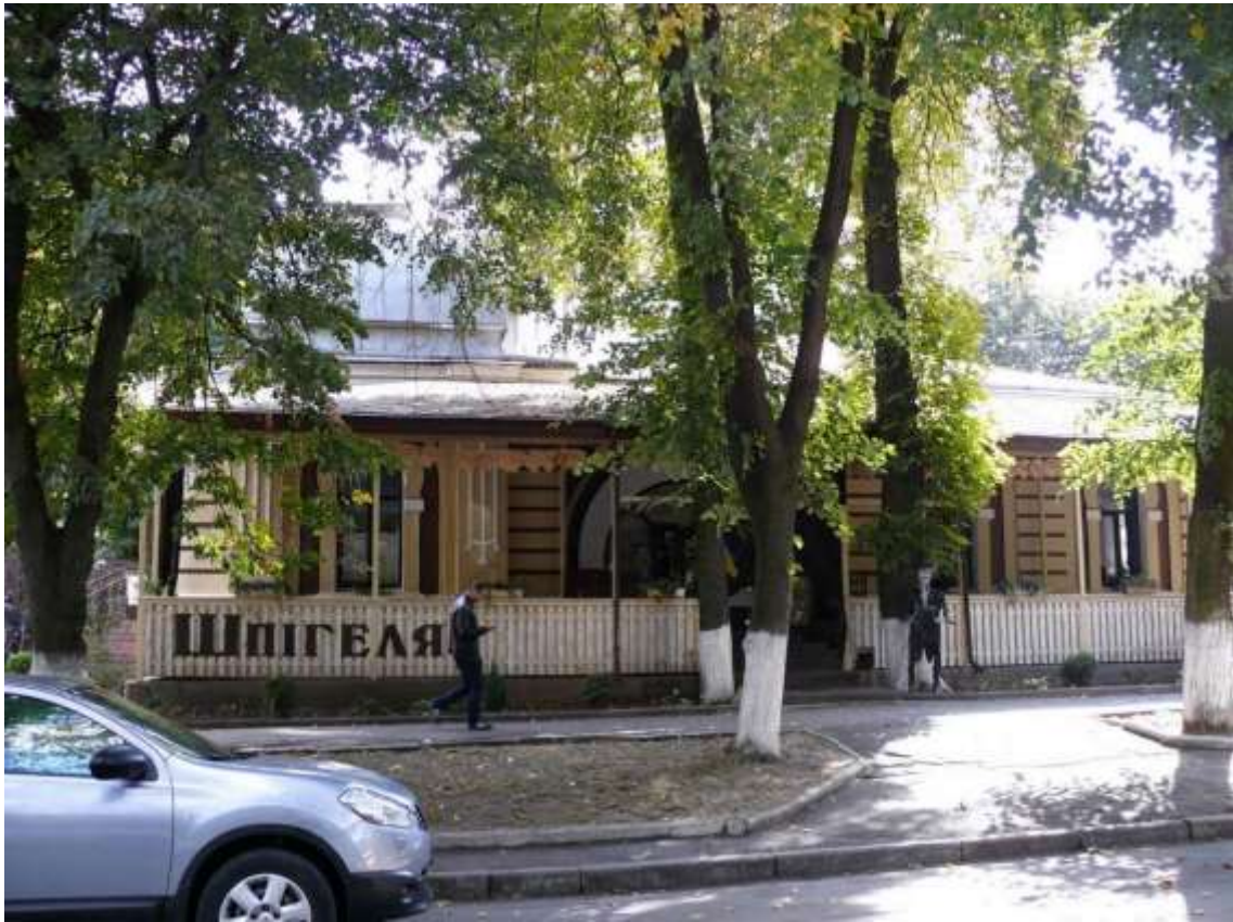
11. Особняк І. Шпігеля, поч. XX ст., вул. Володимирська, 63. Фото жовтень 2016 р. Щойно виявлений об'єкт культурної спадщини за видом архітектури.