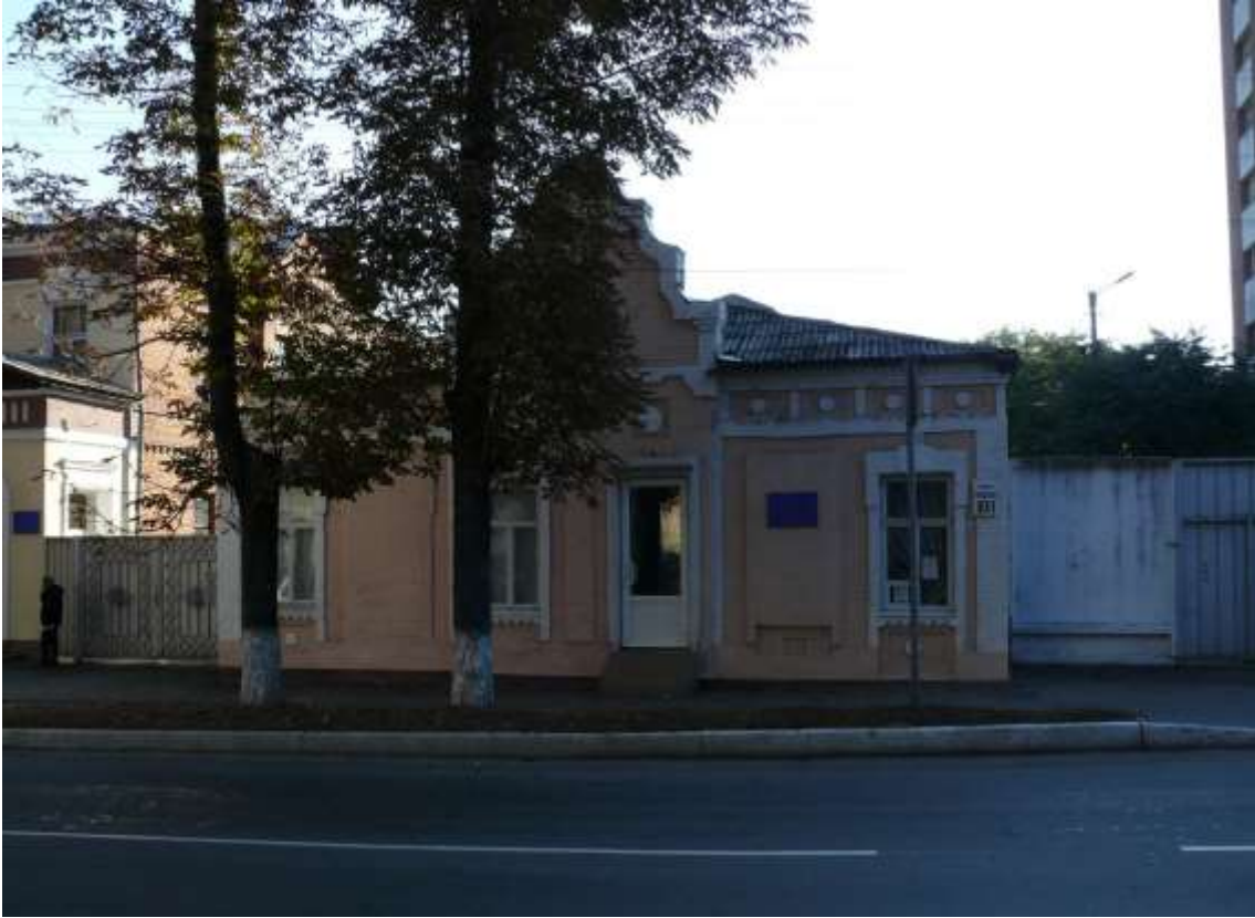
45. Будинок житловий, кін. XIX ст., вул. Грушевського, 97/1. Фото жовтень 2016 р.

Щойно виявлений об'єкт культурної спадщини за видом архітектури.