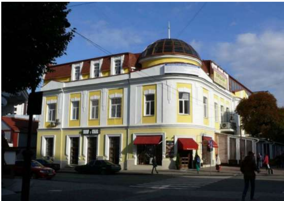
92. Будівля ресторану та готелю, в якому в 1938 р. мешкала знімальна група під керівництвом кінорежисера О. Довженка, поч. XX ст., 1938 р., поч. XXI ст., вул. Проскурівська, 15. Фото жовтень 2016 р. Щойно виявлений об'єкт культурної спадщини за видом архітектури.