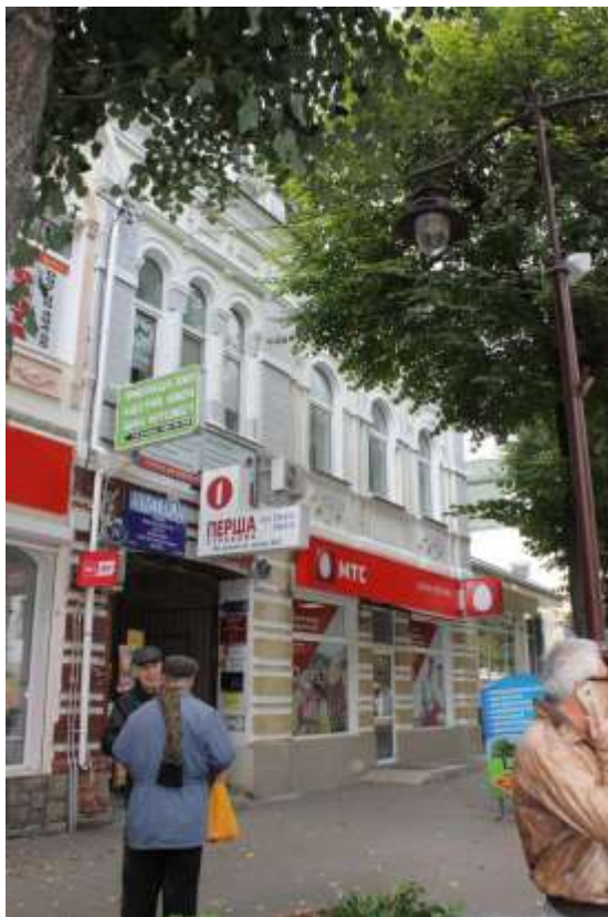
95. Будинок житловий, кін. XIX ст., вул. Проскурівська, 22. Фото жовтень 2016 р.

Щойно виявлений об'єкт культурної спадщини за видом архітектури.