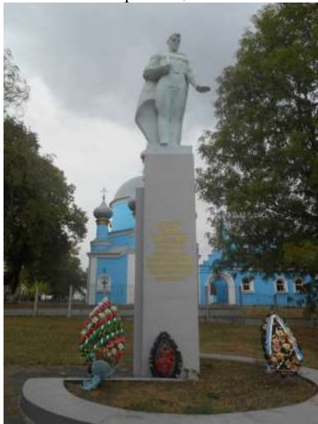
66. Пам'ятний знак на честь воїнів-односельців, 1941-1944 рр., вул. Кам'янецька, 172. Фото жовтень 2016 р. Пам'ятка історії місцевого значення.