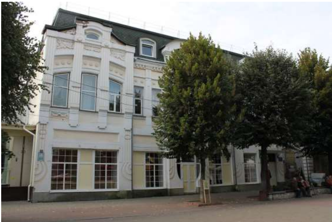
94. Кінотеатр «Модерн» та будинок житловий І. Оксмана, 1907 р., 1910 р., 2006 р., вул. Проскурівська, 18. Фото жовтень 2016 р. Щойно виявлений об'єкт культурної спадщини за видом архітектури.

Щойно виявлений об'єкт культурної спадщини за видом архітектури.