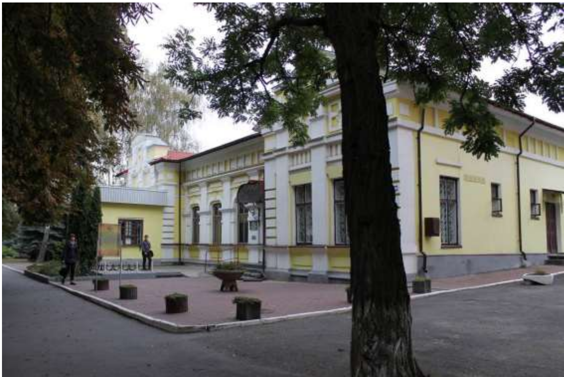
12. Особняк, 1907 р., вул. Володимирська, 103. Фото жовтень 2016 р. Щойно виявлений об'єкт культурної спадщини за видом архітектури.