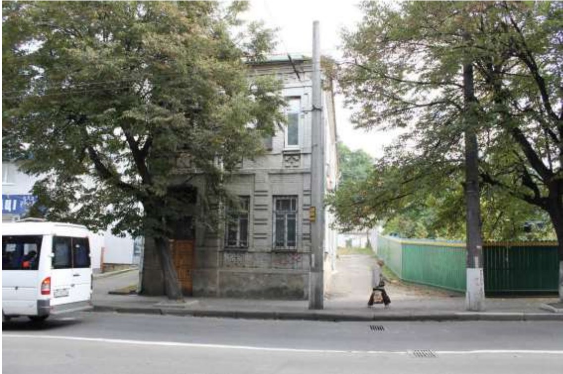
55. Будинок прибутковий, кін. XIX – поч. XX ст., вул. Кам'янецька, 51. Фото жовтень 2016 р. Щойно виявлений об'єкт культурної спадщини за видом архітектури.