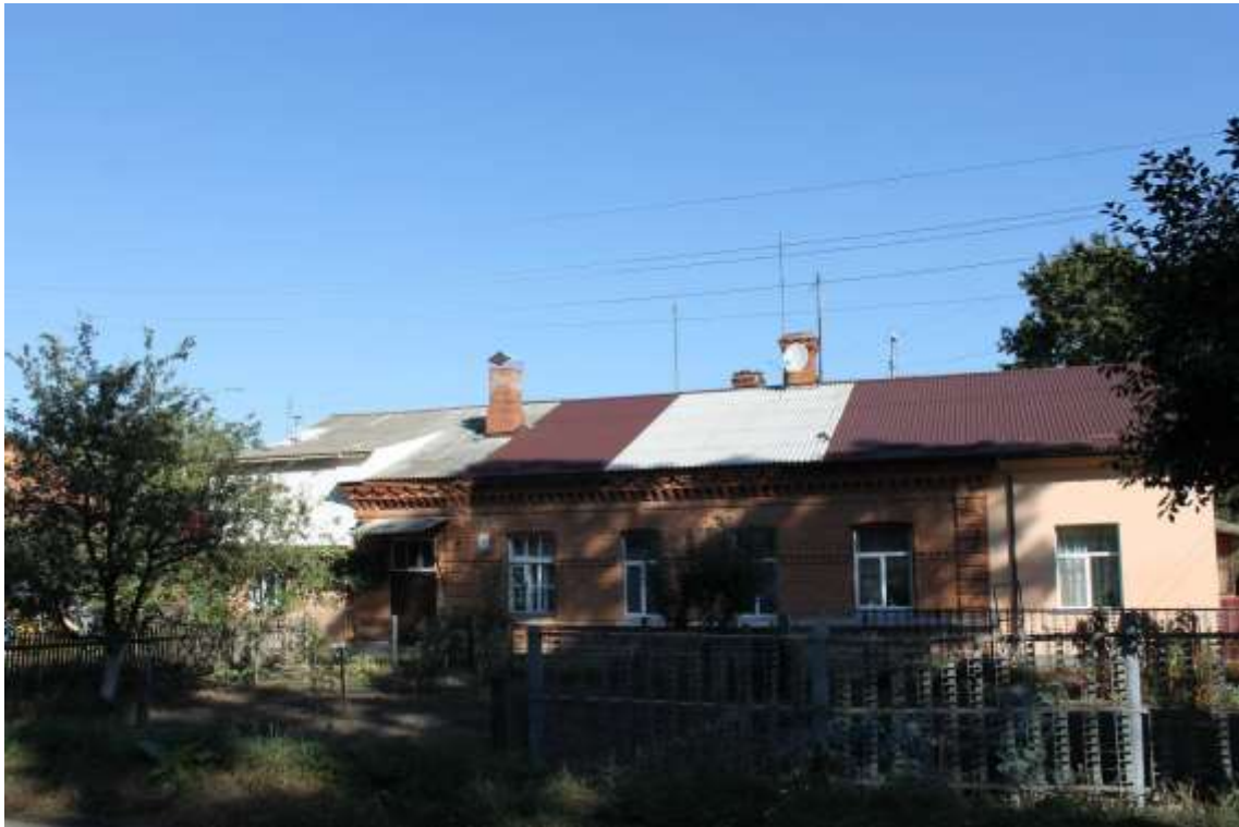
25. Будинок житловий, 1890-ті рр., вул. Гастелло, 4.