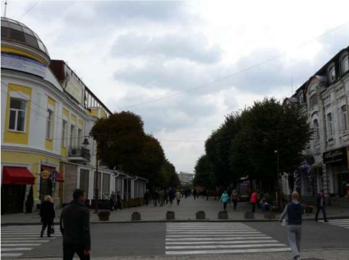
12. Забудова вул. Проскурівської. Вигляд від вул. Проскурівського підпілля в бік вул. Михайла Грушевського. Фото жовтень 2016 р.