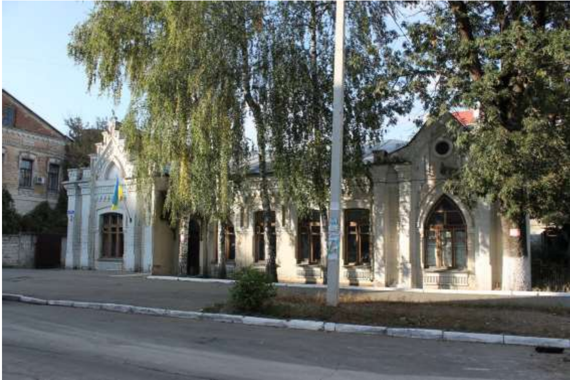
77. Особняк, поч. XX ст., вул. Пилипчука, 3. Фото жовтень 2016 р. Щойно виявлений об'єкт культурної спадщини за видом архітектури.