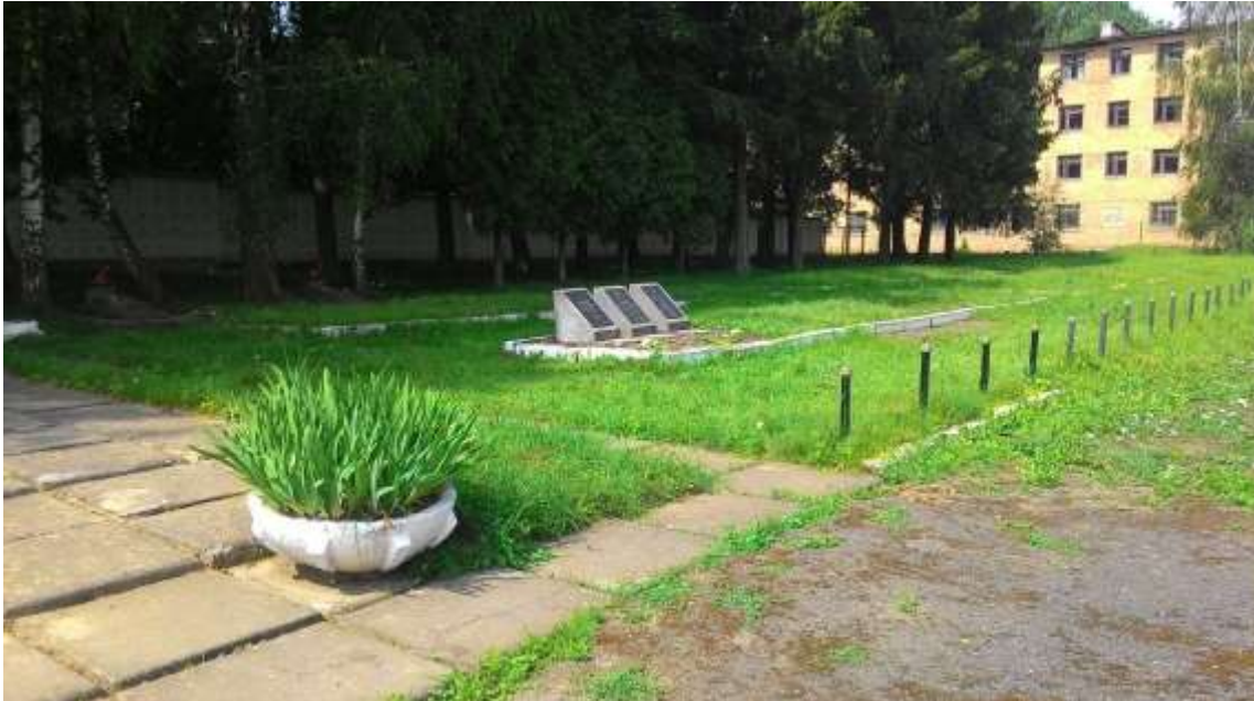
151. Братська могила воїнів Червоної Армії, 1941 р., 1975 р., вул. Чорновола, територія в/ч. Фото жовтень 2016 р. Пам'ятка історії місцевого значення.