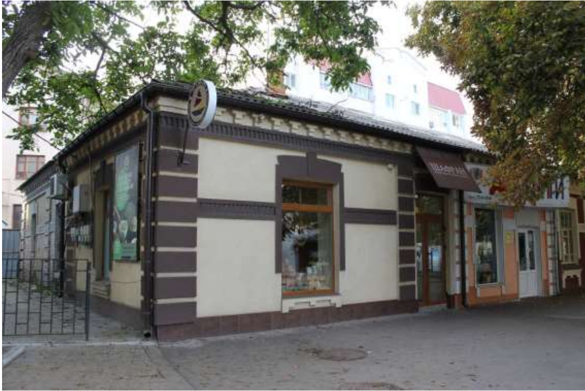
35. Будинок житловий, кін. XIX ст., вул. Грушевського, 52. Фото жовтень 2016 р. Щойно виявлений об'єкт культурної спадщини за видом архітектури.