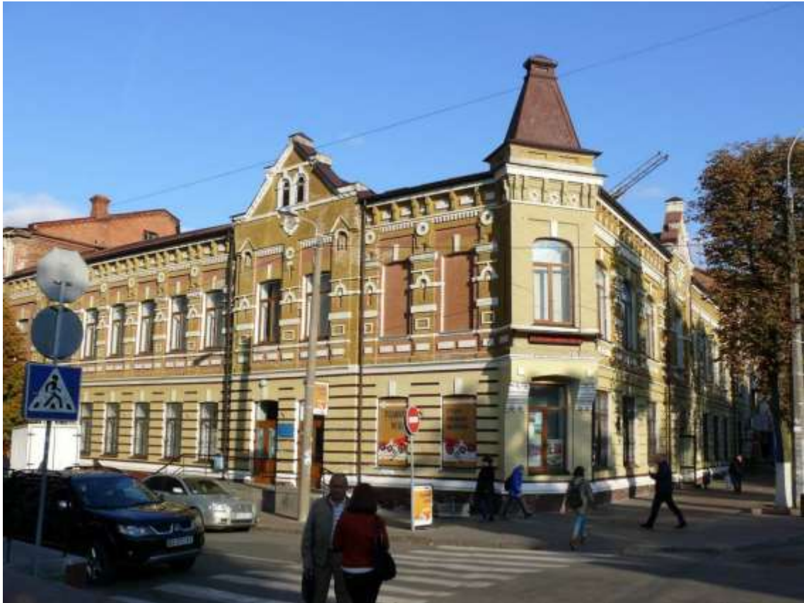
105. Будівля Південно-російського промислового банку, 1903 р., вул. Проскурівська, 47. Фото жовтень 2016 р. Пам'ятка історії місцевого значення, щойно виявлений об'єкт культурної спадщини за видом архітектури.