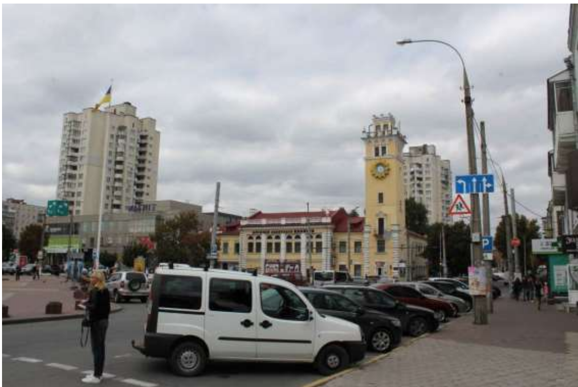
9. Вигляд з боку вул. Подільської в бік вул. Кам'янецької. Фото жовтень 2016 р.