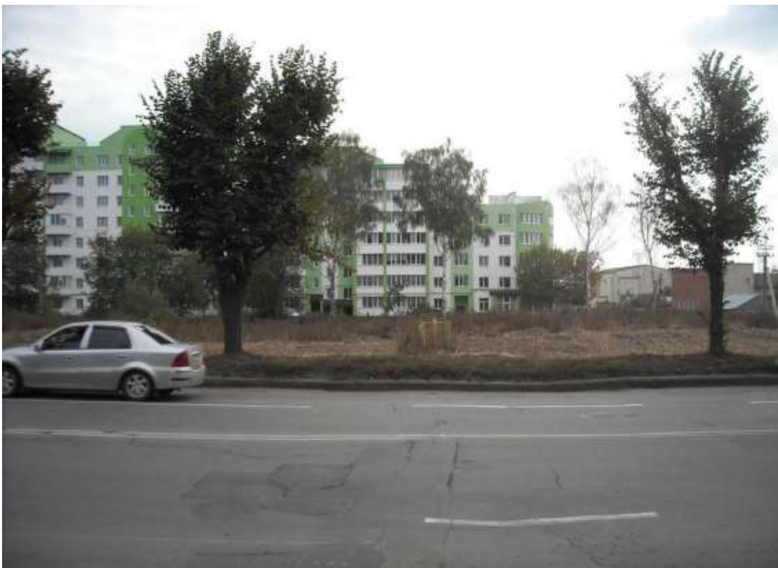
136. Місцезнаходження поселення доби бронзи, вул. Трудова, 5. Фото жовтень 2016 р. Щойно виявлений об'єкт культурної спадщини за видом археологічний.