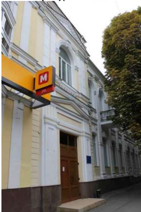
30. Будівля міського банку, в якій у 1919 р. містився штаб Запорізького корпусу армії УНР, 1914 р., 1919 р., вул. Героїв Майдану, 38. Фото жовтень 2016 р.

Щойно виявлений об'єкт культурної спадщини за видом архітектури.