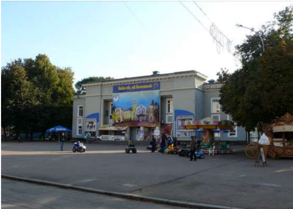
101. Будівля кінотеатру ім. Чкалова (кінотеатр ім. Шевченка), 1936-40 р., вул. Проскурівська, 40. Фото жовтень 2016 р. Щойно виявлений об'єкт культурної спадщини за видом архітектури.