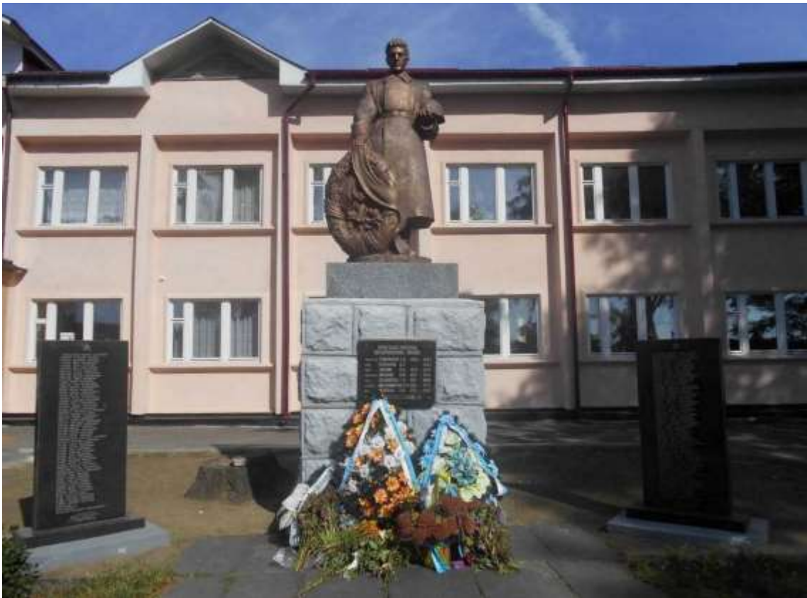
122. Братська могила воїнів радянської армії, 1944 р., вул. Профспілкова, 39. Фото жовтень 2016 р. Пам'ятка історії місцевого значення.