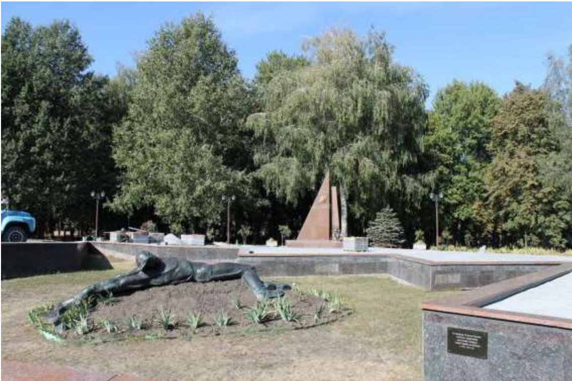
58. Військове кладовище, 1943 р., 1944 р., 1945 р., 1985 р., вул. Кам'янецька, 96. Фото жовтень 2016 р. Пам'ятка історії місцевого значення.