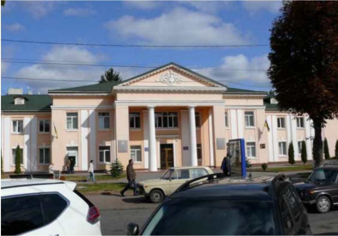
107. Будівля Будинку офіцерів, в якому в 1941 р. розміщувався штаб Південно-Західного фронту під командуванням генерал-полковника М. Кирпоноса, 1939 р., 1941 р., вул. Проскурівська, 57.