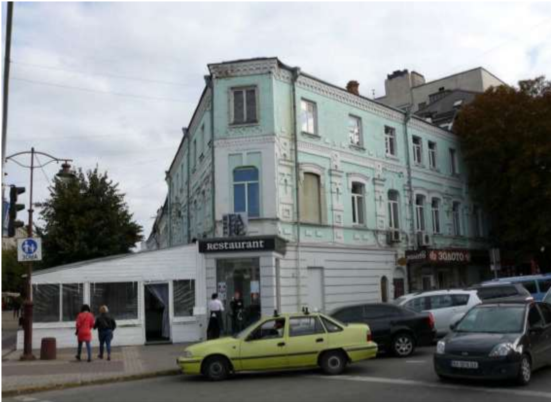
85. Готель «Сільва», кін. XIX ст., 1960-ті рр., вул. Проскурівська, 2. Фото жовтень 2016 р.

Щойно виявлений об'єкт культурної спадщини за видом архітектури.