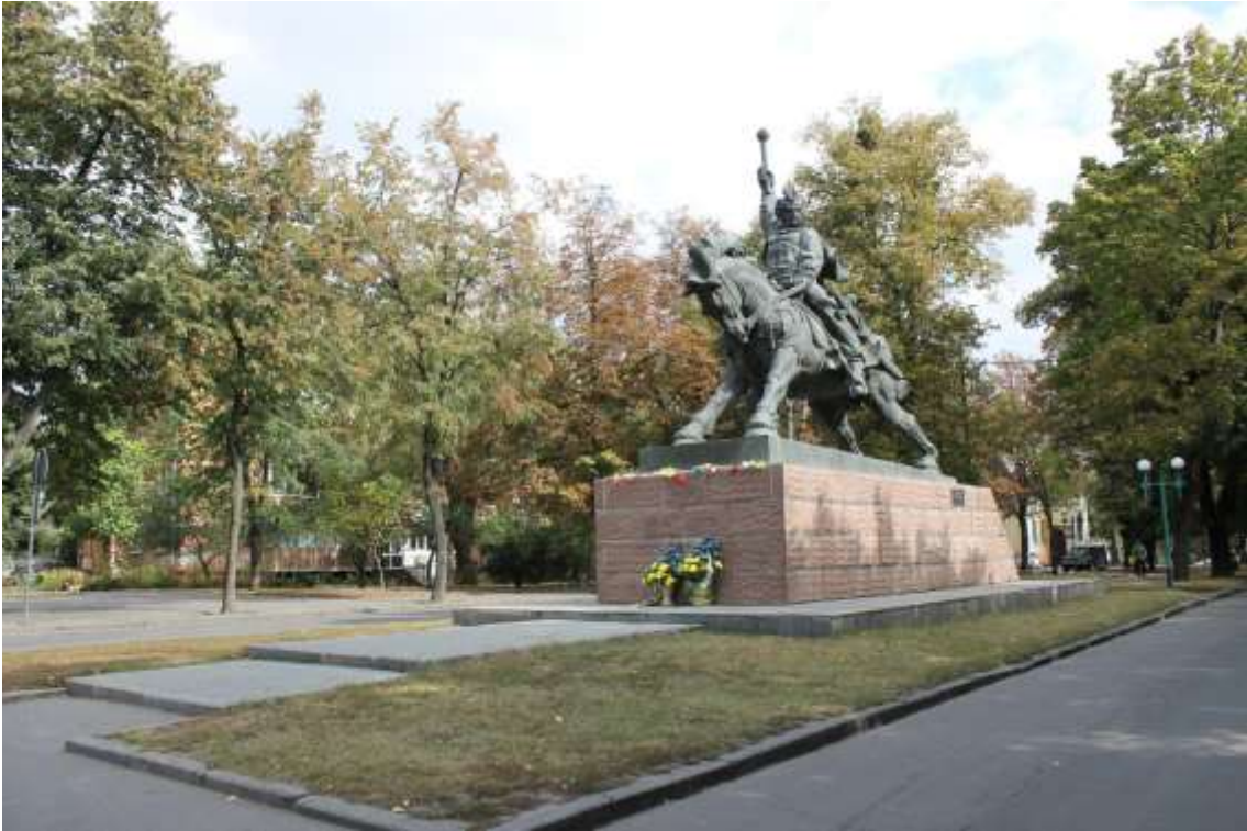
21. Пам'ятник Б. Хмельницькому, 1993 р., вул. Гагаріна, 7. Фото жовтень 2016 р.

Пам'ятка монументального мистецтва місцевого значення.