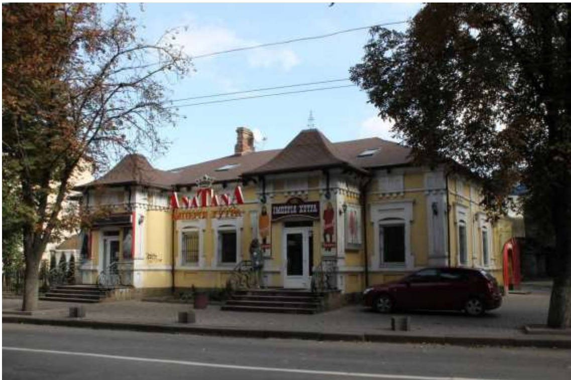
54. Будинок житловий, поч. XX ст., вул. Кам'янецька, 43. Фото жовтень 2016 р.

Щойно виявлений об'єкт культурної спадщини за видом архітектури.