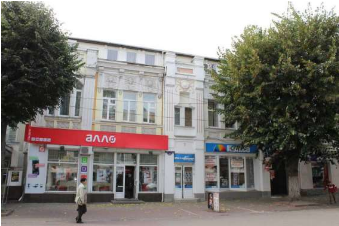
97. Будинок прибутковий, поч. ХХ ст., вул. Проскурівська, 26-28. Фото жовтень 2016 р.

Щойно виявлений об'єкт культурної спадщини за видом архітектури.