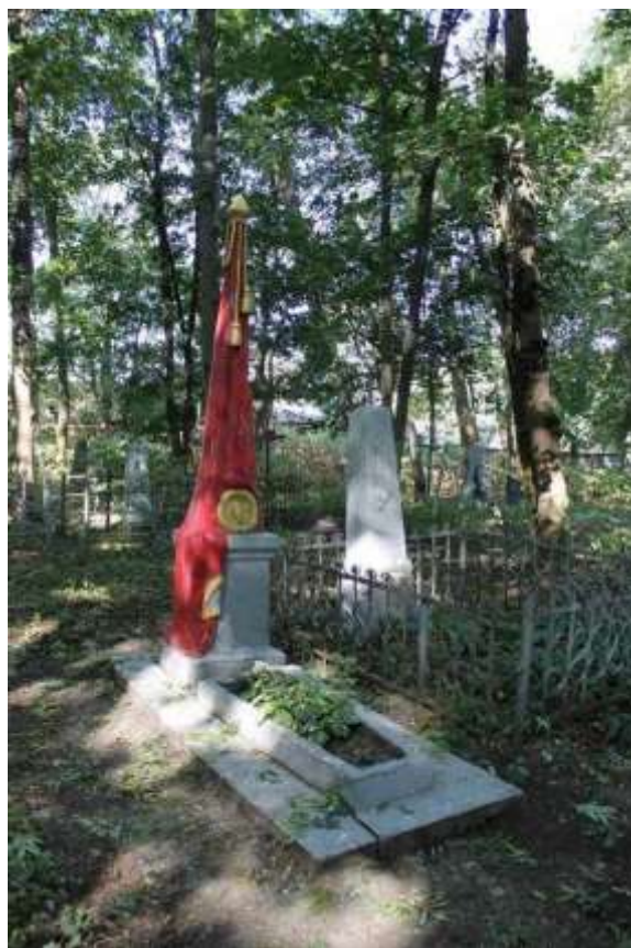
132. Могила П.М. Семенюка, 1943 р., 1948 р., вул. Толстого, 1, цвинтар. Фото жовтень 2016 р. Пам'ятка історії місцевого значення.