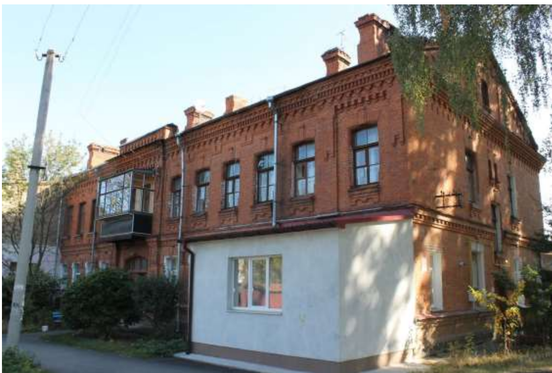
28. Будинок житловий, 1890-ті рр., вул. Гастелло, 10. Фото жовтень 2016 р.

Щойно виявлений об'єкт культурної спадщини за видом архітектури.