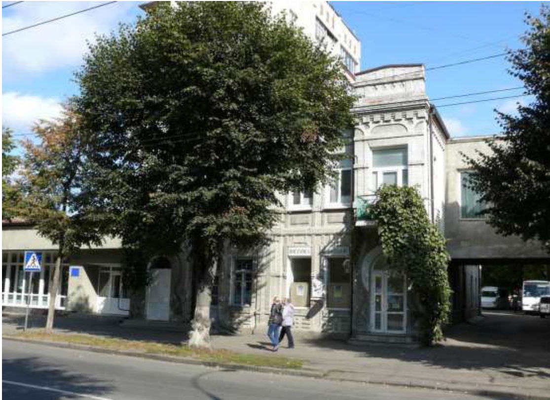
111. Будинок прибутковий, поч. ХХ ст., вул. Проскурівська, 67. Фото жовтень 2016 р.

Щойно виявлений об'єкт культурної спадщини за видом архітектури.