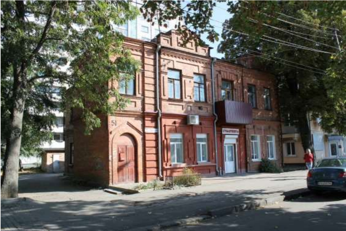
79. Будинок прибутковий, кін. XIX ст., вул. Пилипчука, 51. Фото жовтень 2016 р. Щойно виявлений об'єкт культурної спадщини за видом архітектури.