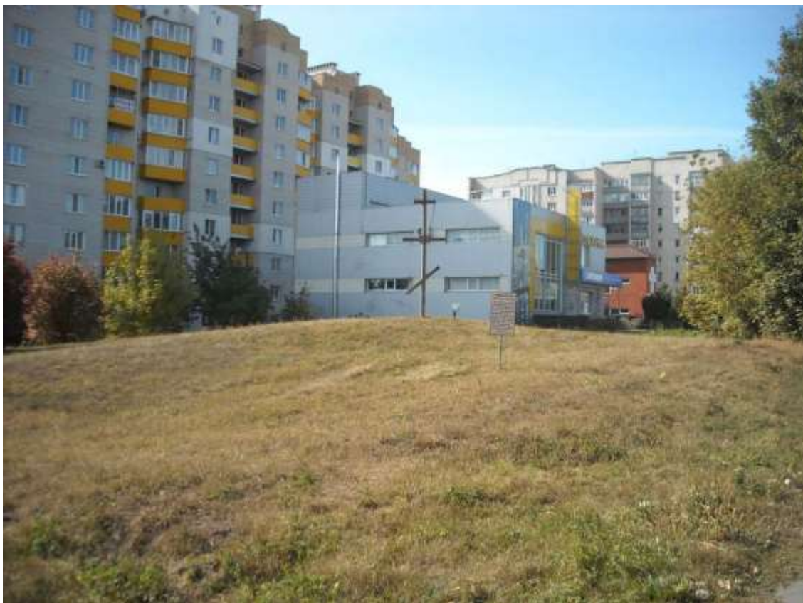
72. Курган, пр. Миру, 94. Фото жовтень 2016 р. Щойно виявлений об'єкт культурної спадщини за видом археологічний.