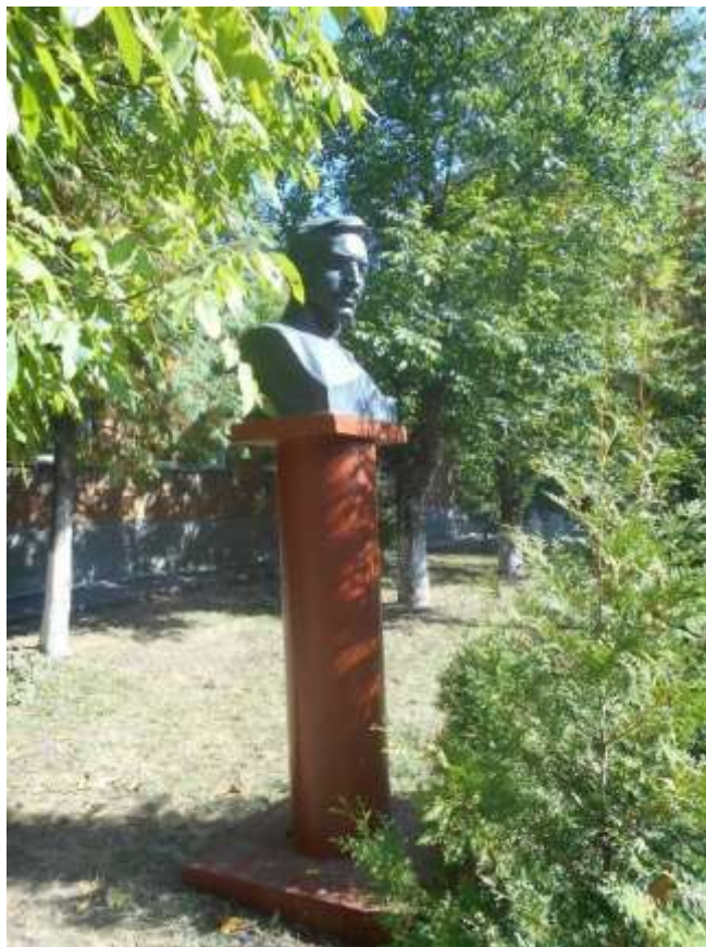
75. Пам'ятник О.С. Макаренку, 1962 р., вул. Перемоги, 9. Фото жовтень 2016 р. Пам'ятка монументального мистецтва місцевого значення.