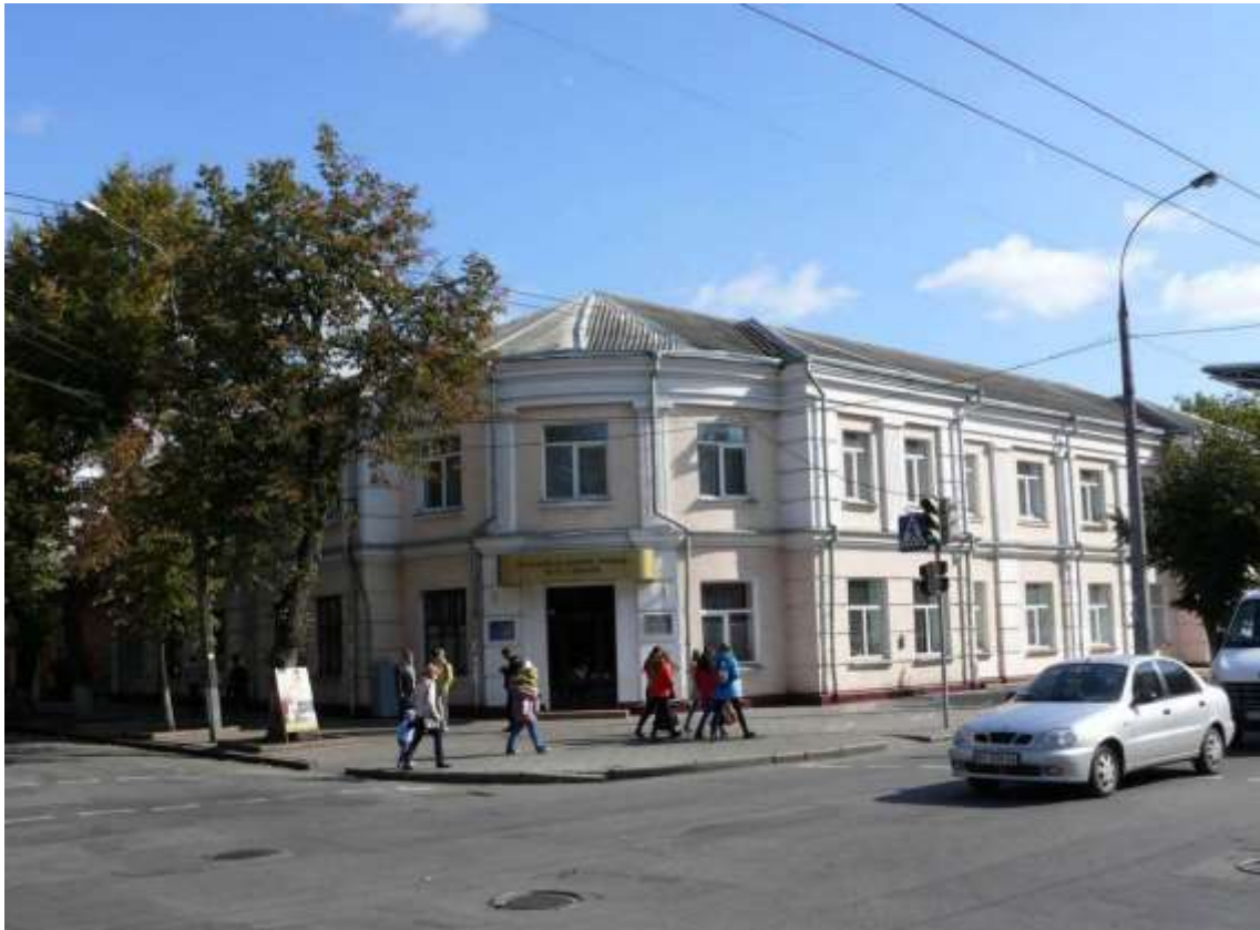
113. Будівля готелю та музичного училища, в якому навчалися видатні діячі культури, 1936 р., 1960 р., вул. Проскурівська, 79.