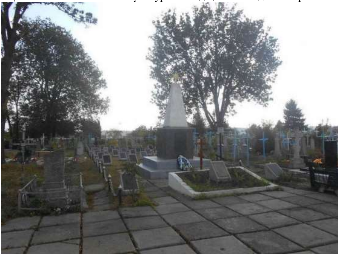
50. Військове кладовище: Братська могила радянських воїнів. Одиночні могили радянських воїнів – 29, 1944-1945 рр., 1956 р., вул. В. Зеньковського, 1. Фото жовтень 2016 р. Пам'ятка історії місцевого значення.