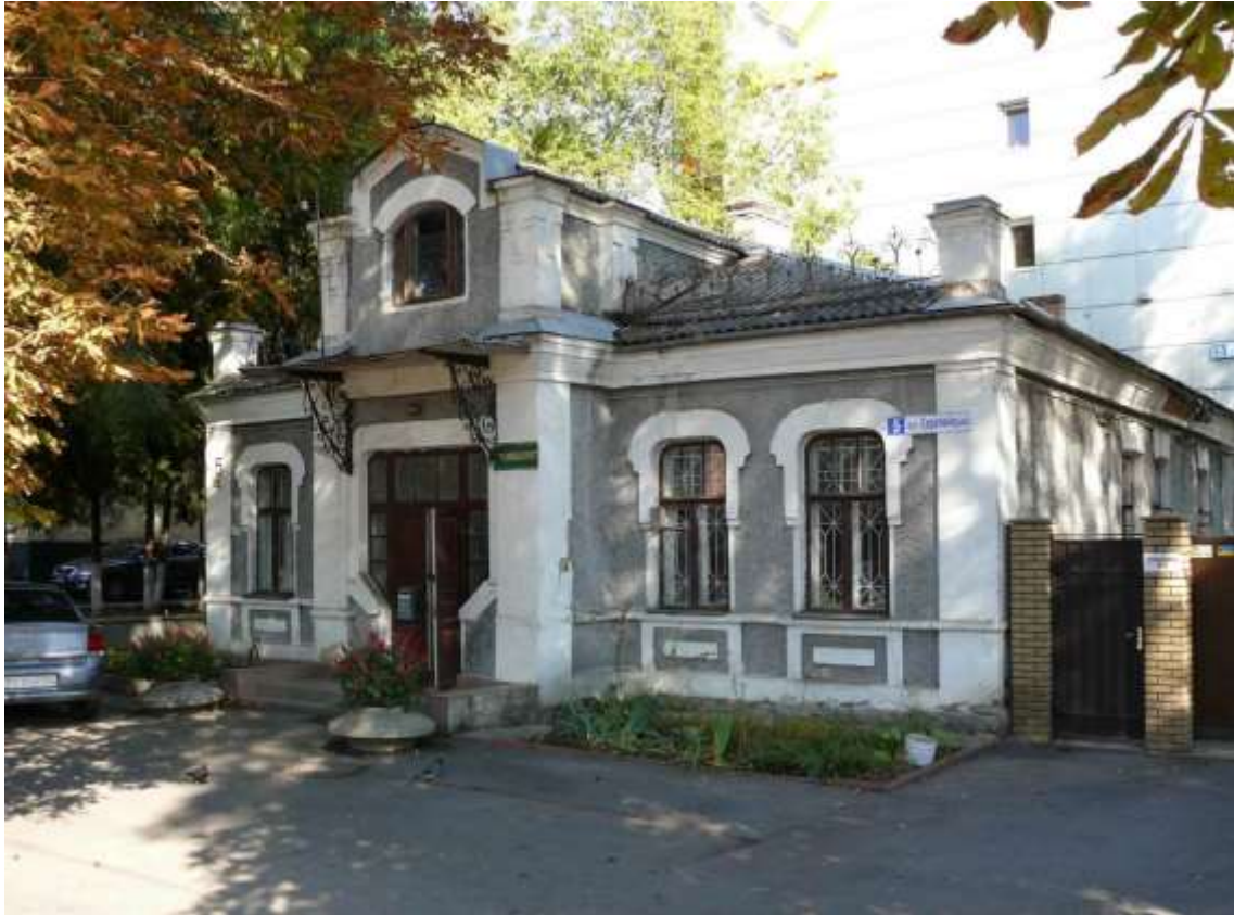
47. Будинок житловий, поч. ХХ ст., вул. Європейська, 5. Фото жовтень 2016 р.

Щойно виявлений об'єкт культурної спадщини за видом архітектури.