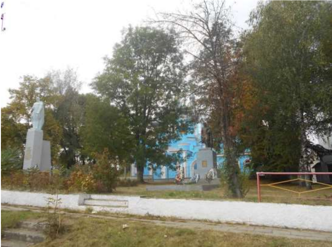
65. Пам'ятний знак на честь воїнів-односельців та братська могила радянських воїнів, вул. Кам'янецька, 172. Фото жовтень 2016 р. Пам'ятка історії місцевого значення.