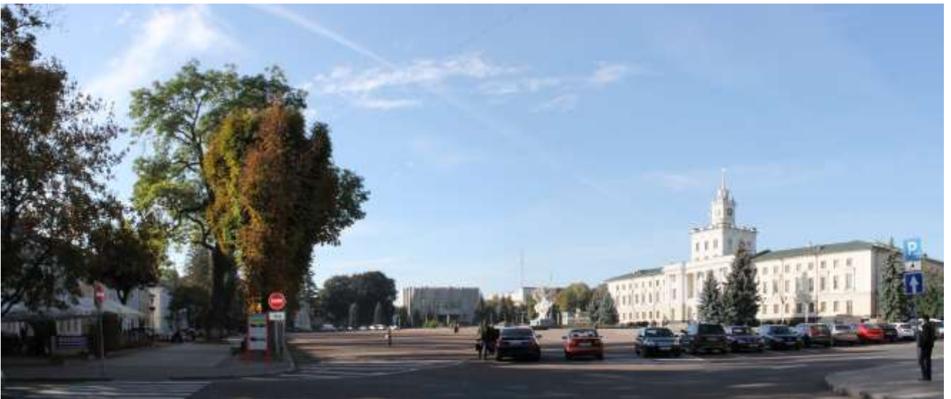
2. Майдан Незалежності. Фото жовтень 2016 р.