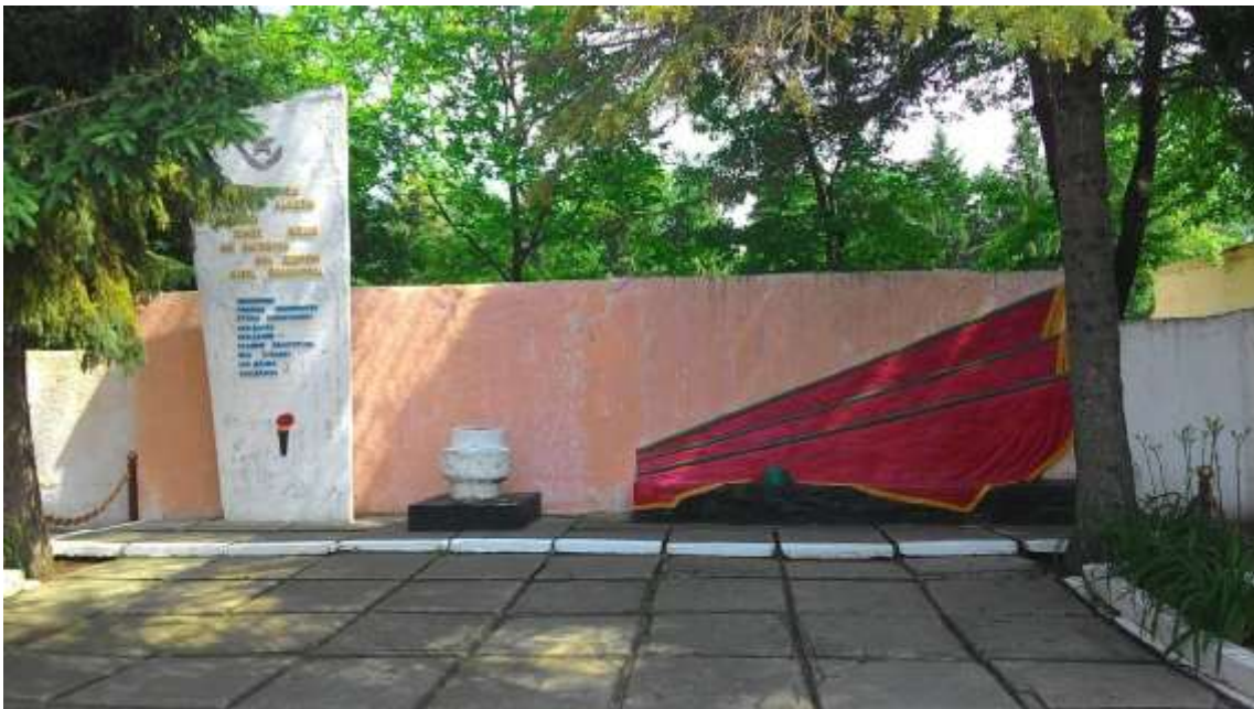
152. Братська могила воїнів радянської армії, 1941-42 рр., вул. Чорновола, територія в/ч. Фото жовтень 2016 р. Пам'ятка історії місцевого значення.