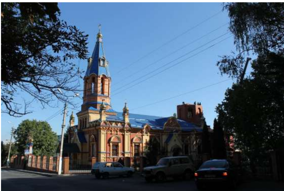
70. Церква св. Миколая Чудотворця (собор св. апостола Андрія Первозванного), 1904 р., поч. ХХІ ст., вул. Козацька, 69. Фото жовтень 2016 р.

Щойно виявлений об'єкт культурної спадщини за видом архітектури.