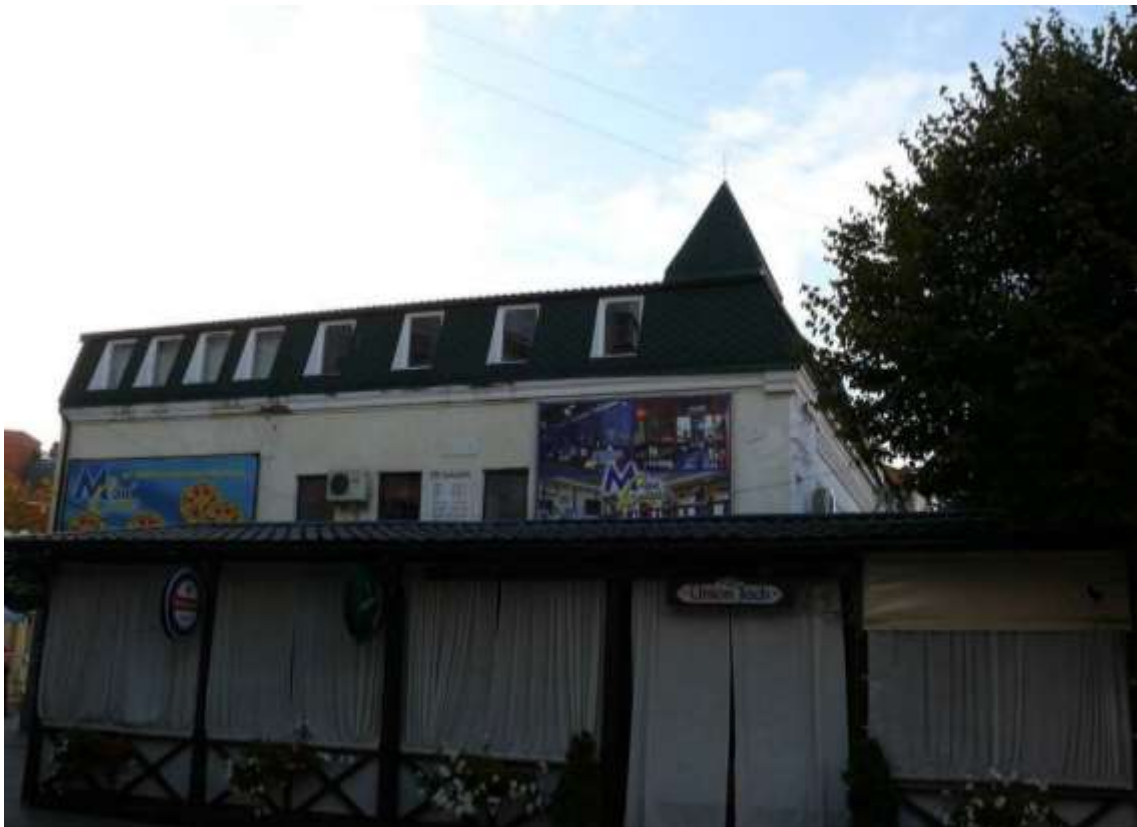
88. Будинок прибутковий Л. Хаселева, 1898 р., поч. XXI ст., вул. Проскурівська, 6. Фото жовтень 2016 р. Щойно виявлений об'єкт культурної спадщини за видом архітектури.