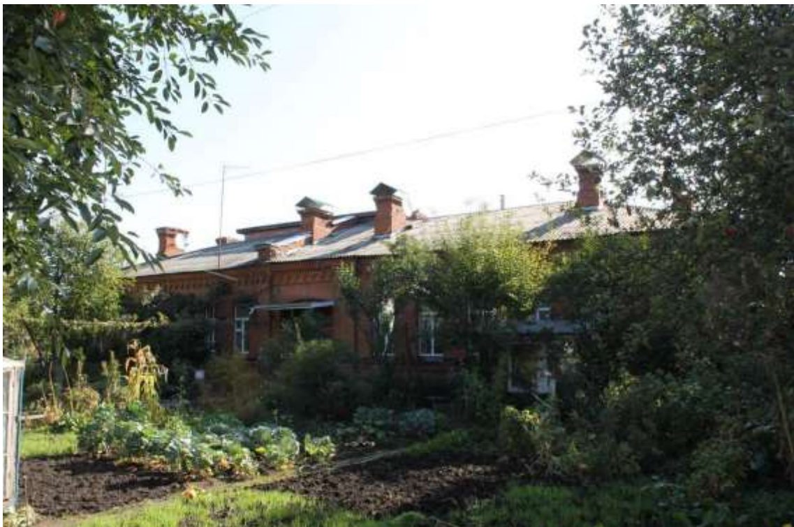
144. Будинок житловий, 1890-ті рр., вул. І. Франка, 43.

Щойно виявлений об'єкт культурної спадщини за видом архітектури.