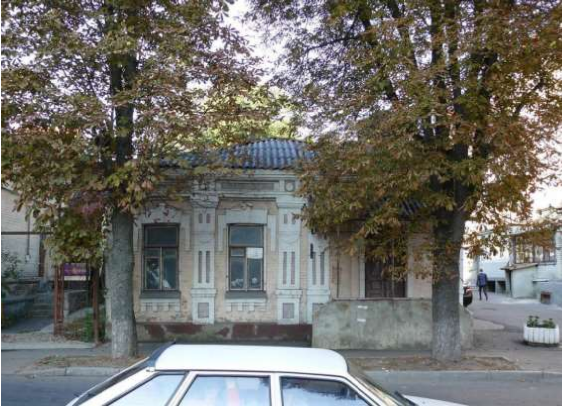
41. Будинок житловий, кін. XIX ст., вул. Грушевського, 94. Фото жовтень 2016 р.

Щойно виявлений об'єкт культурної спадщини за видом архітектури.