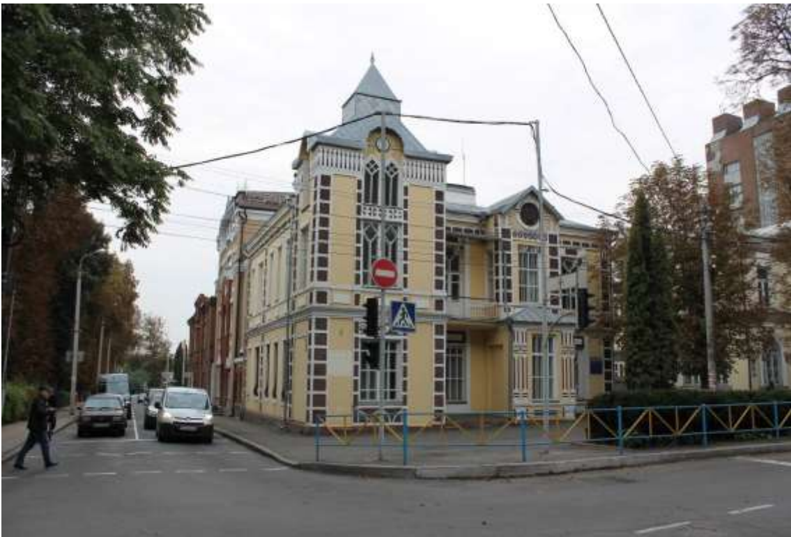
42. Особняк, в якому в 1920-30 рр. розміщувався штаб 8-ої кавалерійської дивізії Червоного козацтва, поч. XX ст., 1920-30 рр., вул. Грушевського, 95. Фото жовтень 2016 р.

Щойно виявлений об'єкт культурної спадщини за видом архітектури.