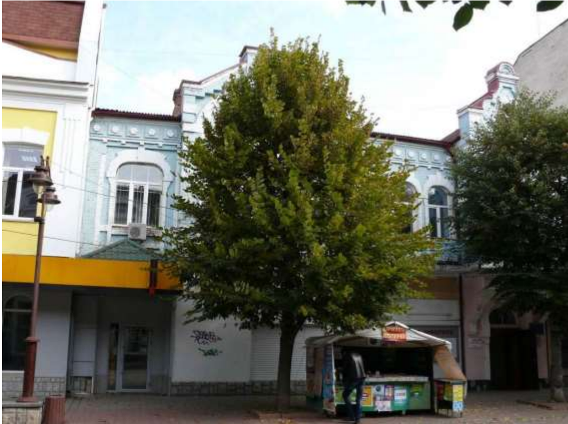
93. Будинок житловий, поч. ХХ ст., вул. Проскурівська, 17.