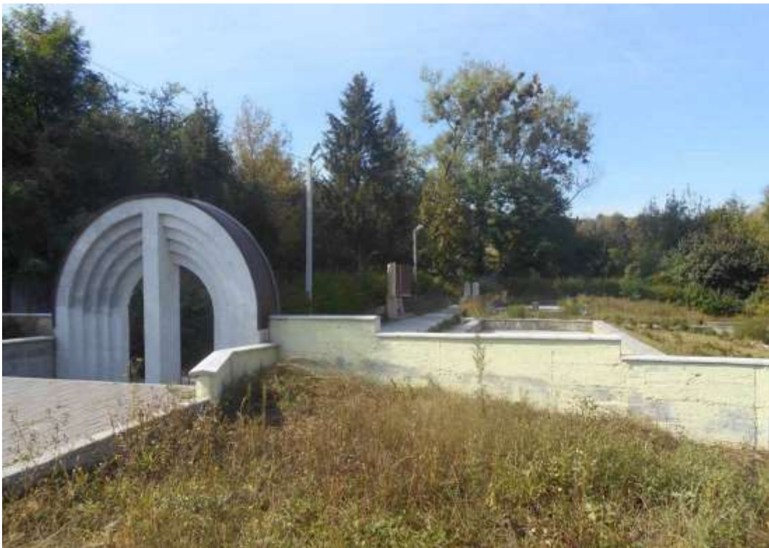
126. Братська могила жертв нацизму, 1941-43 рр., 1967 р., 2015 р., вул. Сільськогосподарська, 5/1. Фото жовтень 2016 р. Пам'ятка історії місцевого значення.