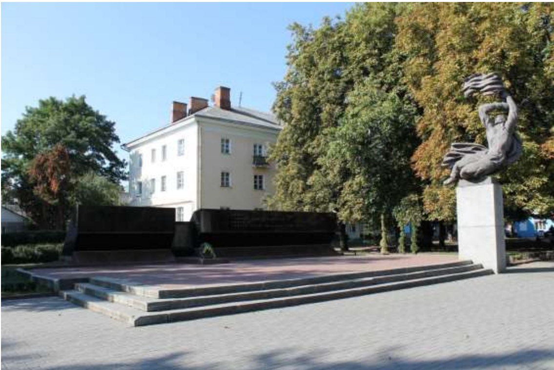
108. Братська могила радянських воїнів, 1944 р., 1948 р., 1974 р., вул. Проскурівська, 60/1. Фото жовтень 2016 р.

Щойно виявлений об'єкт культурної спадщини за видом архітектури.