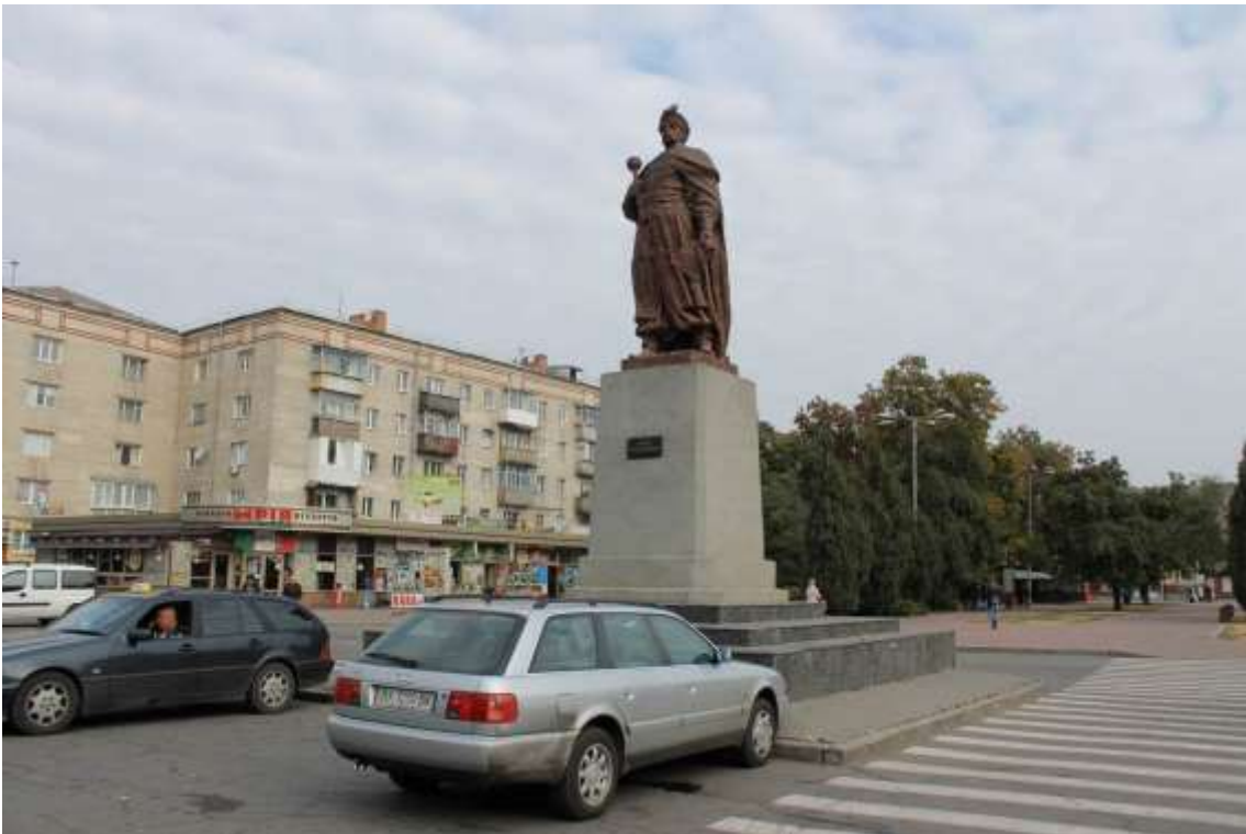
116. Пам'ятник Б. Хмельницькому, 1955 р., вул. Проскурівська, 90. Фото жовтень 2016 р. Пам'ятка монументального мистецтва місцевого значення.