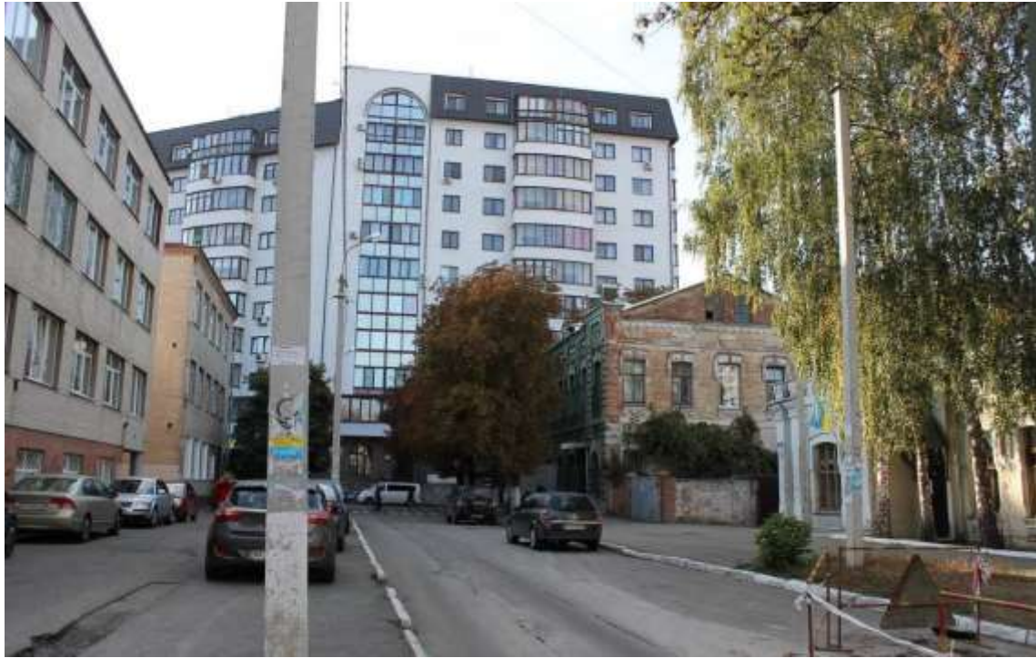
18. Забудова вул. Пилипчука. Вигляд в бік вул. Володимирської. Фото жовтень 2016 р.