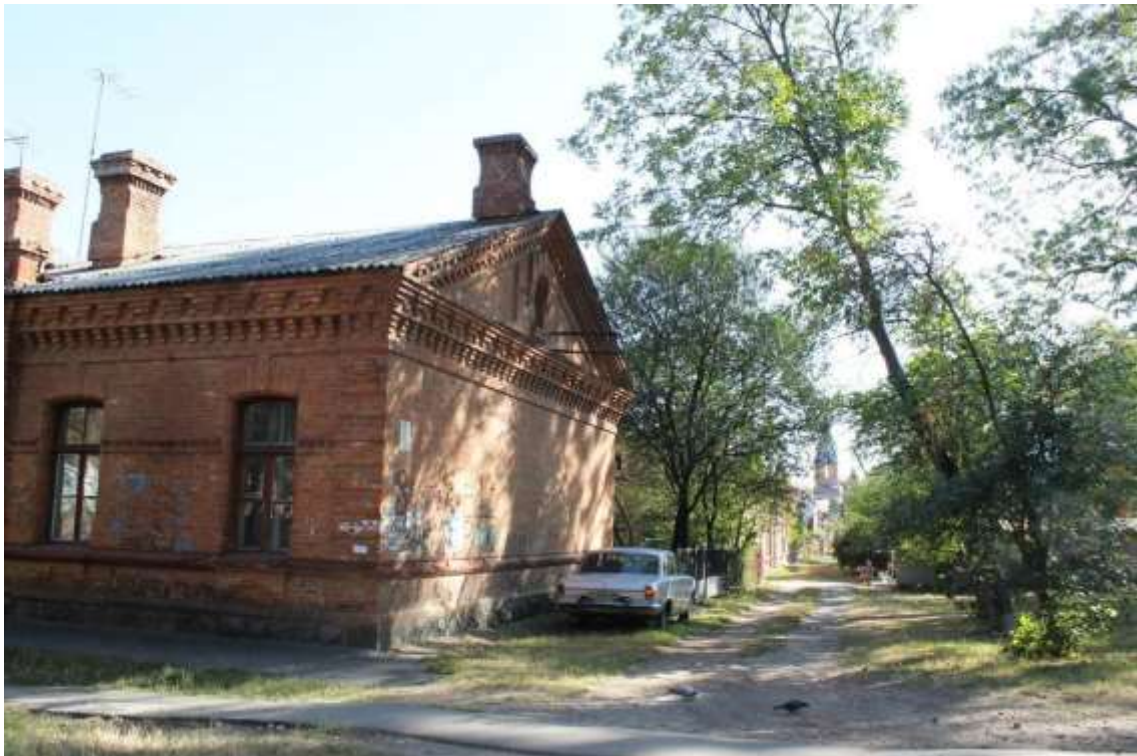
17. Забудова вул. Гастело. Вигляд на собор св. апостола Андрія Первозванного від будинка по вул. Гастело, 8. Фото жовтень 2016 р.