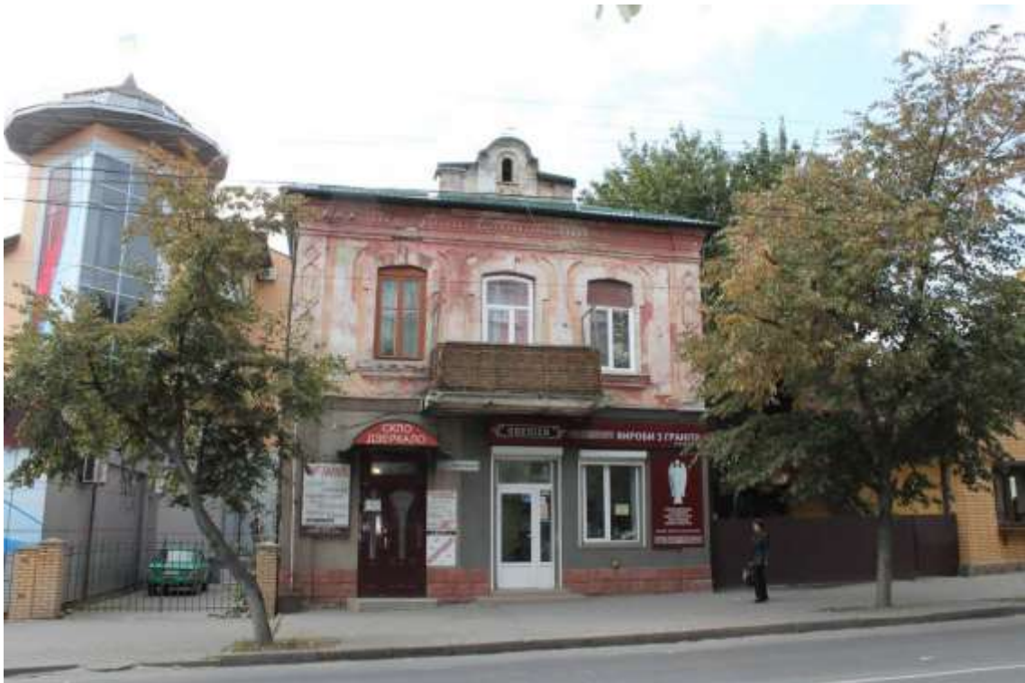
52. Будинок житловий, кін. XIX ст., вул. Кам'янецька, 18. Фото жовтень 2016 р. Щойно виявлений об'єкт культурної спадщини за видом архітектури.