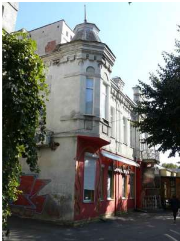
112. Будинок прибутковий, 1901 р. вул. Проскурівська, 67 (69). Фото жовтень 2016 р.

Щойно виявлений об'єкт культурної спадщини за видом архітектури.