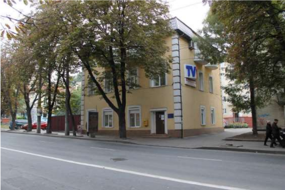
57. Будинок прибутковий, кін. ХІХ ст., поч. ХХІ ст., вул. Кам'янецька, 66. Фото жовтень 2016 р. Щойно виявлений об'єкт культурної спадщини за видом архітектури.