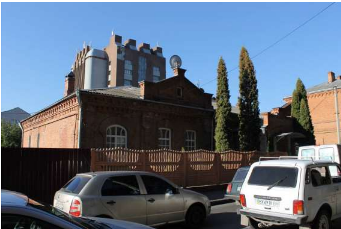
48. Будинок житловий, кін. 1890-х рр., вул. Європейська, 6. Фото жовтень 2016 р.

Щойно виявлений об'єкт культурної спадщини за видом архітектури.