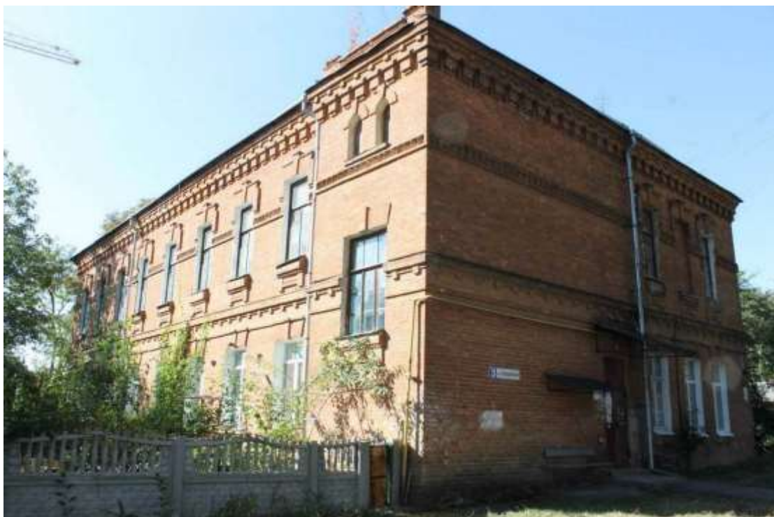
2. Будинок житловий, 1890-ті рр., вул. Петра Болбочана, 3. Фото жовтень 2016 р.

Щойно виявлений об'єкт культурної спадщини за видом археологічний.