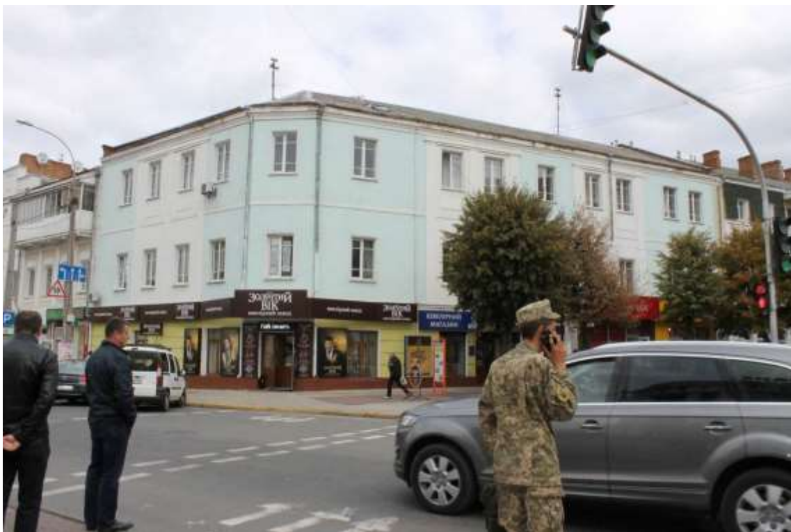
84. Будинок прибутковий Барака, кін. ХІХ ст., 1980-ті рр., вул. Прокурівська, 1. Фото жовтень 2016 р. Щойно виявлений об'єкт культурної спадщини за видом архітектури.