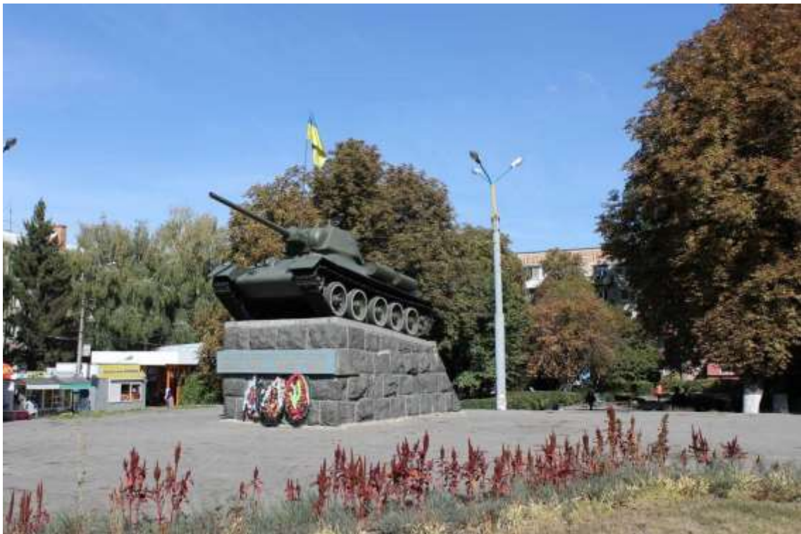
64. Пам'ятник на честь боїв за звільнення м. Хмельницький, 1944 р., 1967 р., вул. Кам'янецька, 111. Фото жовтень 2016 р. Пам'ятка історії місцевого значення.