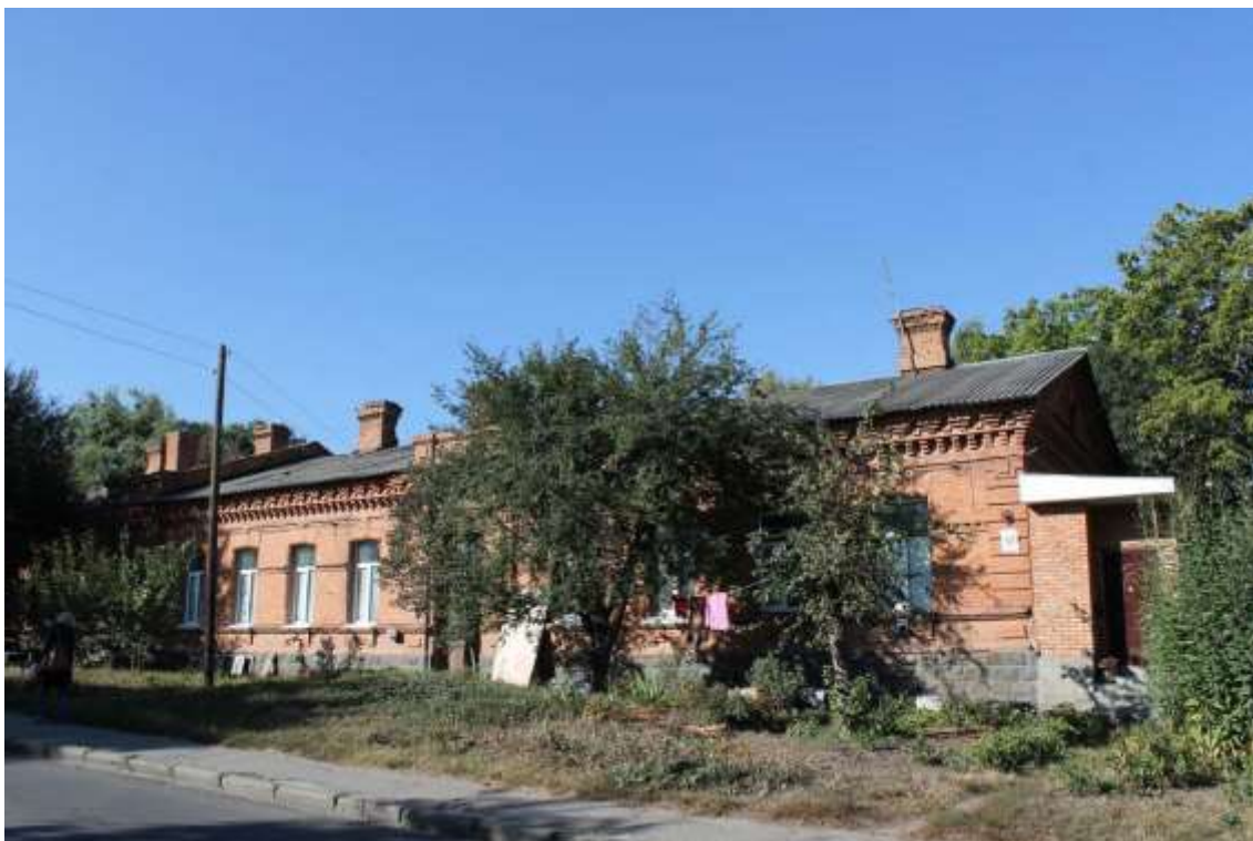
69. Будинок житловий, 1890-ті рр., вул. Козацька, 56. Фото жовтень 2016 р.

Щойно виявлений об'єкт культурної спадщини за видом архітектури.