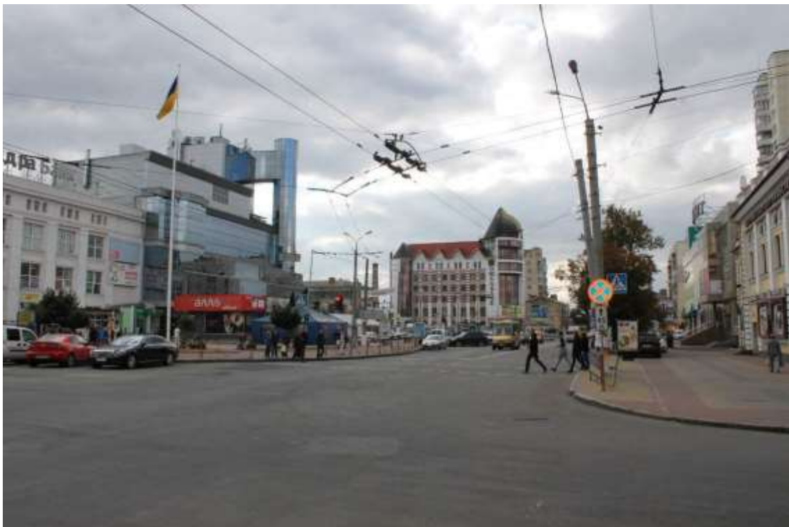
7. Вигляд з боку вул. Соборної в бік вул. Подільської. Фото жовтень 2016 р.