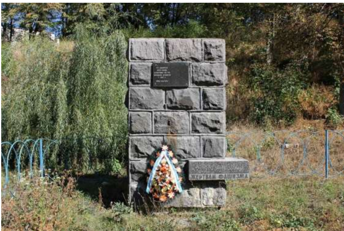
124. Братська могила жертв нацизму, вул. Степана Разіна, 1. Фото жовтень 2016 р. Щойно виявлений об'єкт культурної спадщини за видом архітектури.