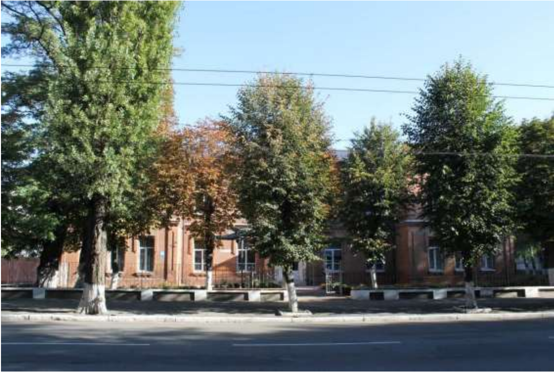
115. Будівля Міського училища, 1906 р., вул. Проскурівська, 83. Фото жовтень 2016 р. Щойно виявлений об'єкт культурної спадщини за видом архітектури.