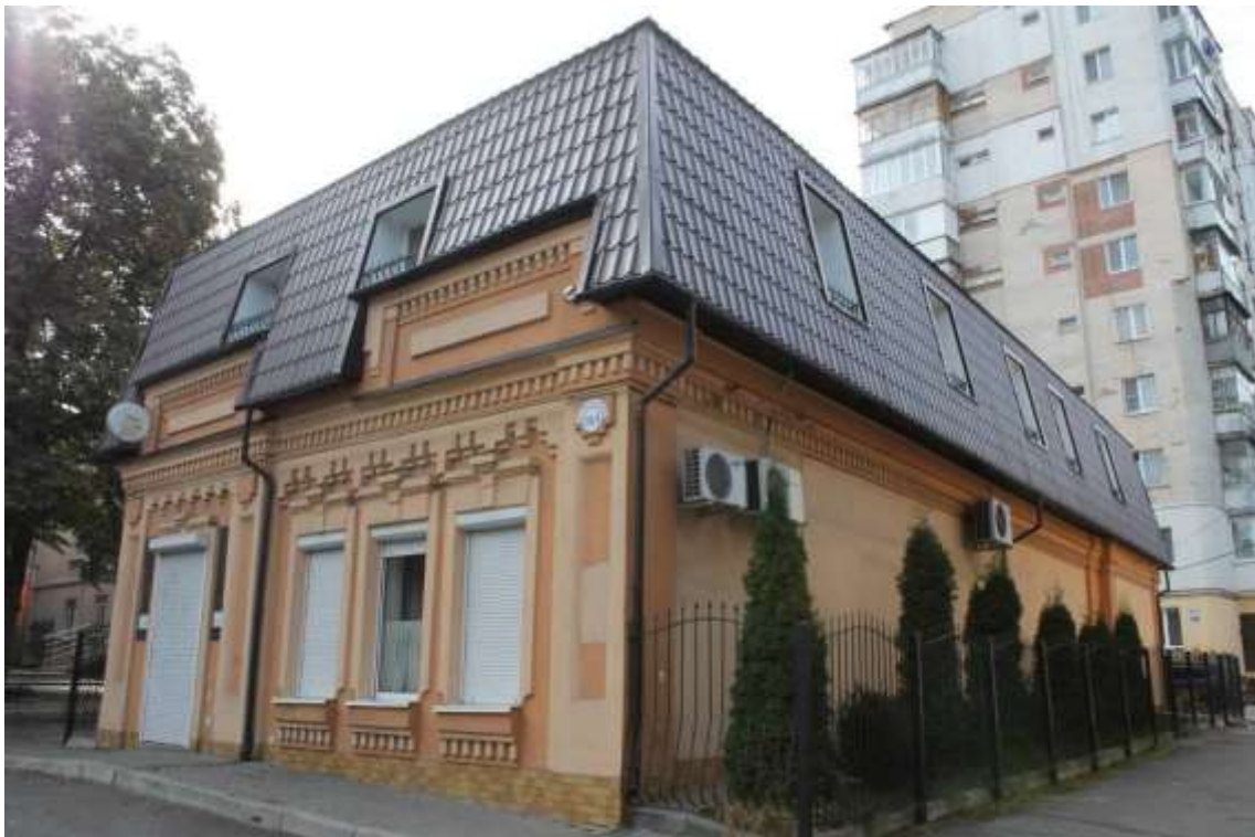
56. Будинок житловий, кін. XIX ст., поч. XXI ст., вул. Кам'янецька, 58/1. Фото жовтень 2016 р. Щойно виявлений об'єкт культурної спадщини за видом архітектури.