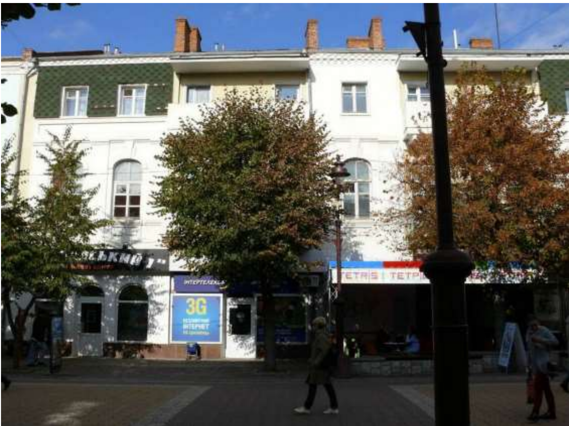
86. Будинок прибутковий Зільбермана, XIX ст., вул. Проскурівська, 3. Фото жовтень 2016 р.

Щойно виявлений об'єкт культурної спадщини за видом архітектури.