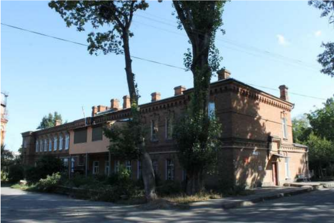
3. Будинок житловий, 1890-ті рр., вул. Петра Болбочана, 8. Фото жовтень 2016 р.

Щойно виявлений об'єкт культурної спадщини за видом архітектури.