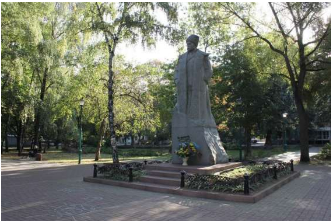
102. Пам'ятник Т.Г. Шевченку, 1992 р., вул. Проскурівська, 40. Фото жовтень 2016 р. Пам'ятка монументального мистецтва місцевого значення.