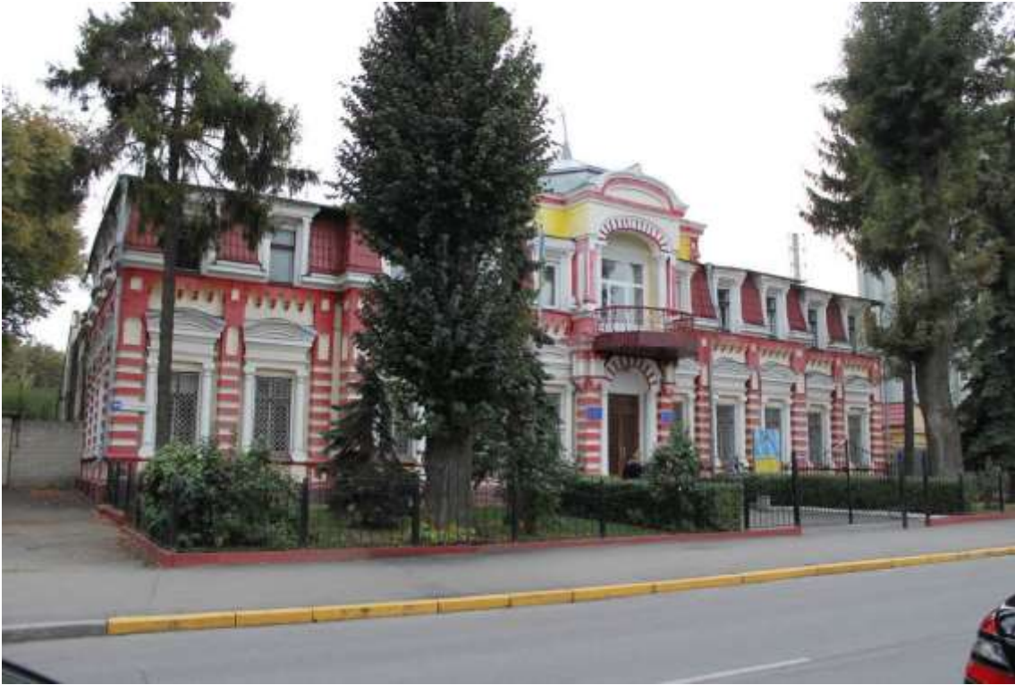
31. Будівля Поштово-телеграфної контори, поч. ХХ ст., вул. Героїв Майдану, 64. Фото жовтень 2016 р. Щойно виявлений об'єкт культурної спадщини за видом архітектури.