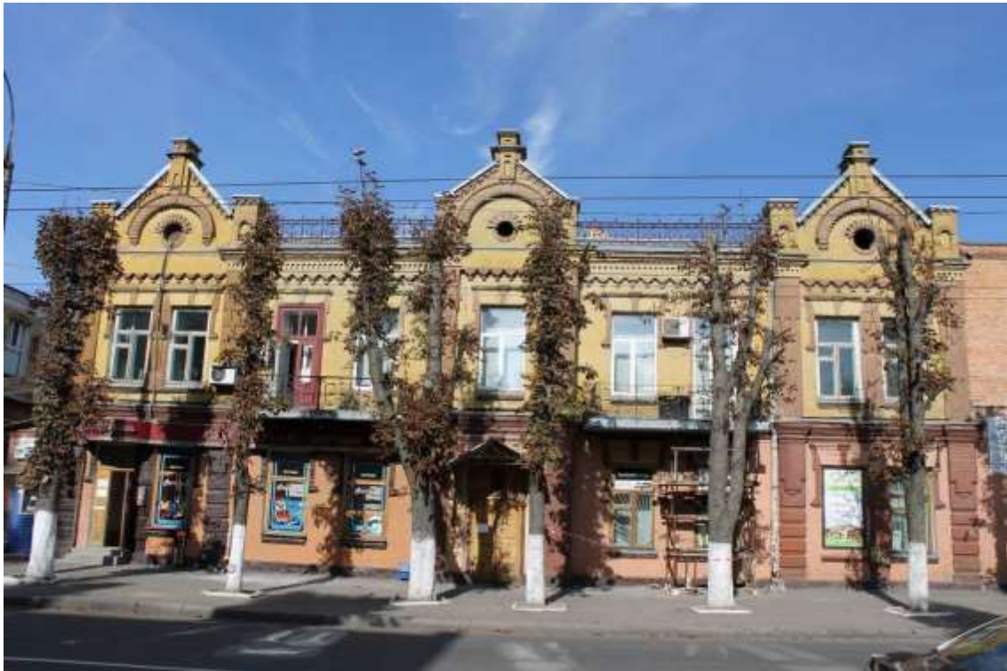
157. Адміністративний корпус спиртоочисного складу Акцизного управління, 1905 р., вул. Шевченка, 69. Фото жовтень 2016 р. Щойно виявлений об'єкт культурної спадщини за видом архітектури.