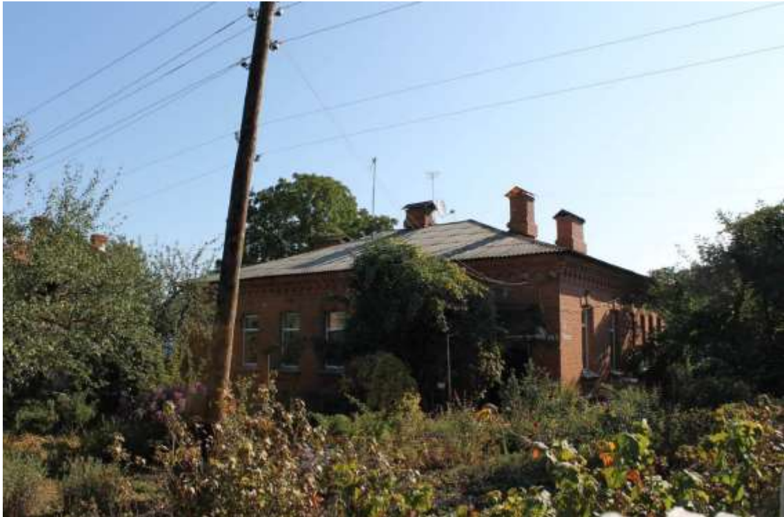
143. Будинок житловий, 1890-ті рр., вул. І. Франка, 41.