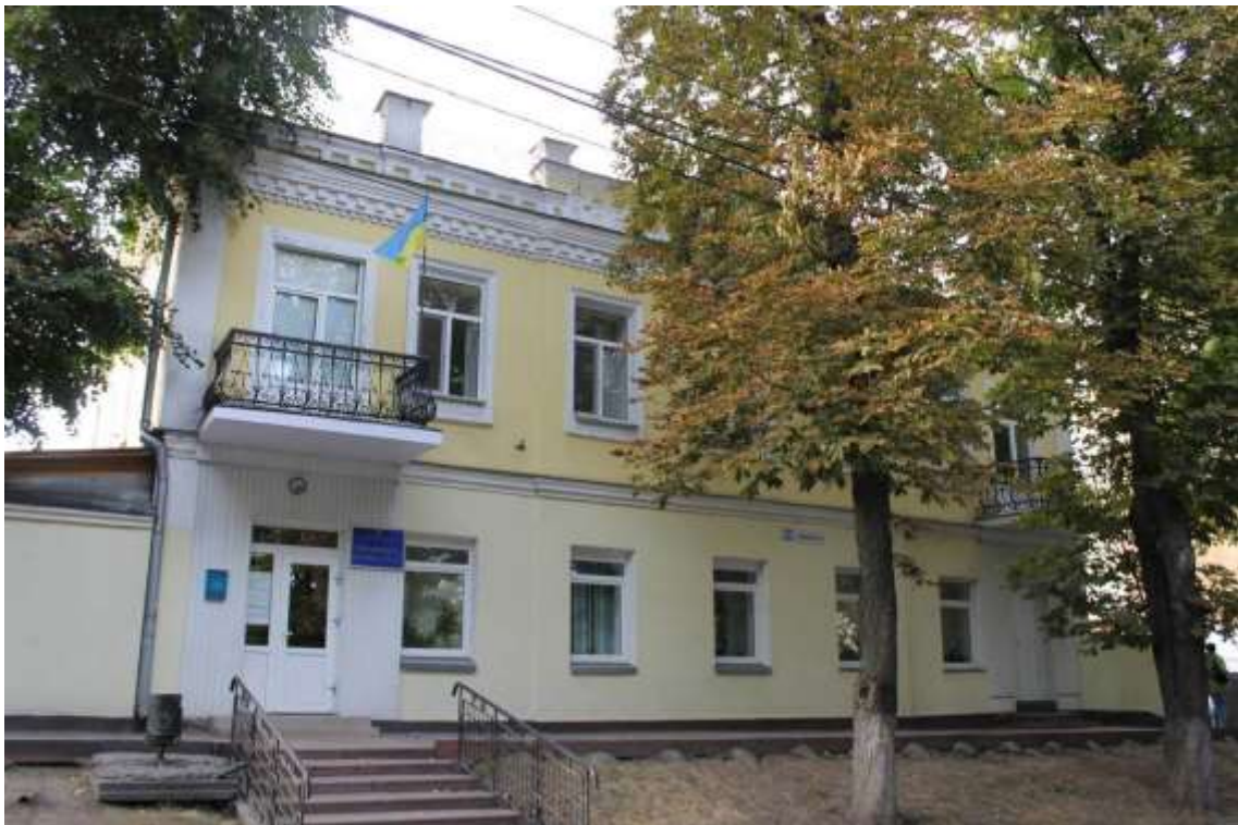
36. Будинок житловий, кін. XIX ст., вул. Грушевського, 64. Фото жовтень 2016 р. Пам'ятка історії місцевого значення, щойно виявлений об'єкт культурної спадщини за видом архітектури.