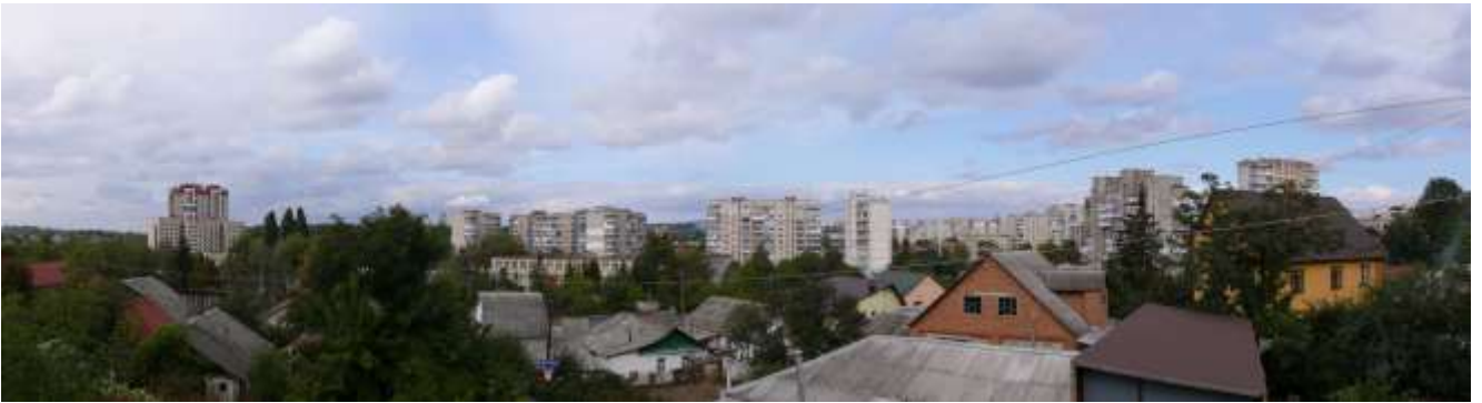
1. Вигляд від Свято-Покровського собору на Завалля. Фото жовтень 2016 р.