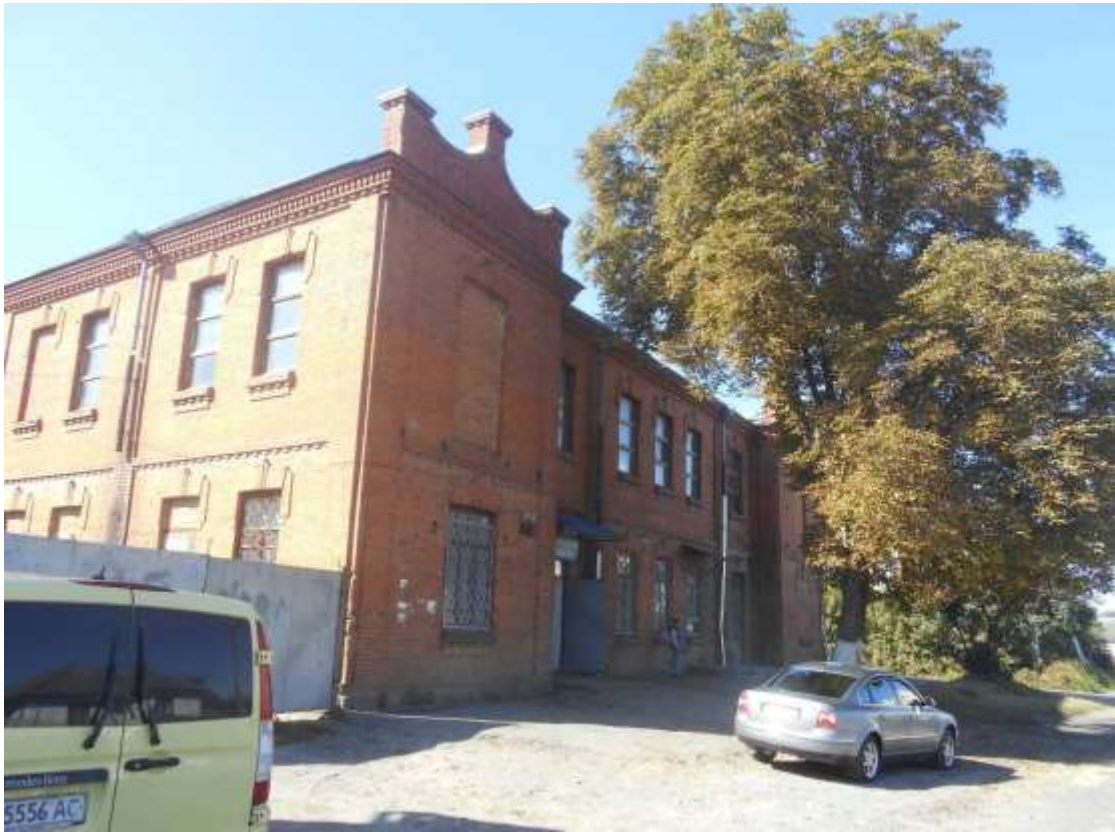
5. Польський Народний дім, 1929 р., вул. Вокзальна, 59. Фото жовтень 2016 р.

Щойно виявлений об'єкт культурної спадщини за видом архітектури.