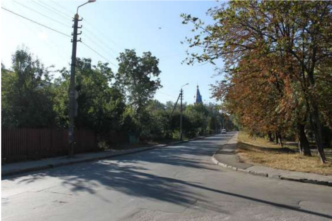
16. Вигляд на собор св. апостола Андрія Первозванного по вул. Козацькій, 69. Фото жовтень 2016 р.