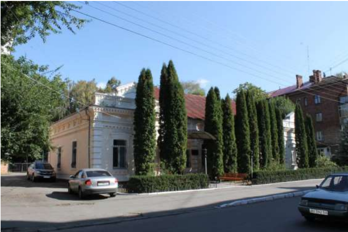
80. Особняк, кін. XIX ст., вул. Пилипчука, 65. Фото жовтень 2016 р. Щойно виявлений об'єкт культурної спадщини за видом архітектури.