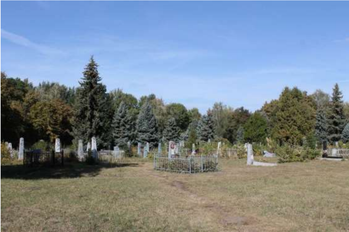
59. Військове кладовище, 1943 р., 1944 р., 1945 р., 1985 р., вул. Кам'янецька, 96. Фото жовтень 2016 р. Пам'ятка історії місцевого значення.