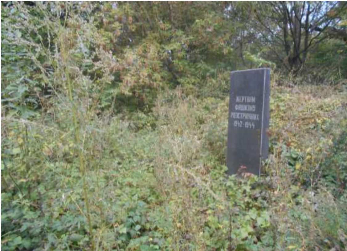
4. Братська могила жертв нацизму, 1942 р., 1955 р., Вінницьке шосе, 4. Фото жовтень 2016 р.

Щойно виявлений об'єкт культурної спадщини за видом архітектури.