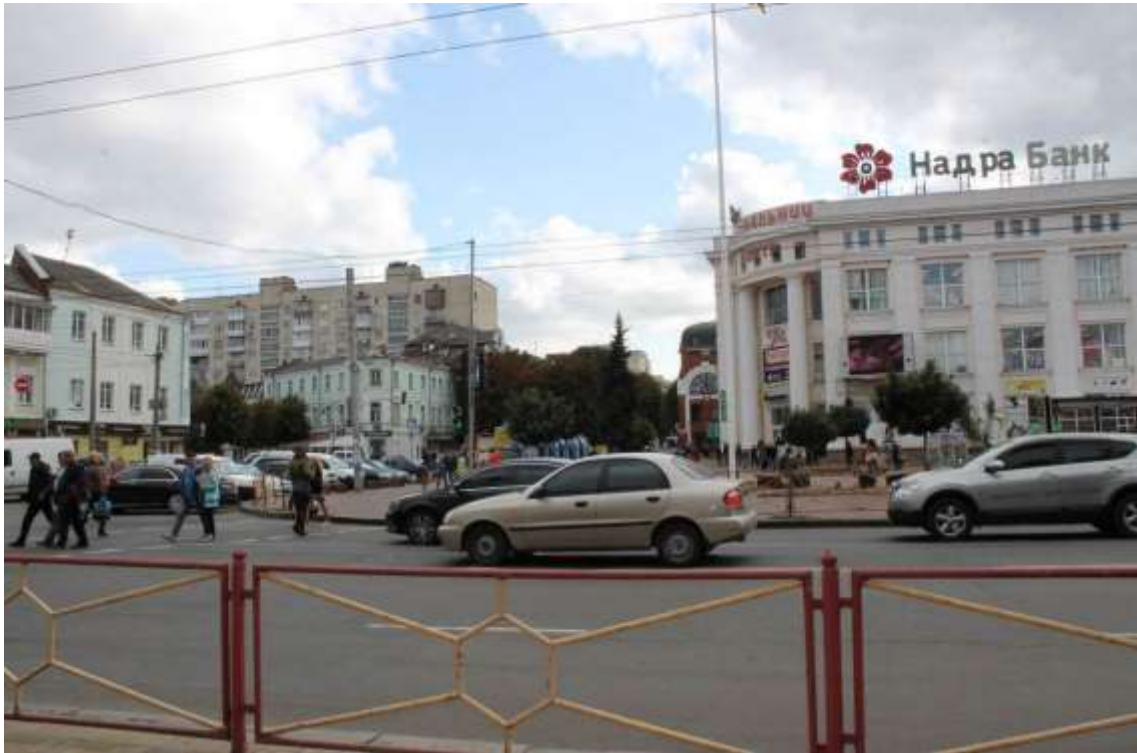
8. Вигляд з боку вул. Подільської в бік вул. Соборної. Фото жовтень 2016 р.