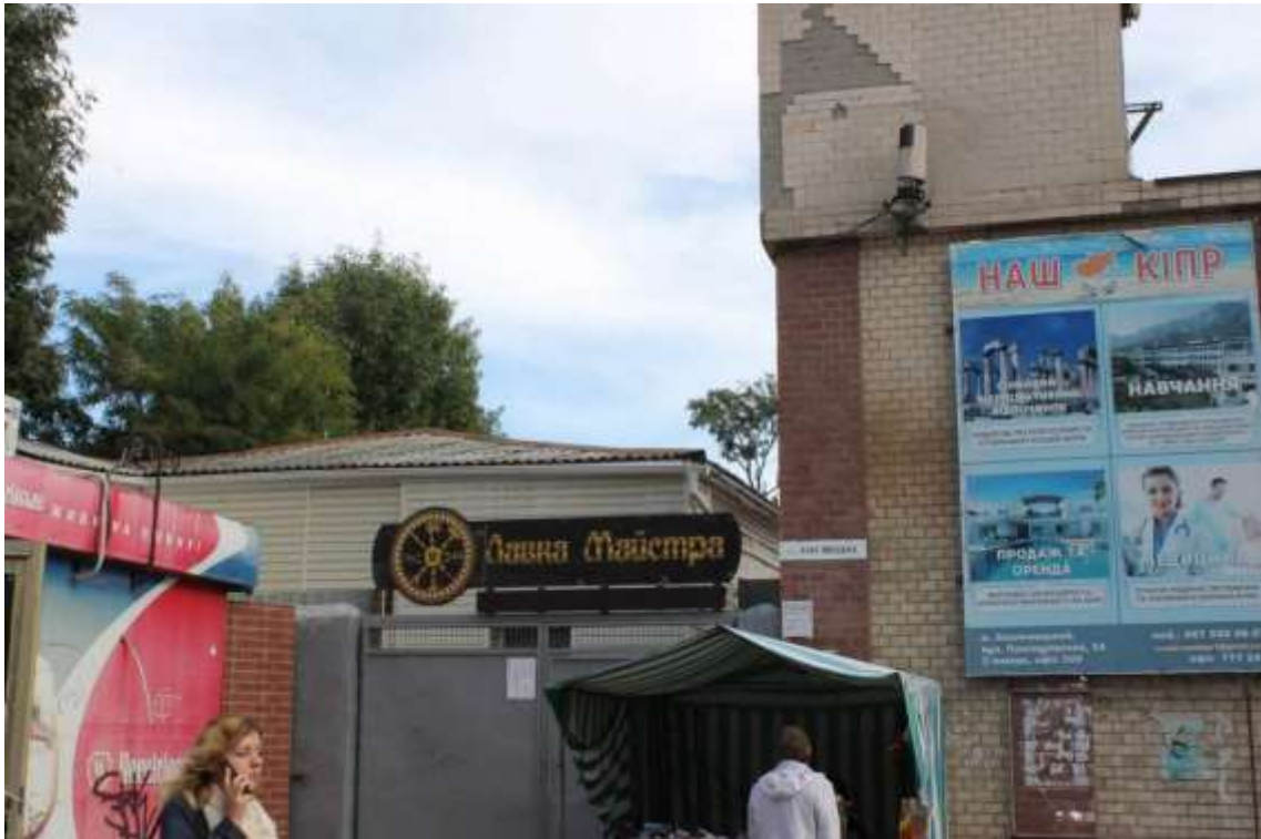
53. Будівля адміністративна, II пол. XIX ст., вул. Кам'янецька, 39. Фото жовтень 2016 р.

Щойно виявлений об'єкт культурної спадщини за видом архітектури.