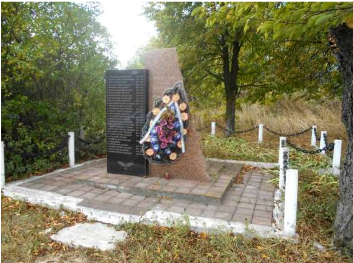
158. Братська могила радянських воїнів, 1944 р., 1,5 км на південь від траси Хмельницький-Чорний Острів, біля п.п. «Агропродукт». Фото жовтень 2016 р. Пам'ятка історії місцевого значення.