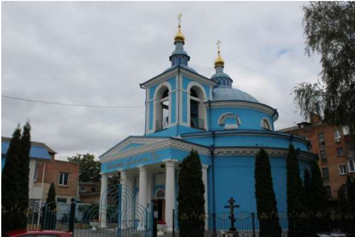
129. Собор Різдва Пресвятої Богородиці, 1837 р., вул. Соборна, 14. Фото жовтень 2016 р.

Щойно виявлений об'єкт культурної спадщини за видом архітектури.