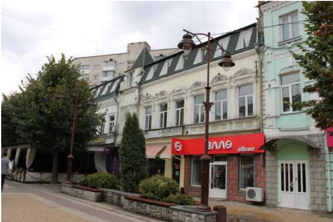
87. Прибуткові будинки, кін. XIX ст., поч. XXI ст., вул. Проскурівська, 4, 6. Фото жовтень 2016 р. Щойно виявлений об'єкт культурної спадщини за видом архітектури.