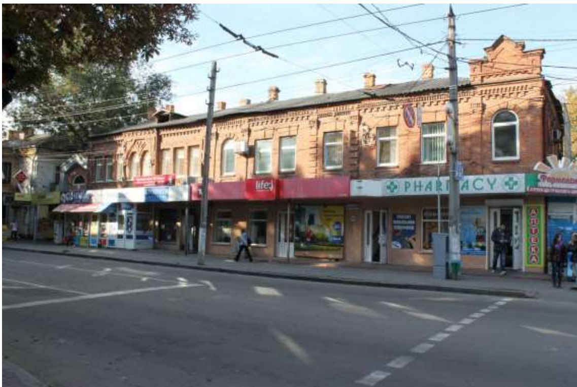
82. Будинки прибуткові, вул. Подільська, 61 (поч. ХХ ст.), 63 (кін. 1890-х рр.). Фото жовтень 2016 р. Щойно виявлений об'єкт культурної спадщини за видом архітектури.