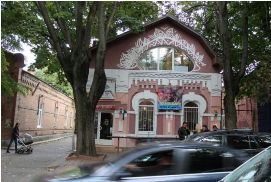
121. Будинок житловий, поч. XX ст., вул. Проскурівського підпілля, 77. Фото жовтень 2016 р. Щойно виявлений об'єкт культурної спадщини за видом архітектури.