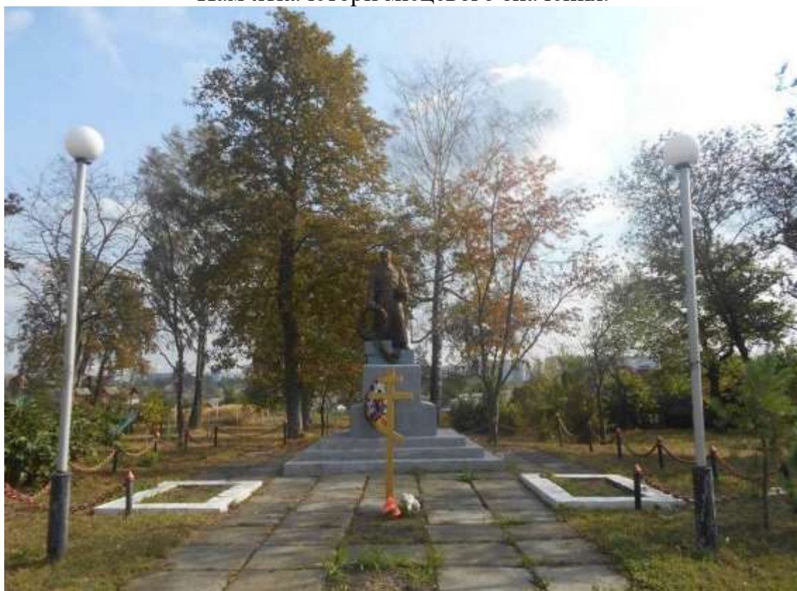
68. Пам'ятний знак на честь воїнів-односельчан, 1941-1944 рр., 1964 р., вул. Карбишева, 6. Фото жовтень 2016 р. Пам'ятка історії місцевого значення.