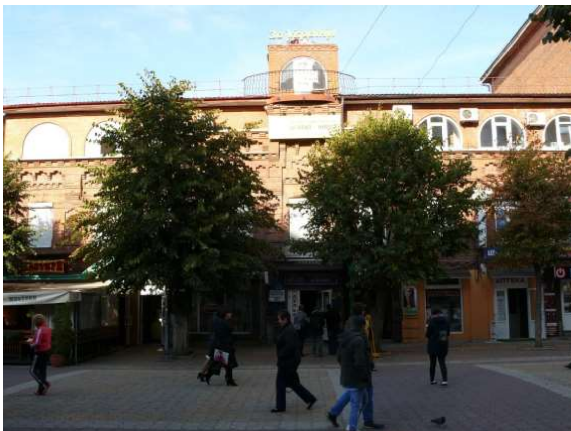
90. Будівля магазину Журавльових, 1903-05 рр., поч. ХХІ ст., вул. Проскурівська, 7. Фото жовтень 2016 р. Щойно виявлений об'єкт культурної спадщини за видом архітектури.