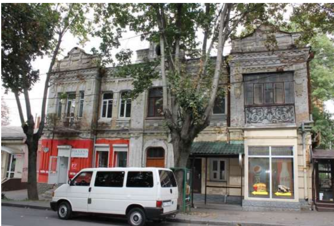
118. Будинок прибутковий, поч. XX ст., вул. Проскурівського підпілля, 60. Фото жовтень 2016 р. Щойно виявлений об'єкт культурної спадщини за видом архітектури.

Щойно виявлений об'єкт культурної спадщини за видом архітектури.