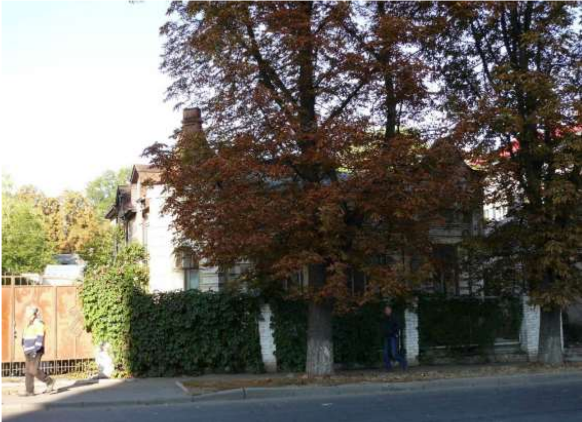
43. Будинок житловий, поч. ХХ ст., вул. Грушевського, 96. Фото жовтень 2016 р. Щойно виявлений об'єкт культурної спадщини за видом архітектури.