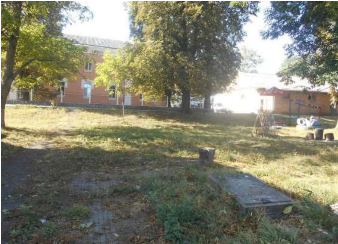
8. Могила В. Байдаченко, 1919 р., 1978 р., вул. Вокзальна, 179. Фото жовтень 2016 р. Пам'ятка історії місцевого значення.