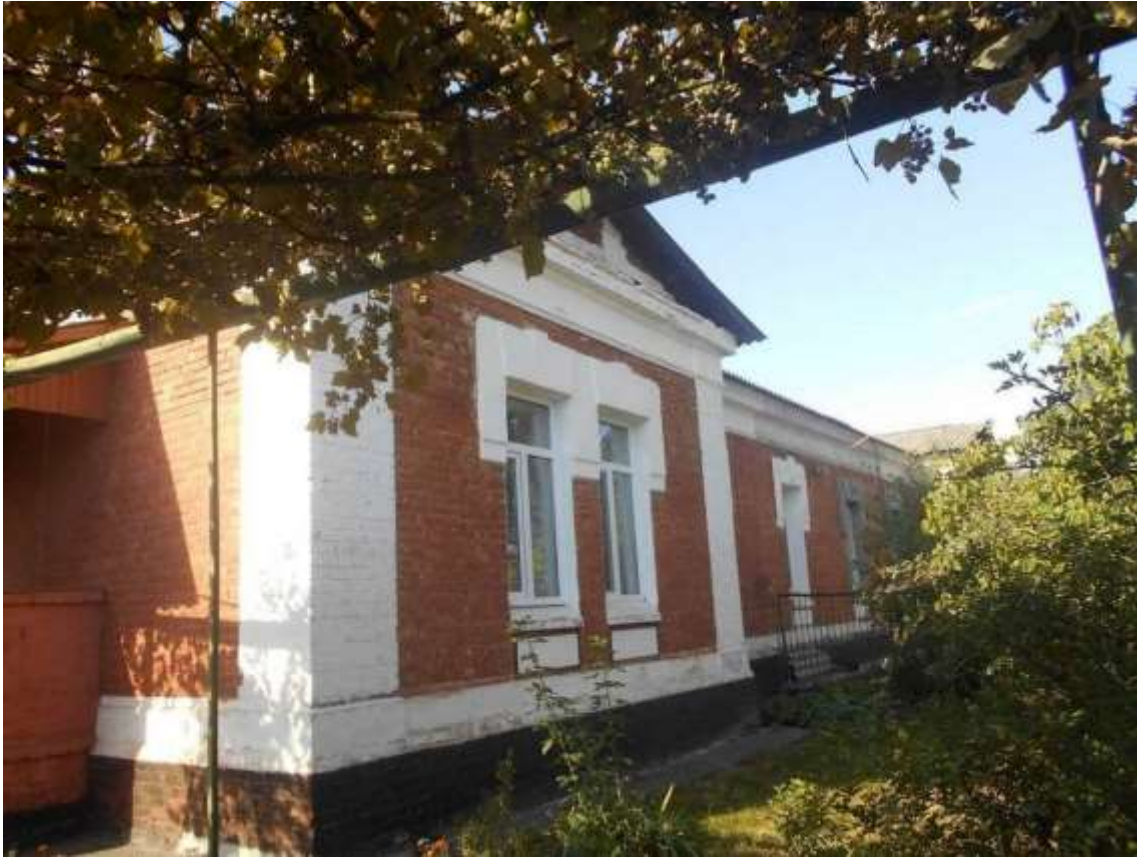
7. Будинок, в якому розміщувався штаб загону Червоної гвардії ст. Гречани, кін. XIX ст., 1917-1918 рр., вул. Вокзальна, 173. Фото жовтень 2016 р. Пам'ятка історії місцевого значення.