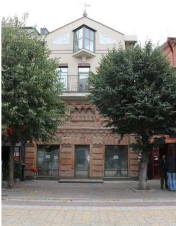
89. Будівля магазину Я.В. Яцемірської, кін. ХІХ ст., поч. ХХІ ст., вул. Проскурівська, 5. Фото жовтень 2016 р. Щойно виявлений об'єкт культурної спадщини за видом архітектури.