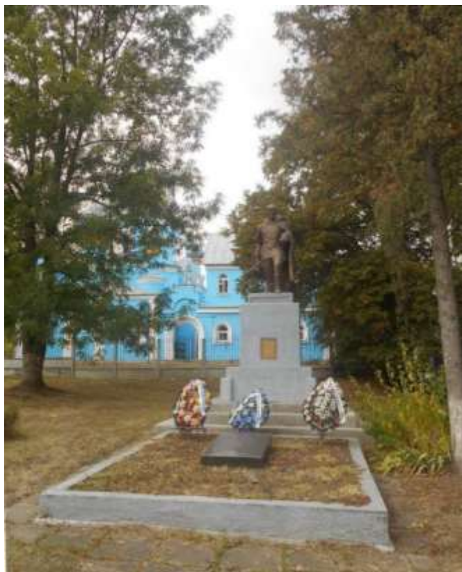
67. Братська могила радянських воїнів, 1944 р., 1967 р., вул. Кам'янецька, 172. Фото жовтень 2016 р. Пам'ятка історії місцевого значення.