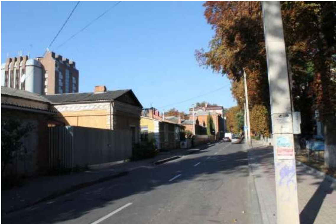
15. Забудова вул. Європейської. Вигляд від садиби по вул. Європейській, 12 в бік вул. Грушевського. Фото жовтень 2016 р.