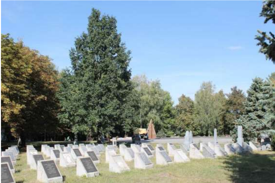
61. Військове кладовище, 1943 р., 1944 р., 1945 р., 1985 р., вул. Кам'янецька, 96. Фото жовтень 2016 р. Пам'ятка історії місцевого значення.