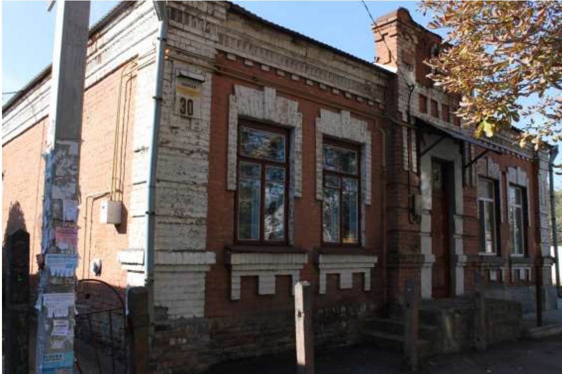
33. Будинок житловий, кін. XIX ст., вул. Грушевського, 30. Фото жовтень 2016 р. Щойно виявлений об'єкт культурної спадщини за видом архітектури.