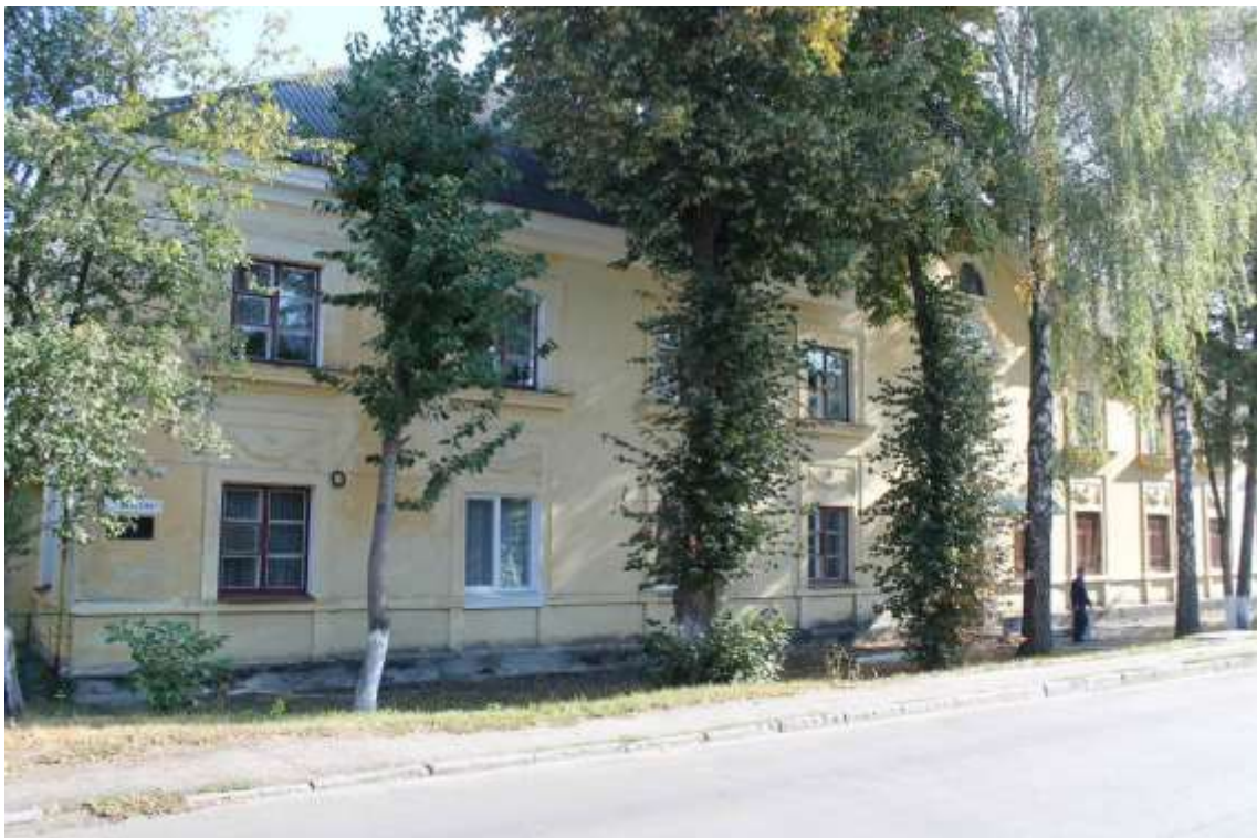
128. Будинок житловий, кін. 1940-х – поч. 1950-х рр., вул. Юхима Сіцинського, 5. Фото жовтень 2016 р. Щойно виявлений об'єкт культурної спадщини за видом архітектури.