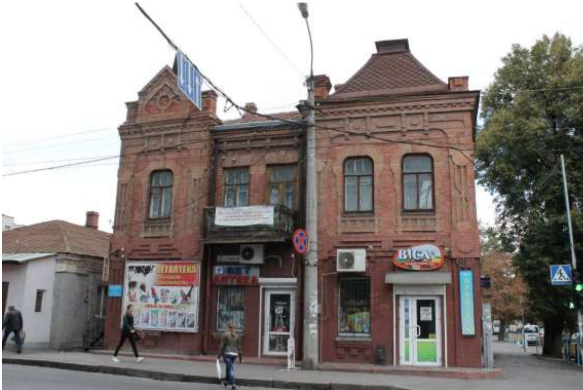
83. Будинок прибутковий, поч. ХХ ст., вул. Подільська, 81. Фото жовтень 2016 р. Щойно виявлений об'єкт культурної спадщини за видом архітектури.