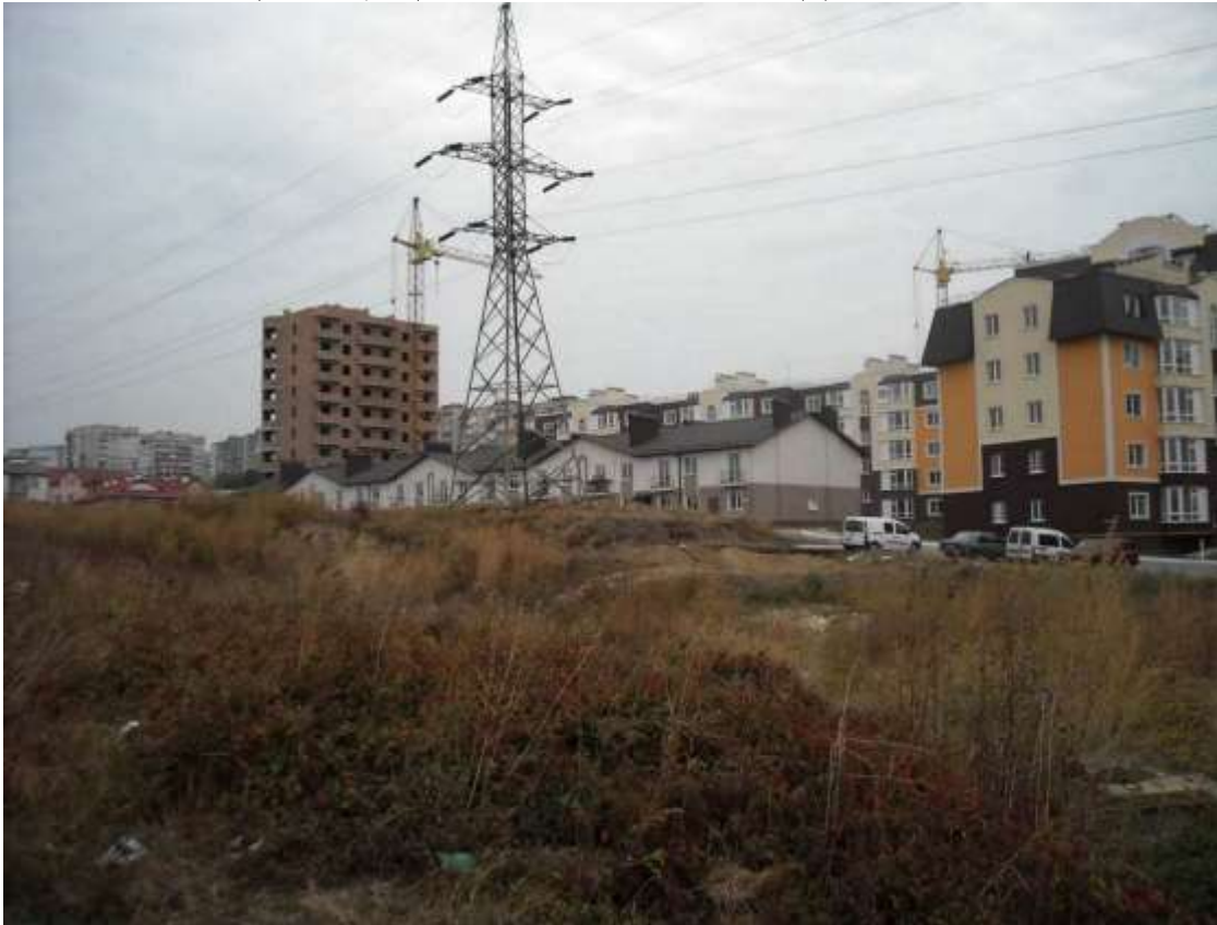
1. Поселення, ранній залізний вік, вул. Бандери, 42/2. Жовтень 2016 р. Фото жовтень 2016 р.

Щойно виявлений об'єкт культурної спадщини за видом археологічний.