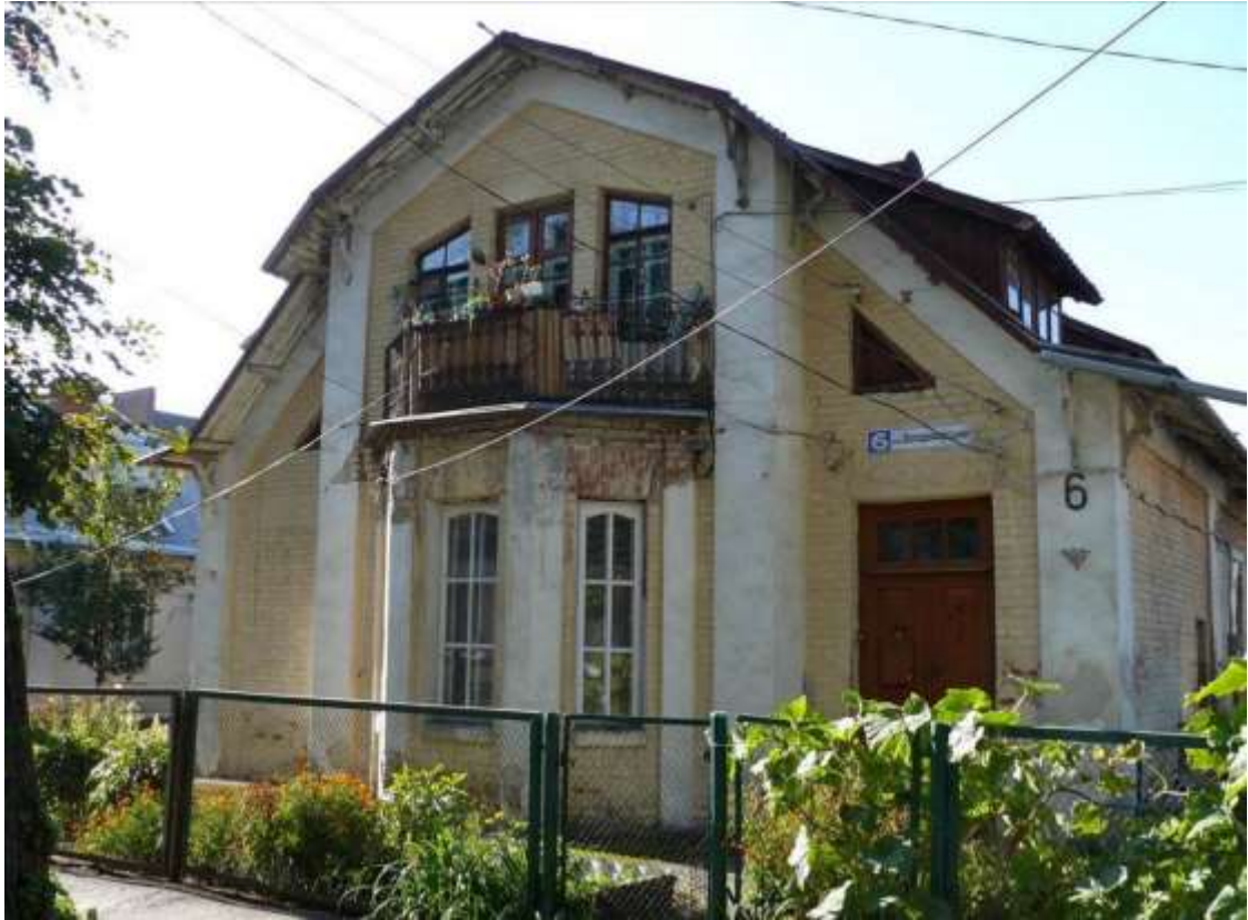
15. Будинок житловий кварталу із типових котеджів, 1920-ті рр., пров. Володимирський, 6. Фото жовтень 2016 р. Щойно виявлений об'єкт культурної спадщини за видом архітектури.