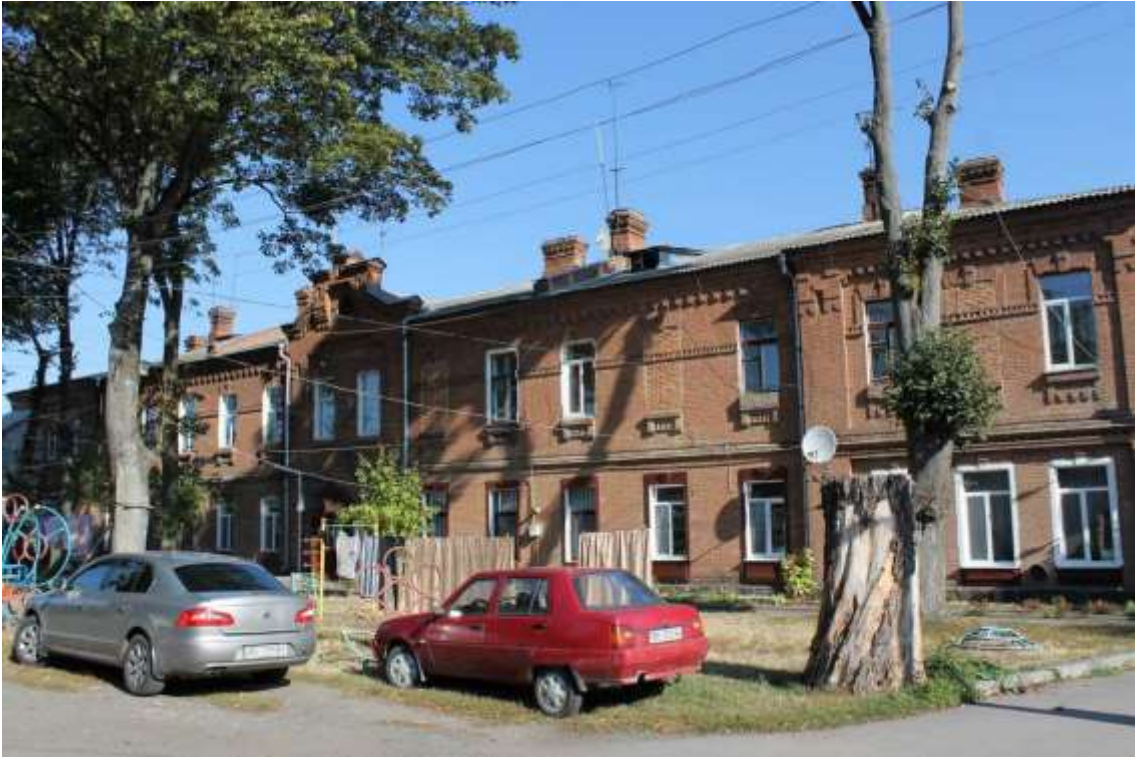
141. Будинок житловий, 1890-ті рр., вул. І. Франка, 36.