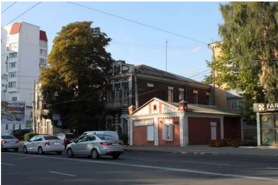
154. Будинок, в якому у 1942-43 рр. відбувались засідання комітету Проскурівської підпільної антифашистської організації, поч. XX ст., 1942-43 рр., вул. Шевченка, 3/1. Фото жовтень 2016 р. Щойно виявлений об'єкт культурної спадщини за видом архітектури.

Щойно виявлений об'єкт культурної спадщини за видом архітектури.