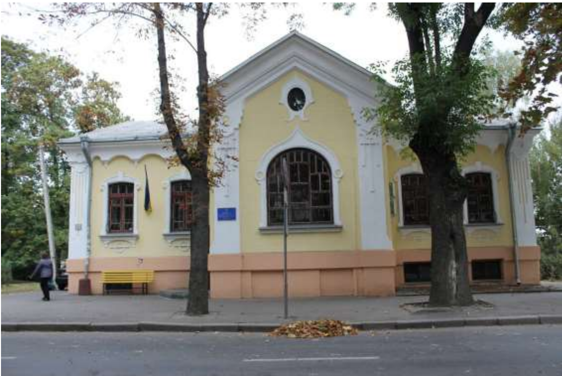
22. Флігель садиби К.К. Кондрацького, 1901 р., вул. Гагаріна, 18. Фото жовтень 2016 р.

Пам'ятка монументального мистецтва місцевого значення.