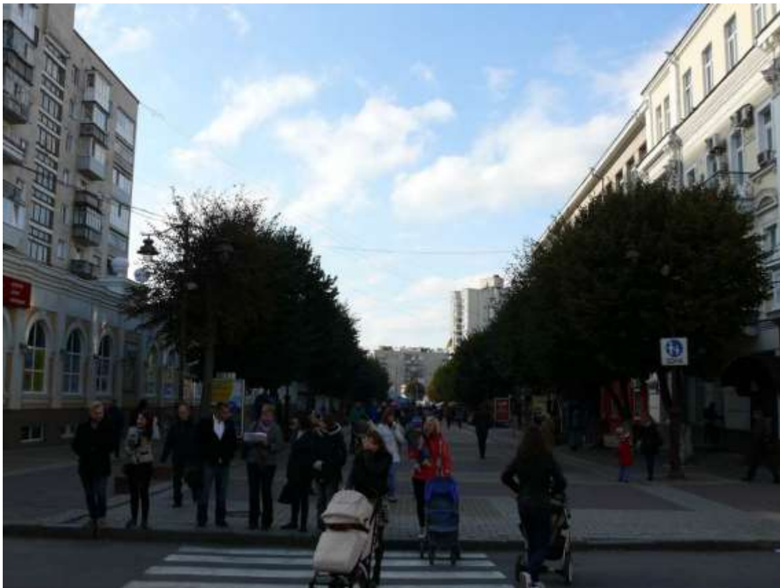
11. Забудова вул. Проскурівської. Вигляд від вул. Проскурівського підпілля в бік вул. Соборної. Фото жовтень 2016 р.