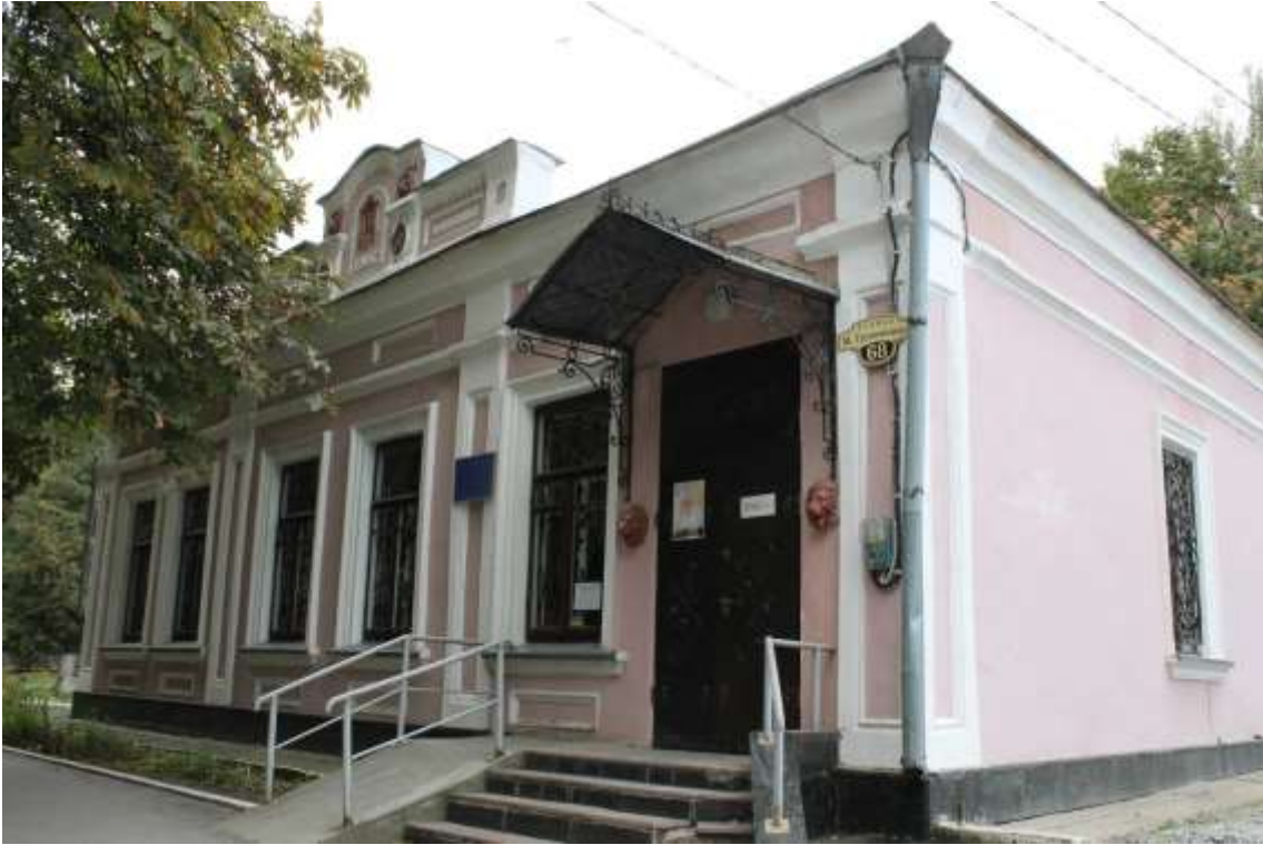
37. Будинок житловий, 1905 р., вул. Грушевського, 68.