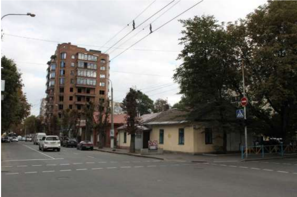
14. Забудова вул. Подільської від вул. Михайла Грушевського. Фото жовтень 2016 р.