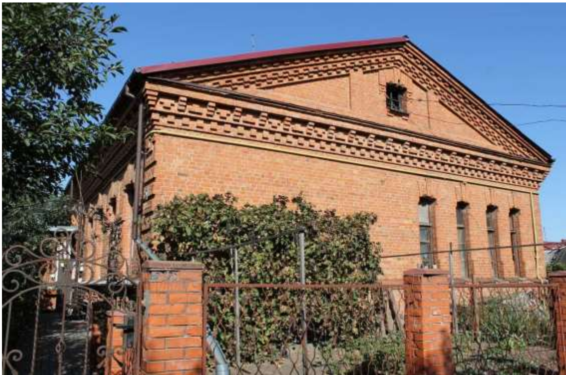
148. Будинок житловий, 1890-ті рр., пров. І. Франка, 5. Фото жовтень 2016 р.

Щойно виявлений об'єкт культурної спадщини за видом архітектури.