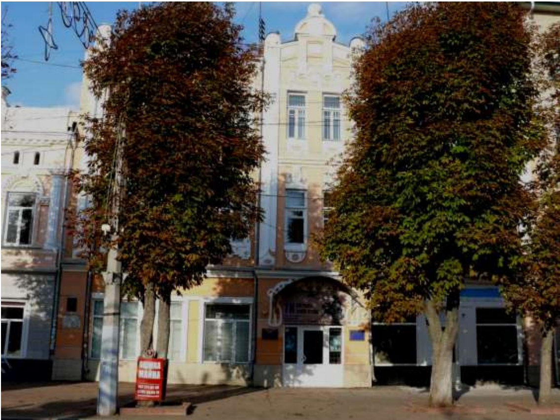
100. Будинок прибутковий Ф. Жидовецького, поч. ХХ ст., 1920 р., вул. Проскурівська, 35. Фото жовтень 2016 р. Пам'ятка історії місцевого значення, щойно виявлений об'єкт культурної спадщини за видом архітектури.