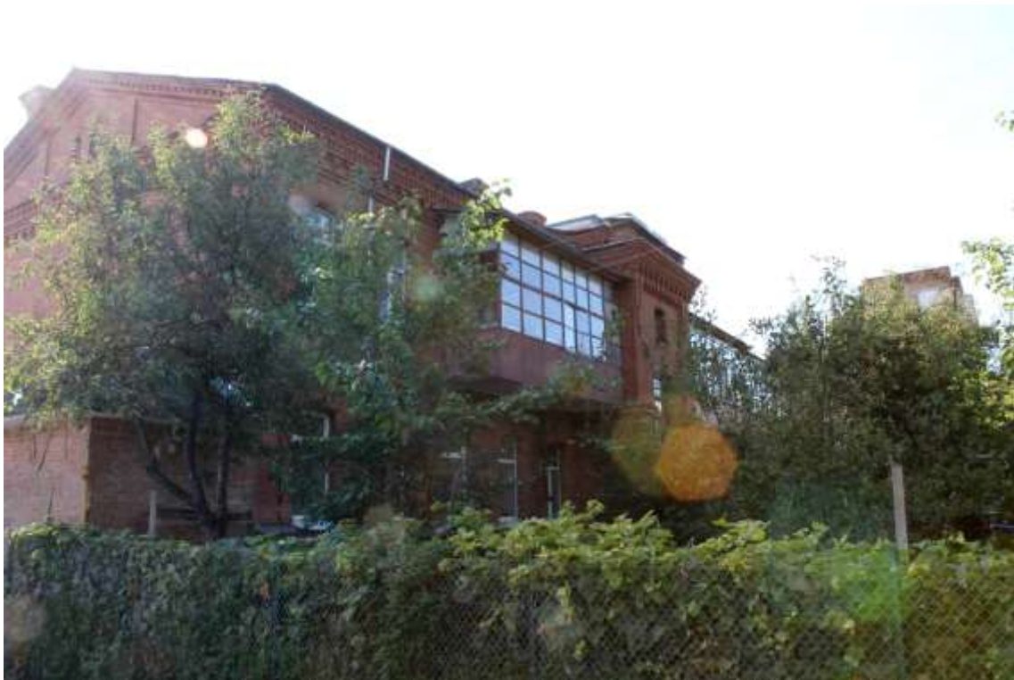
146. Будинок житловий, 1890-ті рр., вул. І. Франка, 49.

Щойно виявлений об'єкт культурної спадщини за видом архітектури.