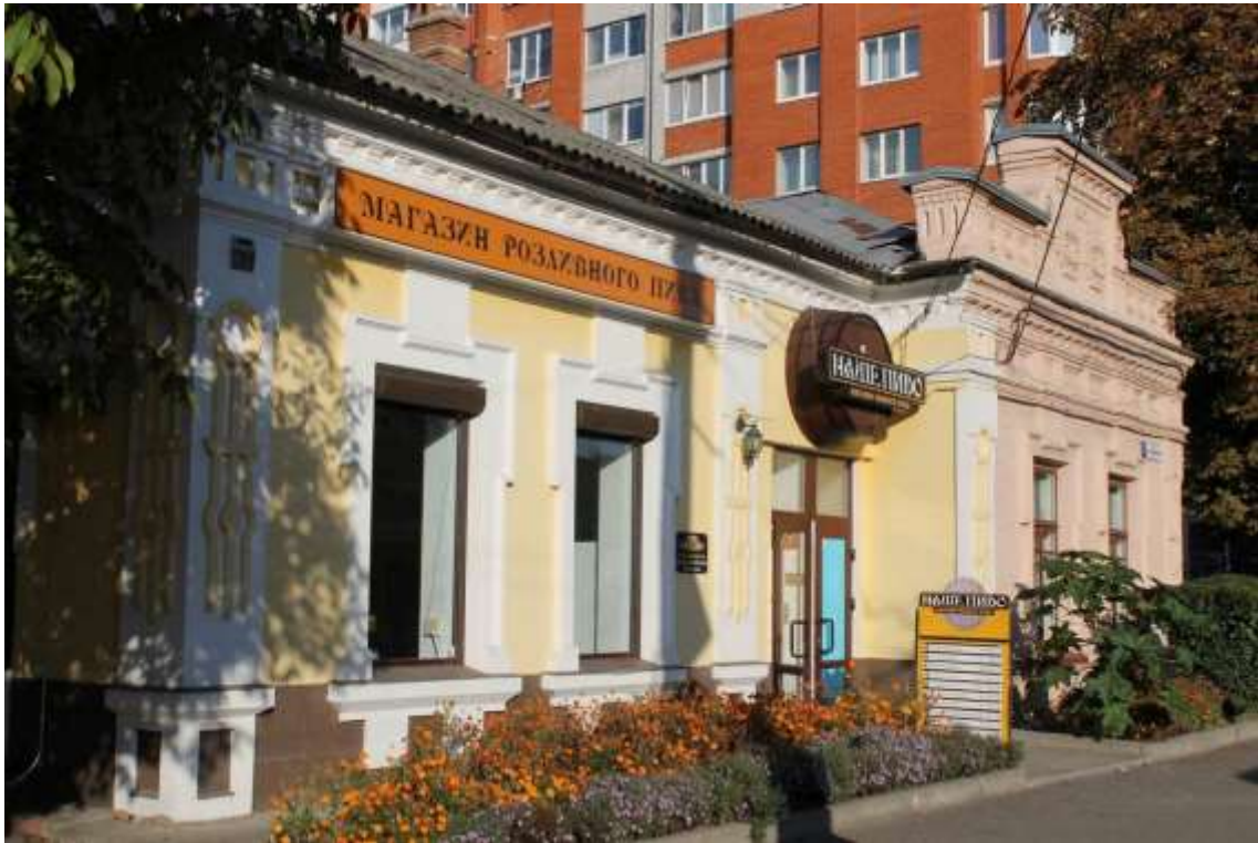
155. Будинок житловий, 1907 р., вул. Шевченка, 7. Фото жовтень 2016 р.

Щойно виявлений об'єкт культурної спадщини за видом архітектури.