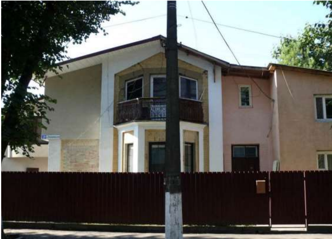
13. Будинок житловий кварталу із типових котеджів, 1920-ті рр., пров. Володимирський, 2. Фото жовтень 2016 р. Щойно виявлений об'єкт культурної спадщини за видом архітектури.