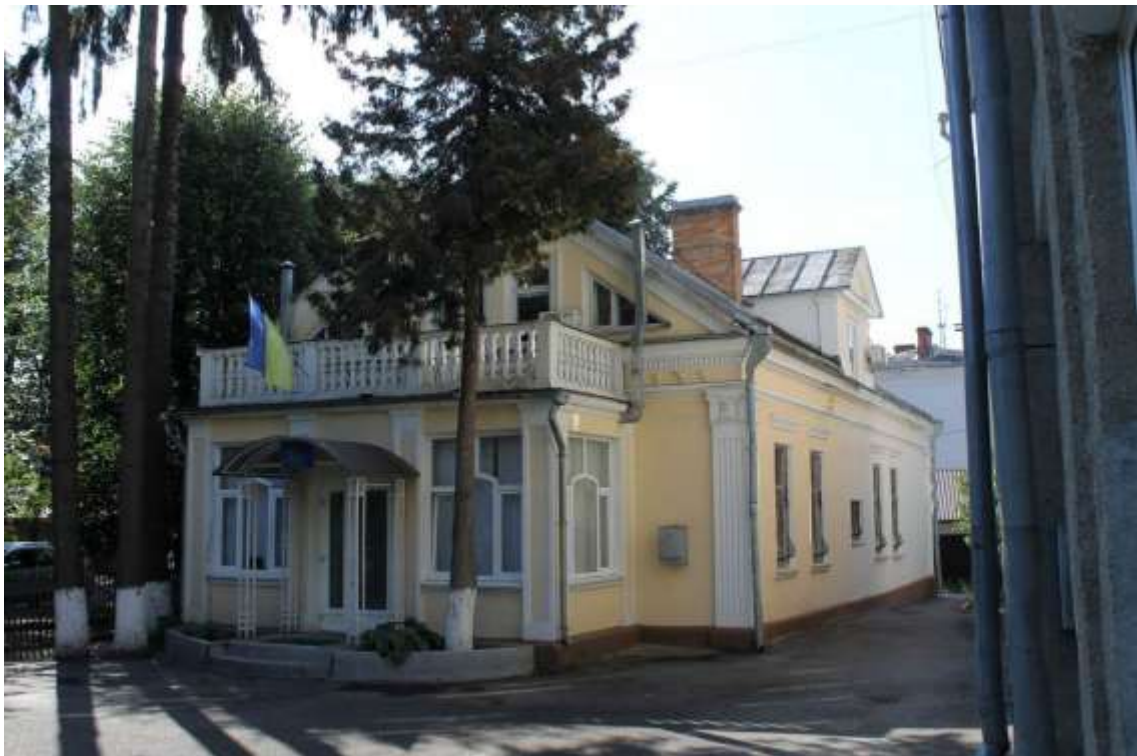
138. Особняк, кін ХІХ ст., вул. І. Франка, 2. Фото жовтень 2016 р. Щойно виявлений об'єкт культурної спадщини за видом архітектури.

Щойно виявлений об'єкт культурної спадщини за видом архітектури.