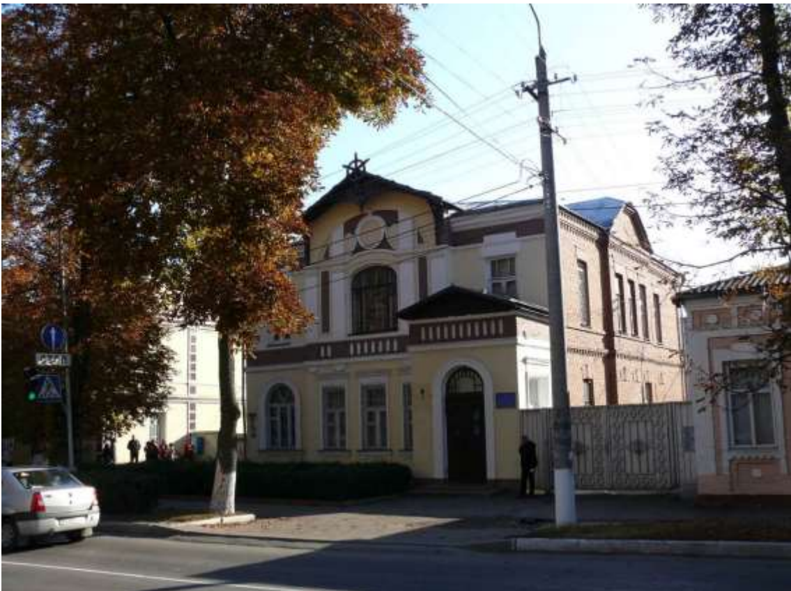
44. Особняк, поч. ХХ ст., вул. Грушевського, 97. Фото жовтень 2016 р. Щойно виявлений об'єкт культурної спадщини за видом архітектури.