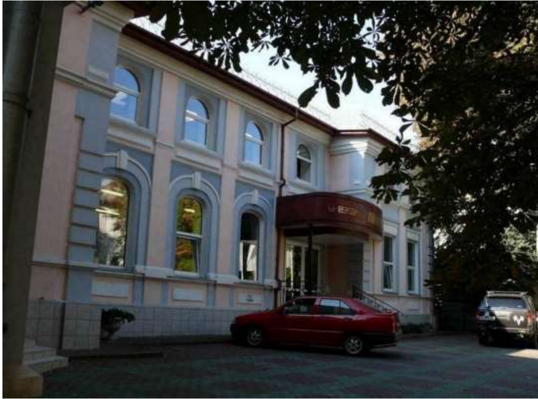
125. Будинок, в якому в 1941-44 рр. діяли дві підпільно-диверсійні групи Проскурівської окружної підпільно-партизанської організації 1941-44 рр., пров. Свободи, 6 (вул. Правди, 6/1). Фото жовтень 2016 р. Пам'ятка історії місцевого значення.