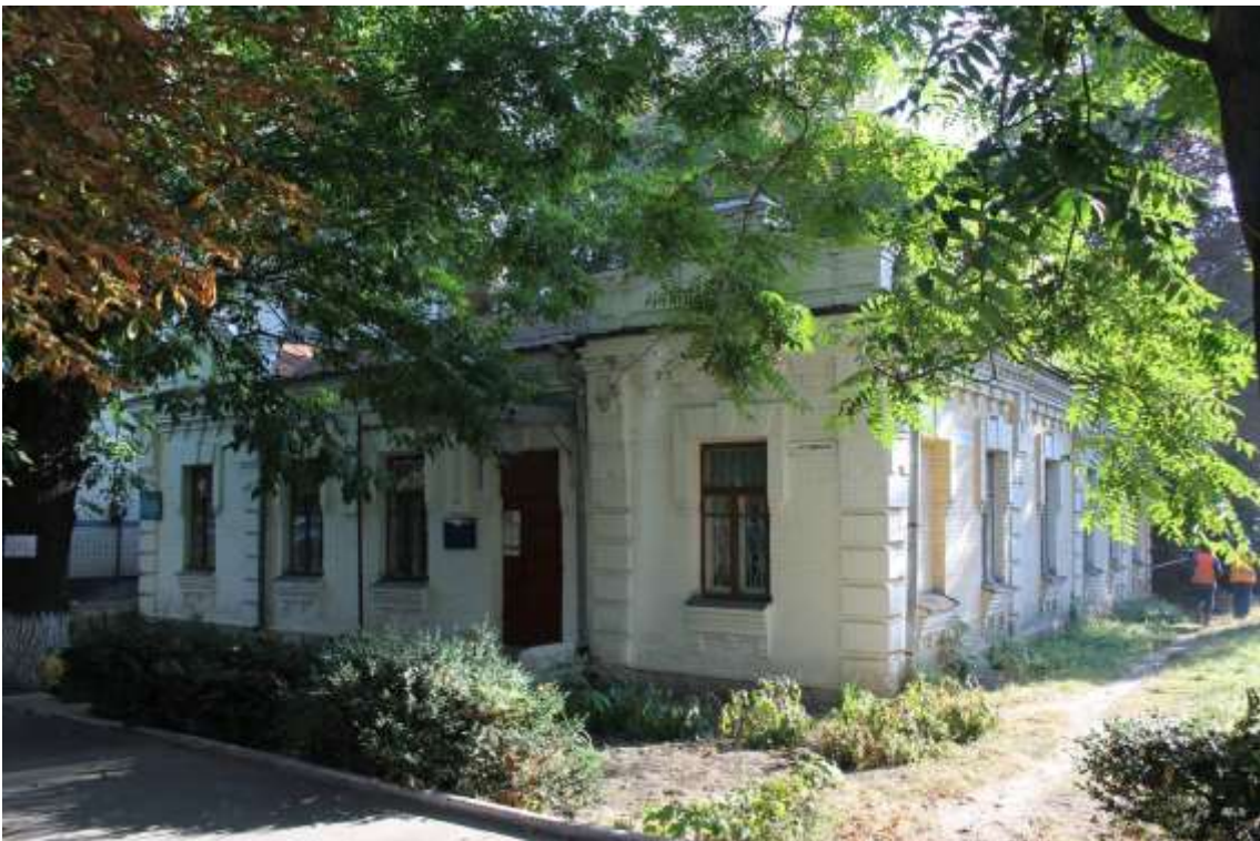
40. Будинок житловий, кін. ХІХ ст., вул. Грушевського, 93. Фото жовтень 2016 р. Щойно виявлений об'єкт культурної спадщини за видом архітектури.