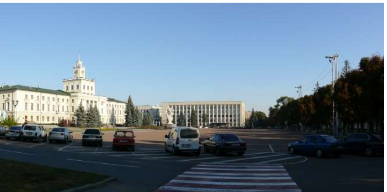
3. Майдан Незалежності. Фото жовтень 2016 р.