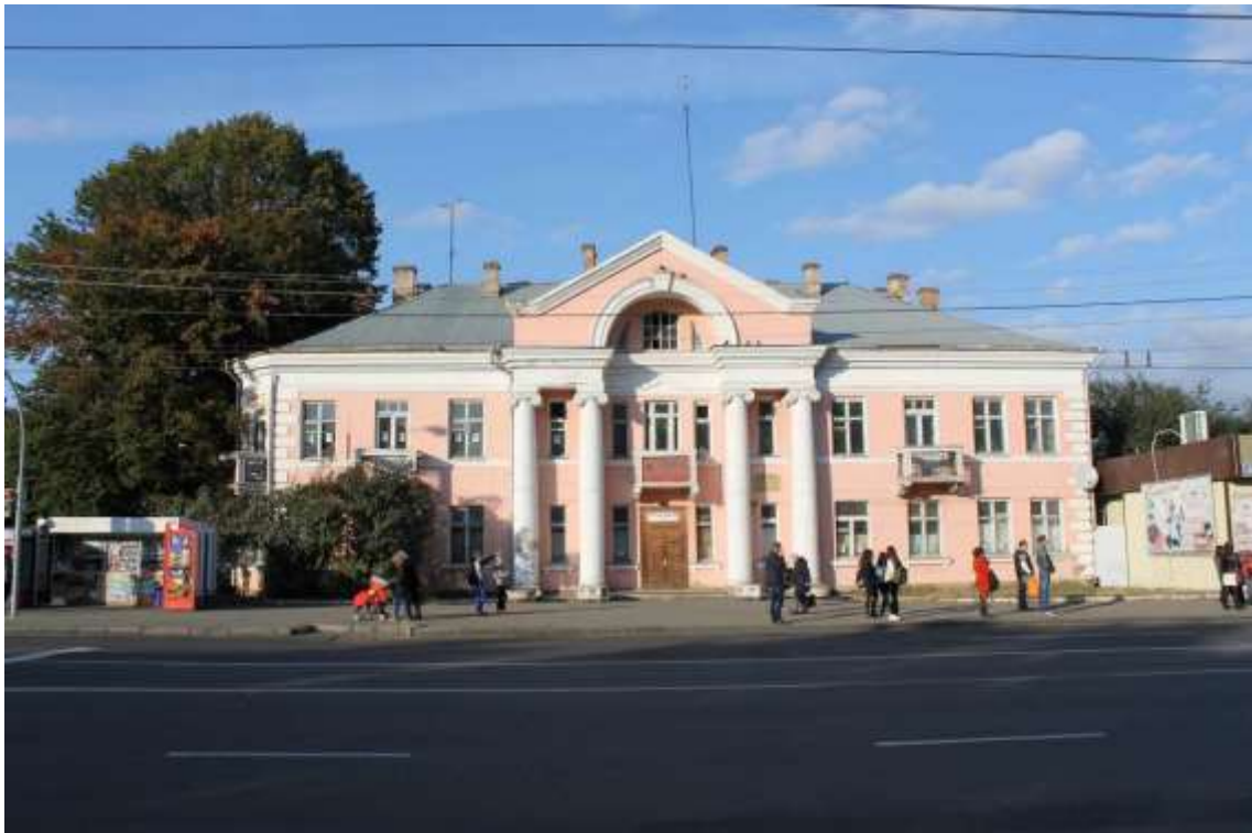
156. Будинок адміністративний, 1930-ті рр., вул. Шевченка, 33. Фото жовтень 2016 р.

Щойно виявлений об'єкт культурної спадщини за видом архітектури.