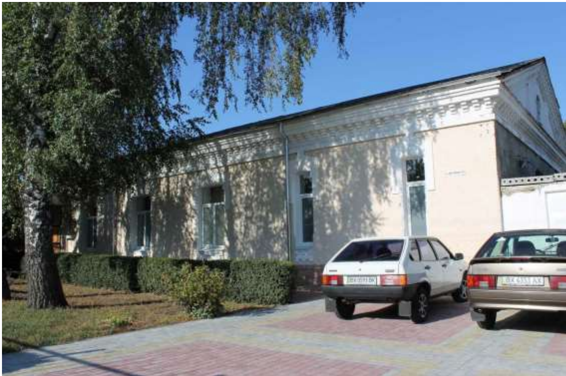
140. Будинок, в якому виступав Марсель Кашен,

Щойно виявлений об'єкт культурної спадщини за видом архітектури.