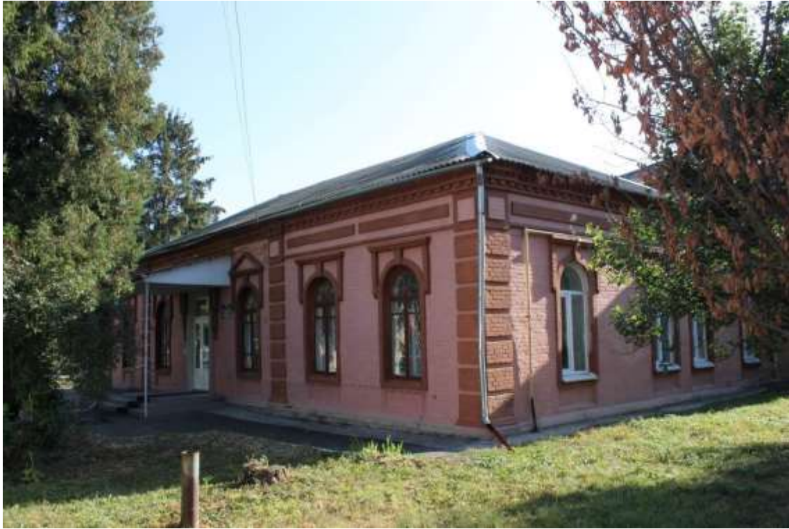
139. Будинок житловий, кін XIX ст., вул. І. Франка, 13.