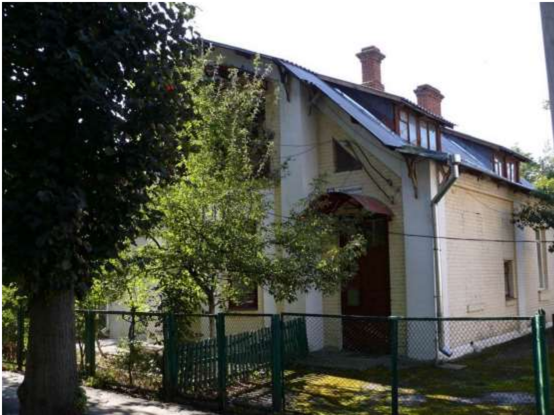
16. Будинок житловий кварталу із типових котеджів, 1920-ті рр., пров. Володимирський, 8. Фото жовтень 2016 р. Щойно виявлений об'єкт культурної спадщини за видом архітектури.