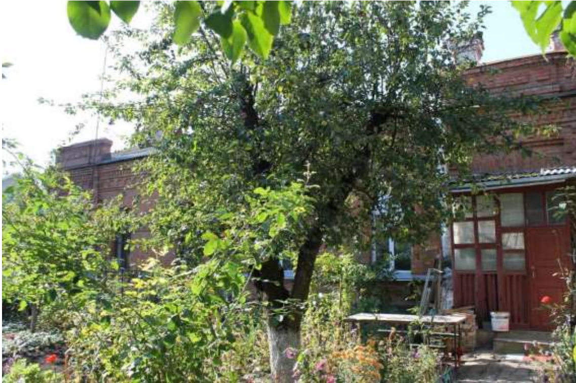
127. Будинок житловий, 1890-ті рр., вул. Юхима Сіцинського, 4. Фото жовтень 2016 р. Щойно виявлений об'єкт культурної спадщини за видом архітектури.