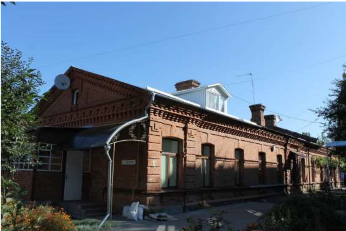
24. Будинок житловий, 1890-ті рр., вул. Гастелло, 2. Фото жовтень 2016 р. Щойно виявлений об'єкт культурної спадщини за видом архітектури.