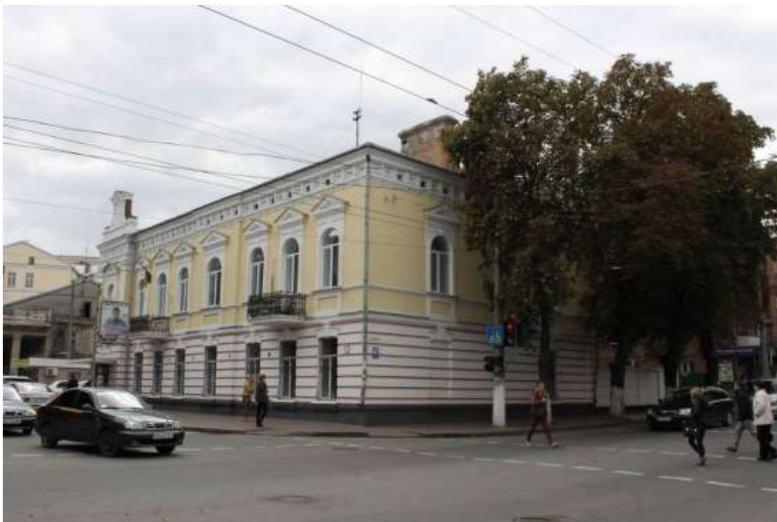
117. Будинок, в якому в кін. XIX – на поч. XX ст. розміщувався З'їзд мирових посередників Проскурівського повіту, 1890-ті рр., кін. XIX – на поч. XX ст., вул. Проскурівського підпілля, 32. Фото жовтень 2016 р.

Щойно виявлений об'єкт культурної спадщини за видом архітектури.