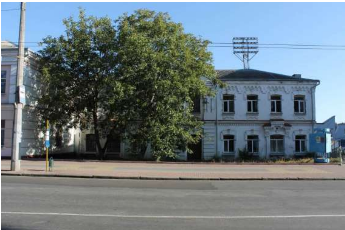
114. Будинок прибутковий, кін. XIX ст., вул. Проскурівська, 81. Фото жовтень 2016 р.

Щойно виявлений об'єкт культурної спадщини за видом архітектури.