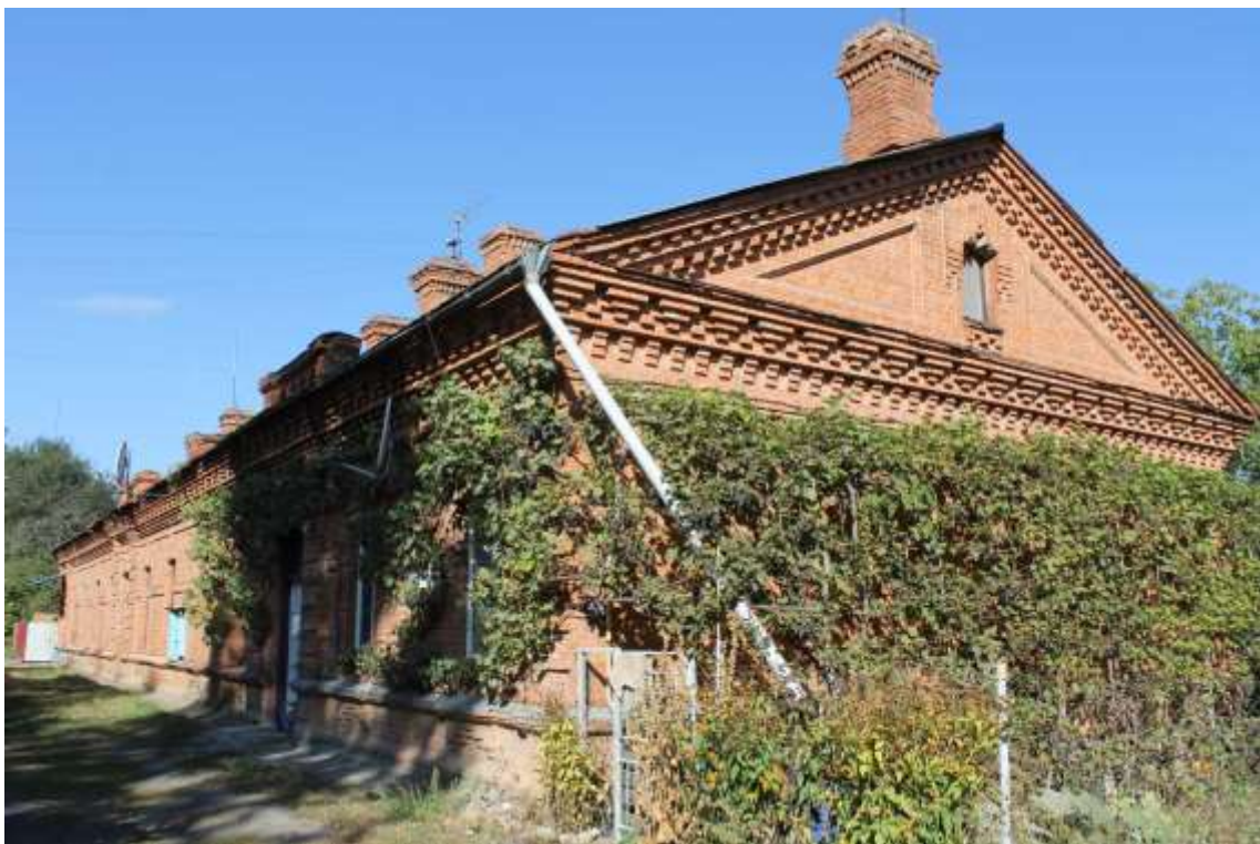
26. Будинок житловий, 1890-ті рр., вул. Гастелло, 6.

Щойно виявлений об'єкт культурної спадщини за видом архітектури.