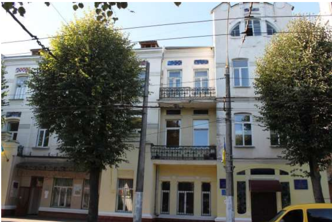
106. Будівля готелю «Континенталь» С. Вассермана, 1910-12 рр., вул. Проскурівська, 56. Фото жовтень 2016 р. Щойно виявлений об'єкт культурної спадщини за видом архітектури.