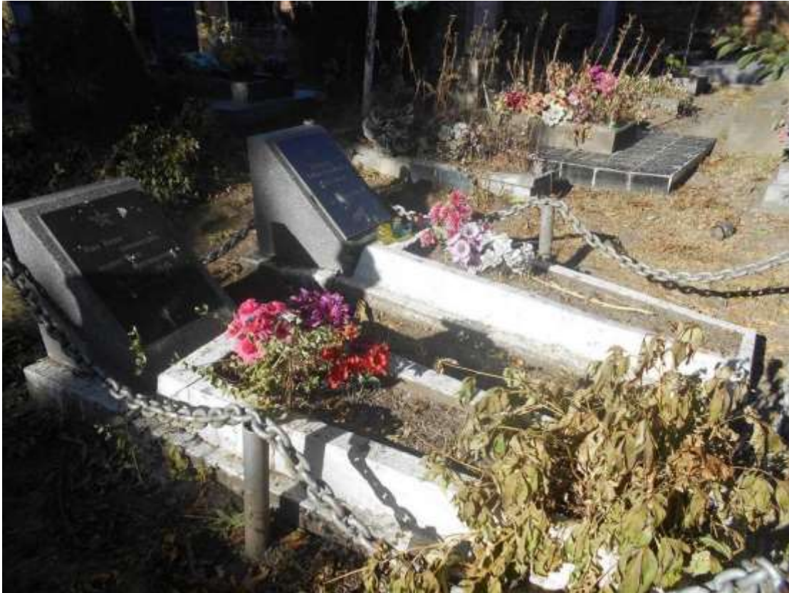
49. Могила радянського воїна, 1944 р., вул. Західно-Окружна, цвинтар мікрорайону Гречани. Фото жовтень 2016 р. Щойно виявлений об'єкт культурної спадщини за видом історичний.