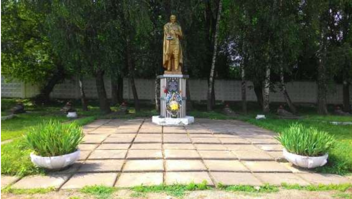
149. Братська могила воїнів Червоної Армії, 1941 р., 1975 р., вул. Чорновола, територія в/ч. Фото жовтень 2016 р. Пам'ятка історії місцевого значення.