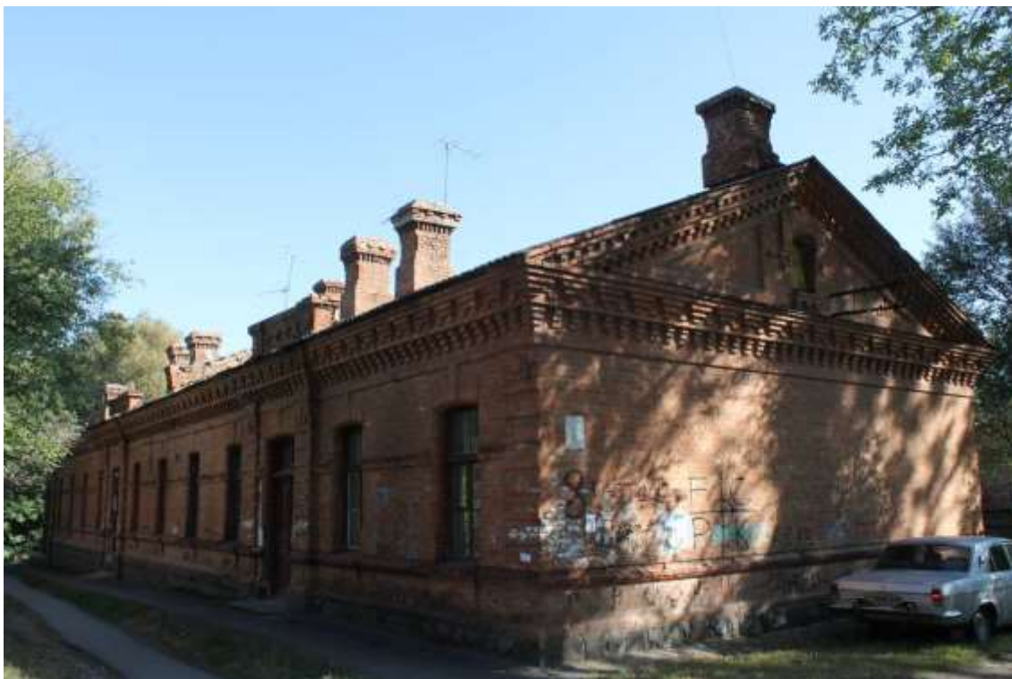
27. Будинок житловий, 1890-ті рр., вул. Гастелло, 8. Фото жовтень 2016 р.

Щойно виявлений об'єкт культурної спадщини за видом архітектури.