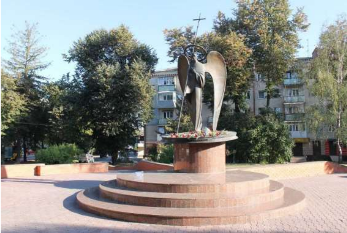
109. Пам'ятний знак жертвам репресій «Янгол скорботи», 1998 р., вул. Проскурівська, 61. Фото жовтень 2016 р. Пам'ятка монументального мистецтва місцевого значення.