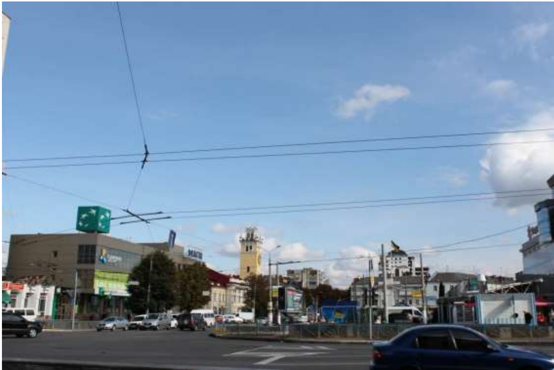
6. Перетин вул. Кам'янецької та Подільської. Фото жовтень 2016 р.