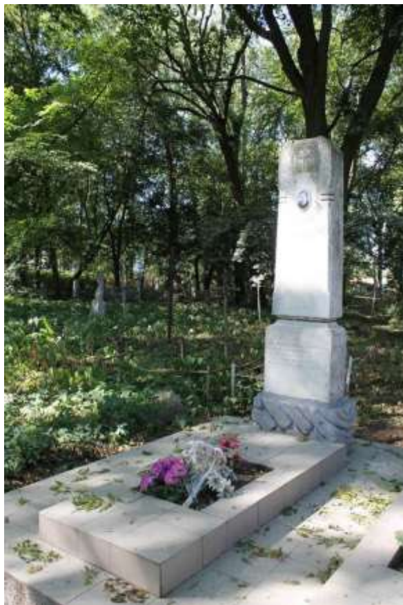
131. Могила М.І. Трембовецької, 1943 р., 1948 р., вул. Толстого, 1, цвинтар. Фото жовтень 2016 р. Пам'ятка історії місцевого значення.