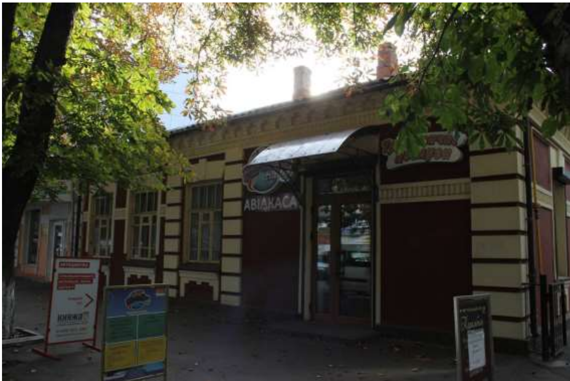
34. Будинок житловий, кін. XIX ст., вул. Грушевського, 50. Фото жовтень 2016 р. Щойно виявлений об'єкт культурної спадщини за видом архітектури.