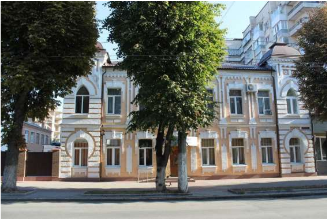
110. Будинок прибутковий, 1910-ті рр., вул. Проскурівська, 63. Фото жовтень 2016 р. Щойно виявлений об'єкт культурної спадщини за видом архітектури.