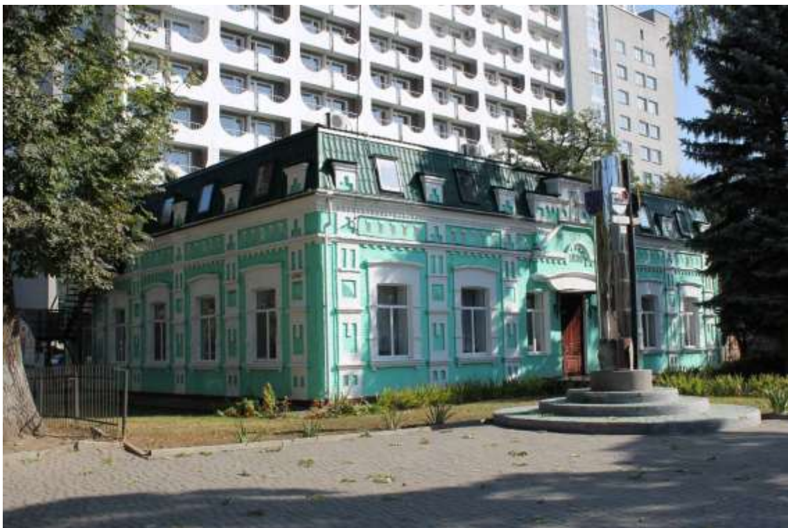
78. Будинок житловий, 1898 р., вул. Пилипчука, 49. Фото жовтень 2016 р. Щойно виявлений об'єкт культурної спадщини за видом архітектури.