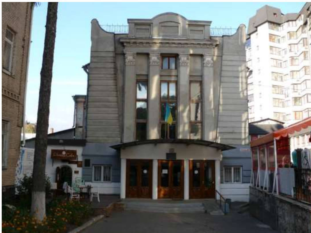
103. Будівля театру Б. Шильмана, в якому виступали видатні державні, військові та культурні діячі, 1907 р., вул. Проскурівська, 43.