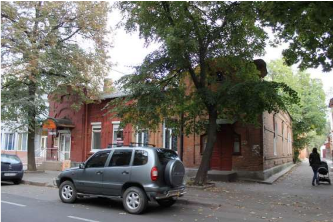
120. Будинок житловий, кін. XIX ст., вул. Проскурівського підпілля, 75. Фото жовтень 2016 р. Щойно виявлений об'єкт культурної спадщини за видом архітектури.