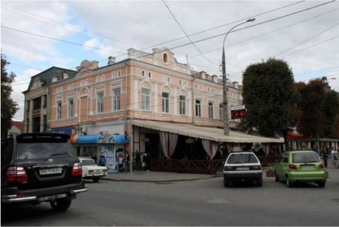
99. Будівля готелю «Петербурзький» Ш. Сколецької, 1897 р., вул. Проскурівська, 33. Фото жовтень 2016 р. Щойно виявлений об'єкт культурної спадщини за видом архітектури.