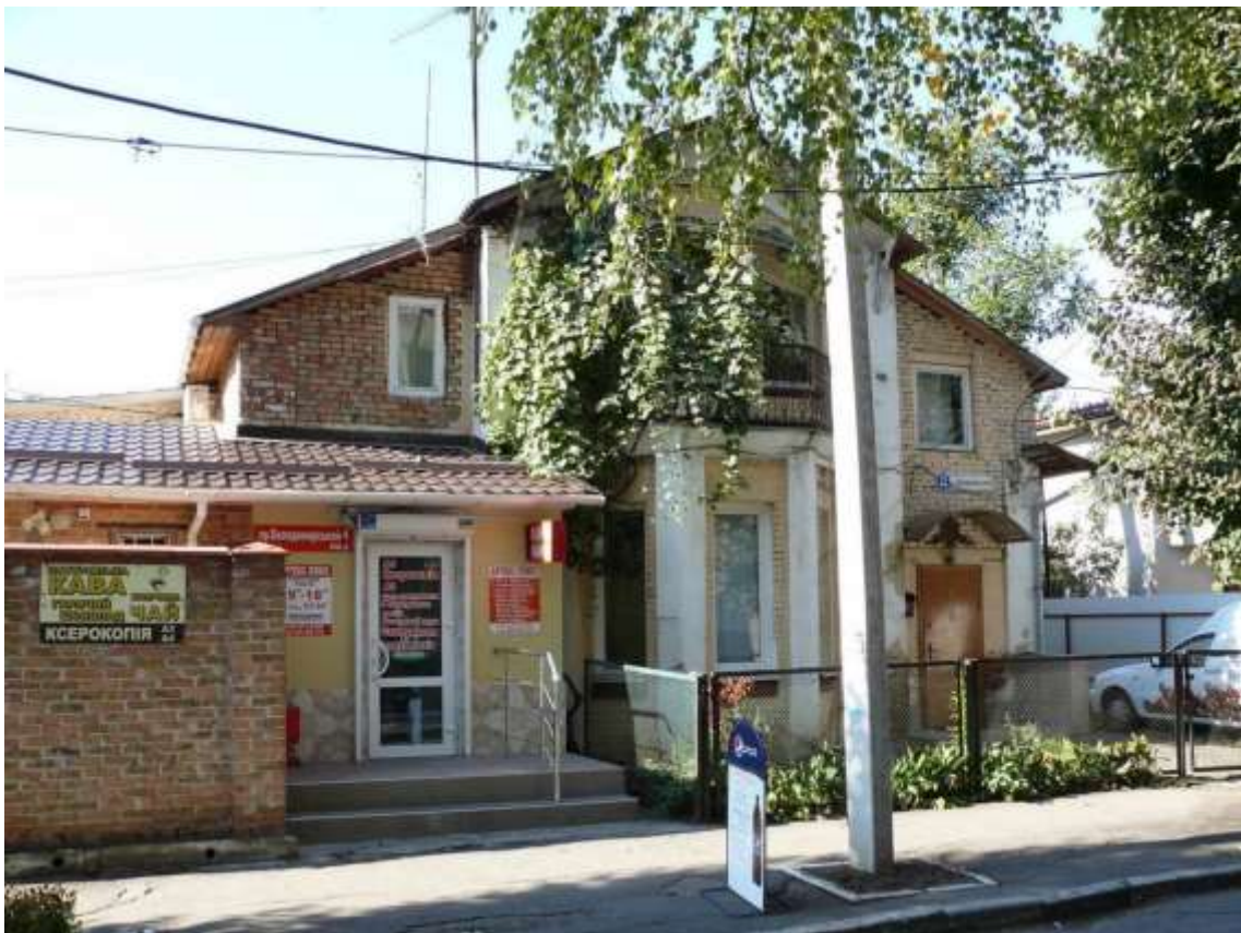
14. Будинок житловий кварталу із типових котеджів, 1920-ті рр., пров. Володимирський, 4. Фото жовтень 2016 р. Щойно виявлений об'єкт культурної спадщини за видом архітектури.