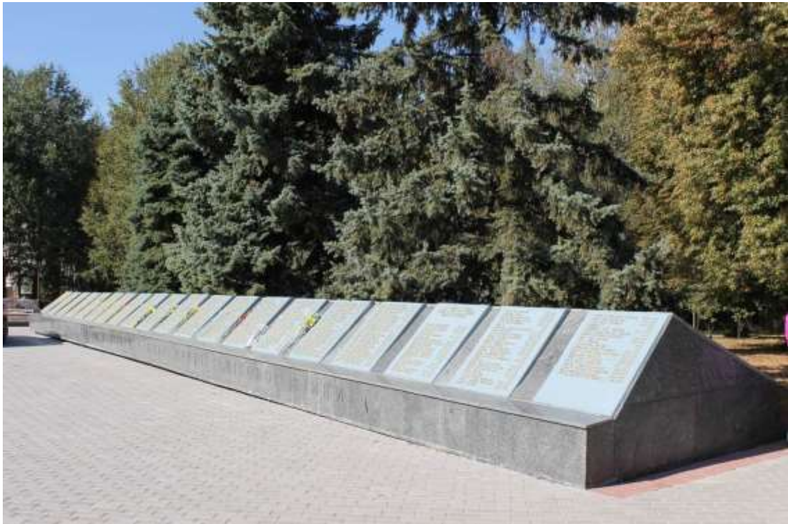
63. Військове кладовище, 1943 р., 1944 р., 1945 р., 1985 р., вул. Кам'янецька, 96. Фото жовтень 2016 р. Пам'ятка історії місцевого значення.