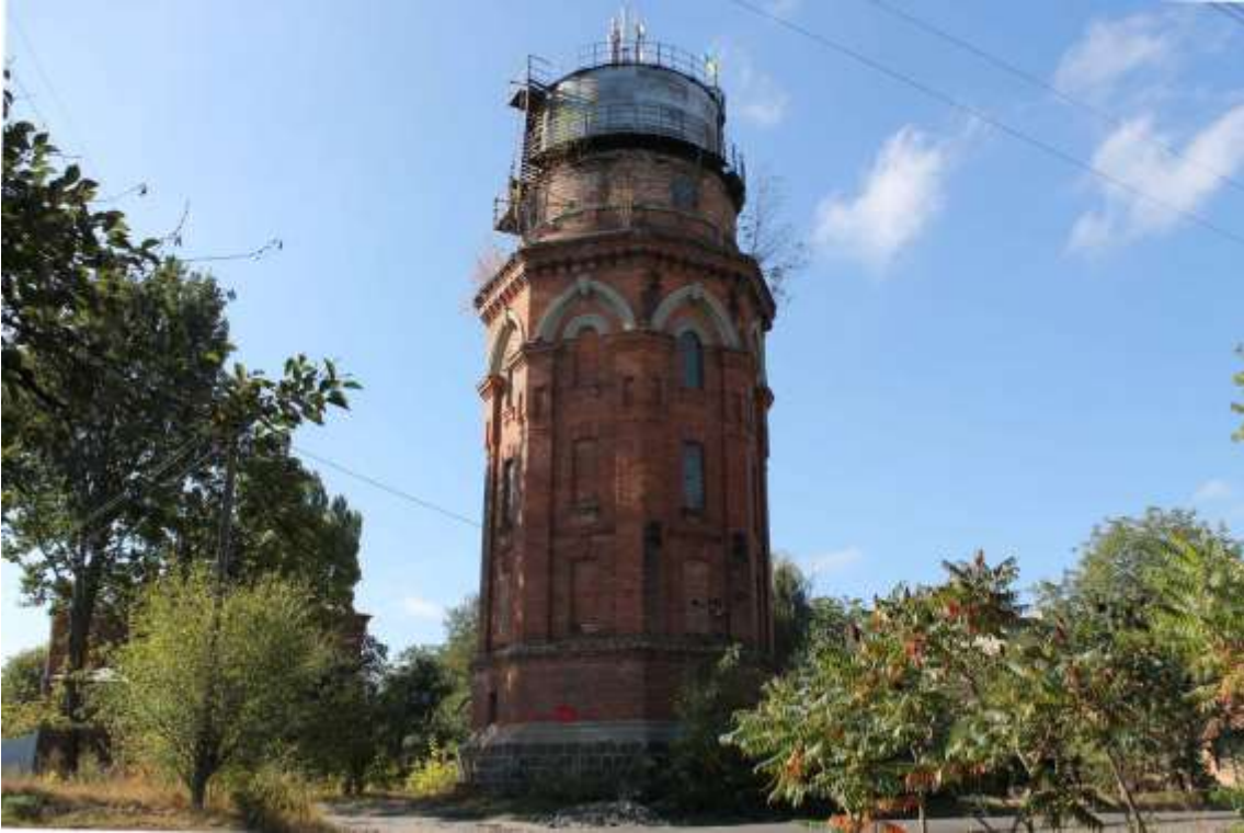
23. Водонапірна вежа, 1910 р., вул. Гастелло. Фото жовтень 2016 р. Щойно виявлений об'єкт культурної спадщини за видом архітектури.