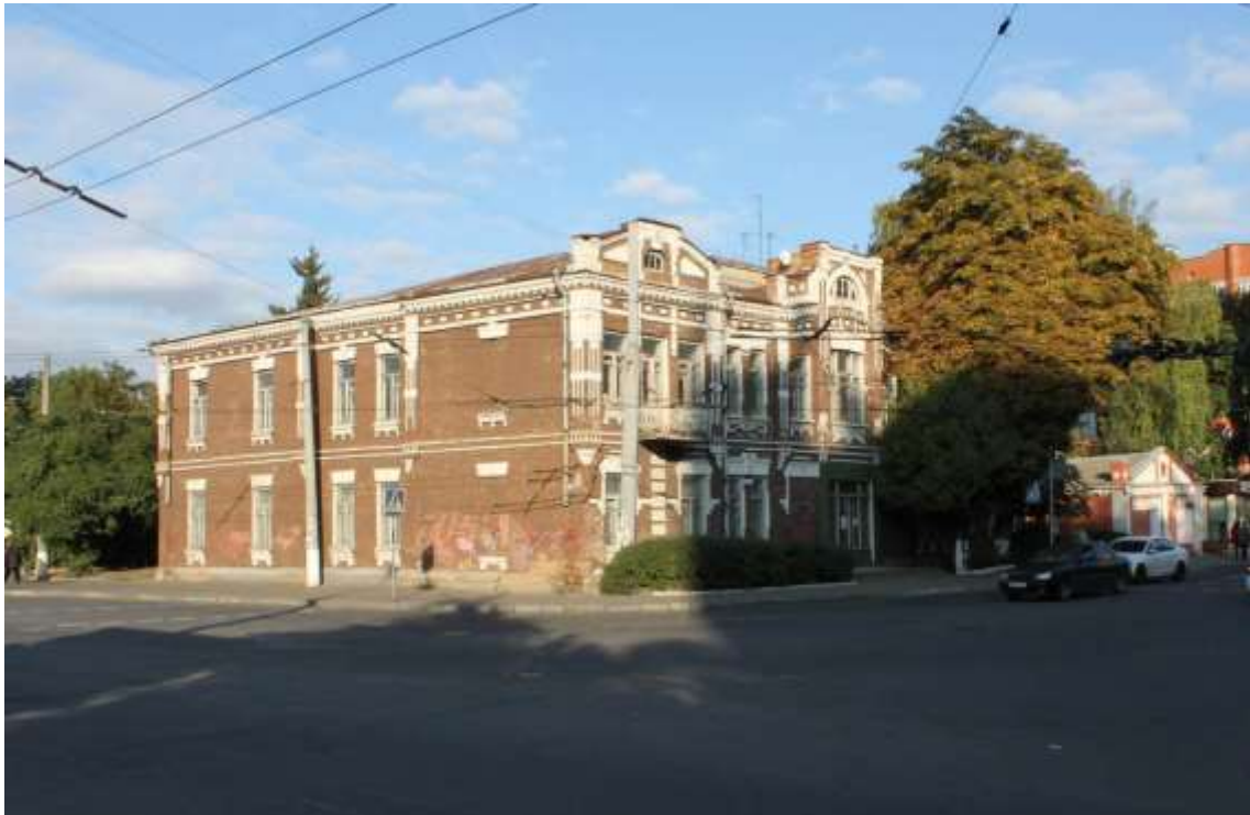
153. Будівля Єврейського училища, поч. XX ст., вул. Шевченка, 1. Фото жовтень 2016 р.

Щойно виявлений об'єкт культурної спадщини за видом архітектури.