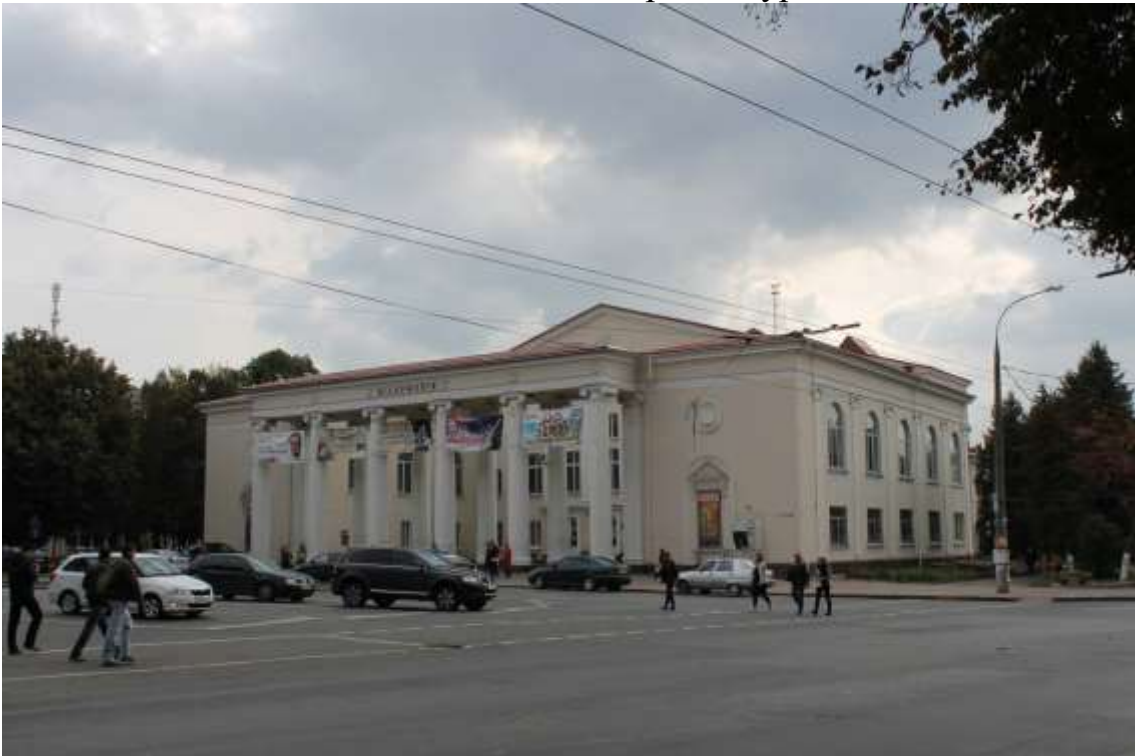
20. Будівля Музично-драматичного театру ім. Петровського (Хмельницька обласна філармонія), 1960 р., 1982 р., вул. Гагаріна, 7.

Пам'ятка історії місцевого значення, щойно виявлений об'єкт культурної спадщини за видом архітектури.