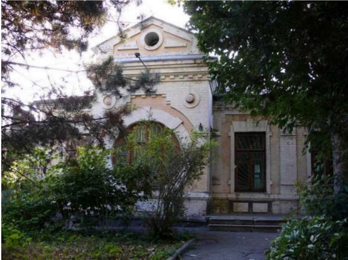
9. Будівля Єпархіального Проскурівсько-Летичівського вікаріату, в якій в 1921-24 рр. працював єпископ Валеріан (Рудич), поч. ХХ ст., 1921-24 рр., вул. Володимирська, 38. Фото жовтень 2016 р.

Щойно виявлений об'єкт культурної спадщини за видом архітектури.