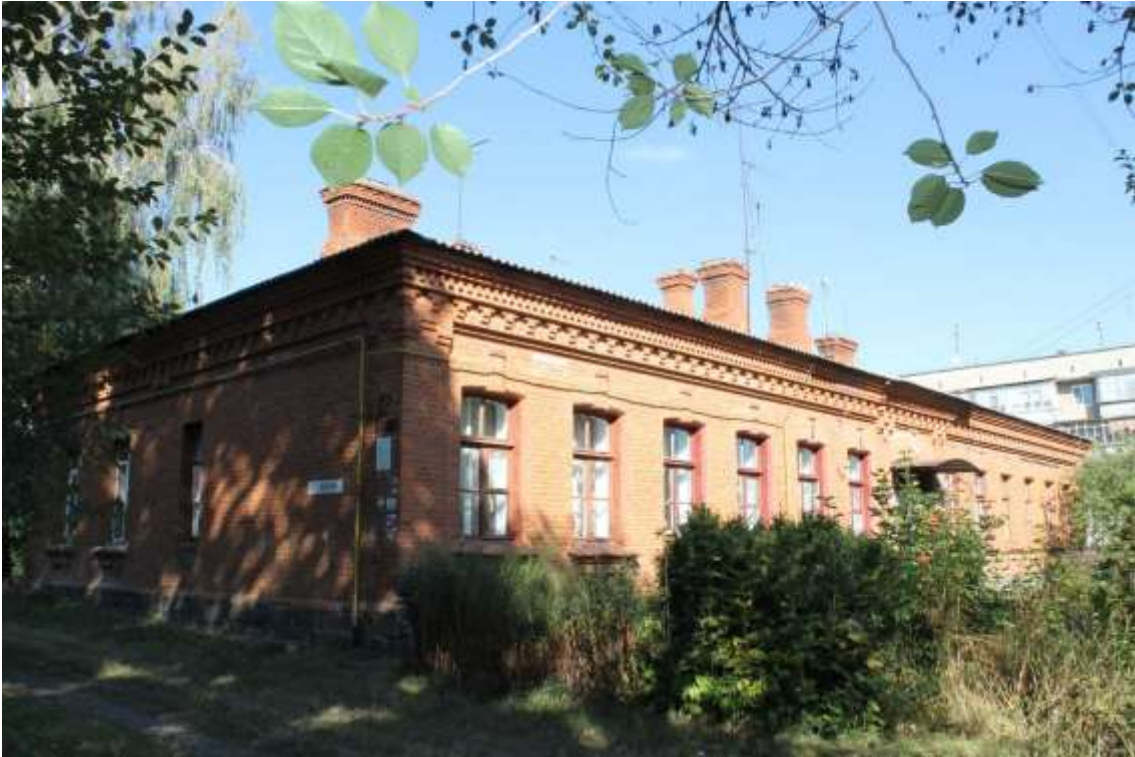
29. Будинок житловий, 1890-ті рр., вул. Гастелло, 12. Фото жовтень 2016 р.

Щойно виявлений об'єкт культурної спадщини за видом архітектури.