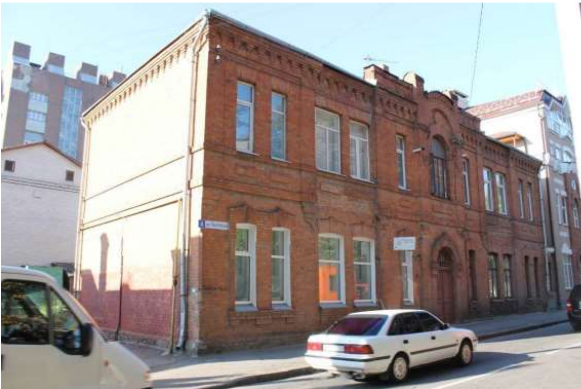
46. Будинок прибутковий, кін. 1890-х рр., вул. Європейська, 4. Фото жовтень 2016 р.

Щойно виявлений об'єкт культурної спадщини за видом архітектури.