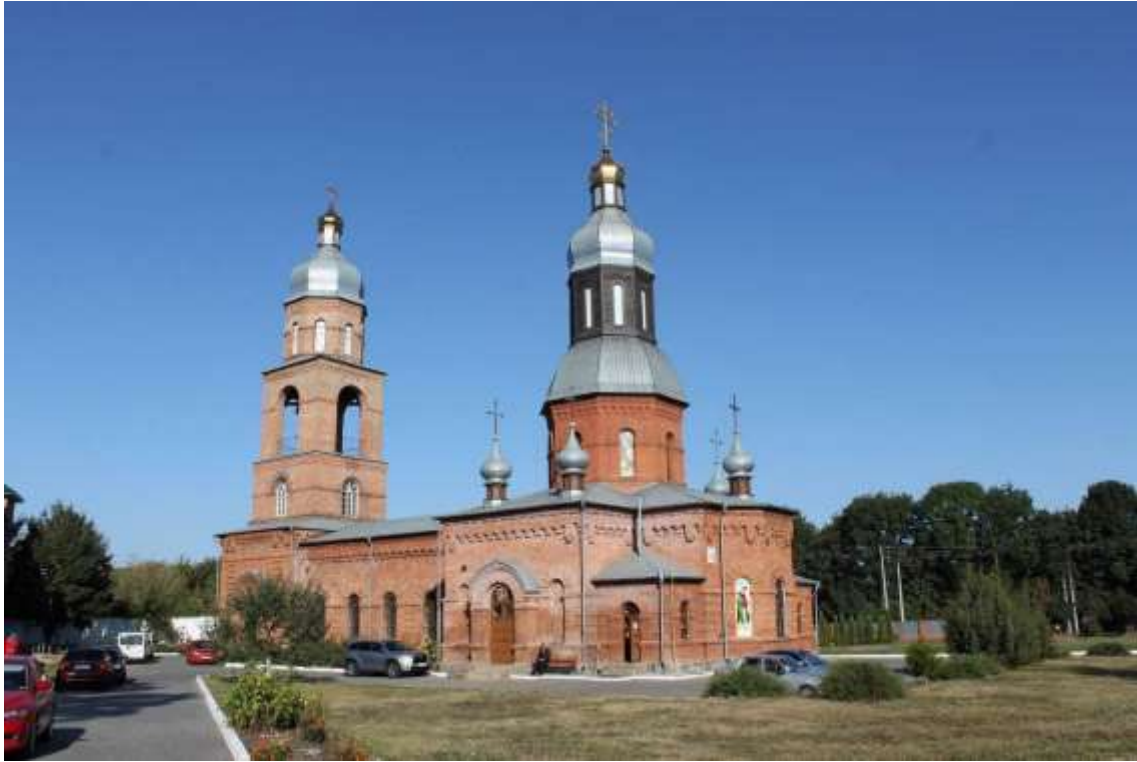
137. Храм св. Апостолів Петра і Павла (Свято-Георгіївський храм), 1897-98 рр., 1906 р., кін. ХХ – поч. ХХІ ст., вул. І. Франка.