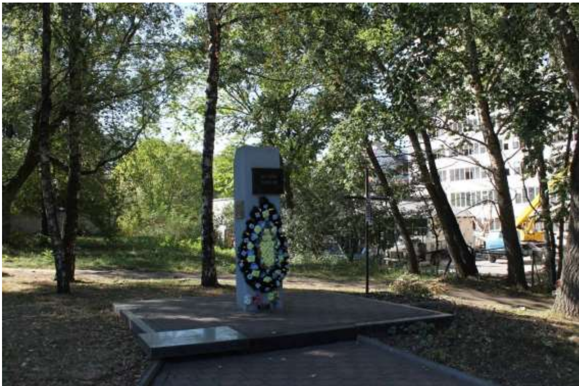
62. Військове кладовище, 1943 р., 1944 р., 1945 р., 1985 р., вул. Кам'янецька, 96. Фото жовтень 2016 р. Пам'ятка історії місцевого значення.