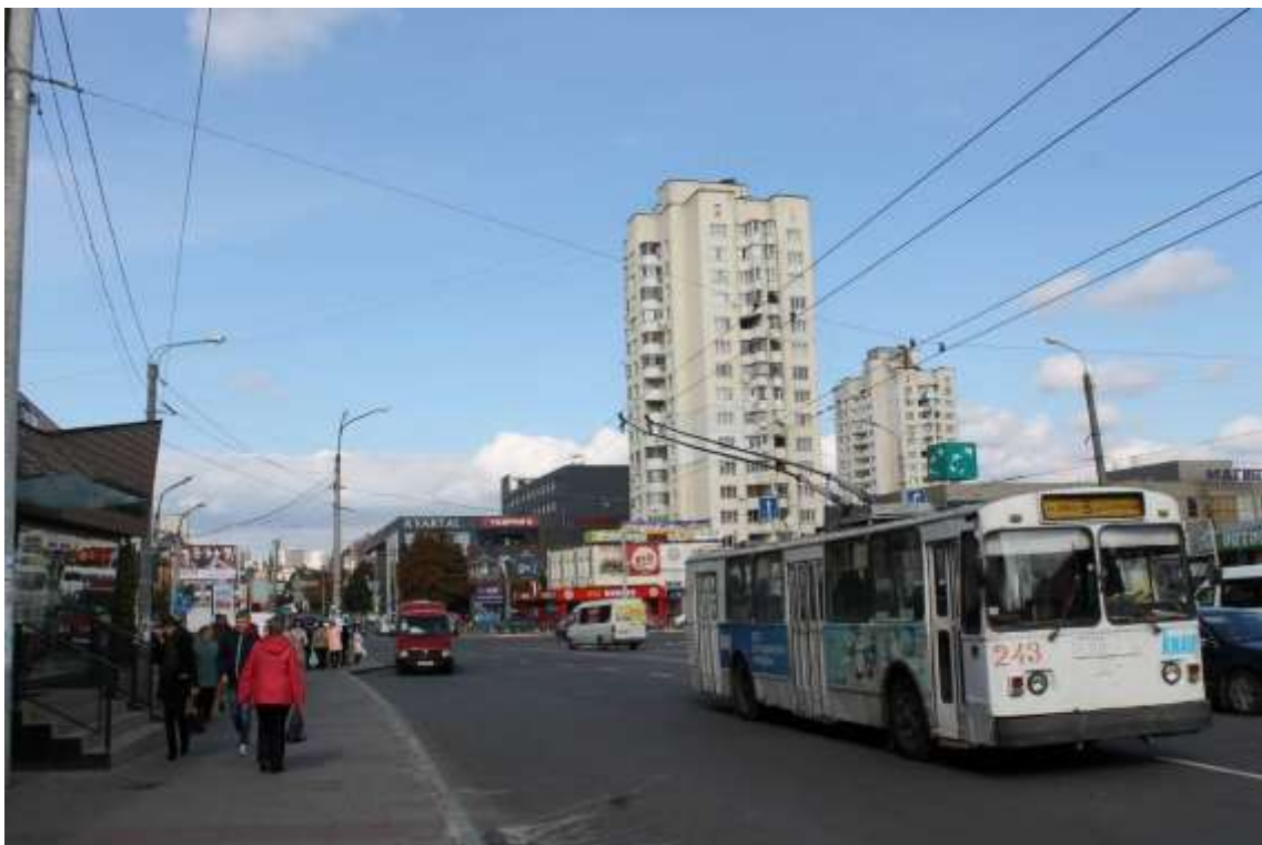
5. Забудова вул. Кам'янецької. Вигляд від вул. Подільської. Фото жовтень 2016 р.