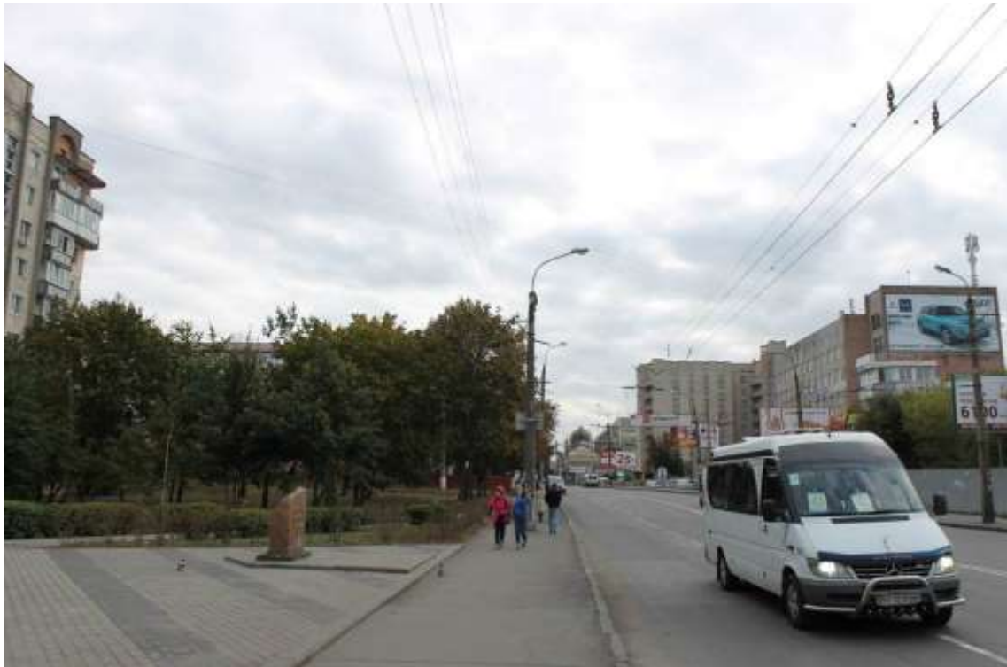
4. Забудова вул. Кам'янецької. Вигляд від Пам'ятника героям та жертвам Чорнобиля в бік вул. Староміської. Фото жовтень 2016 р.