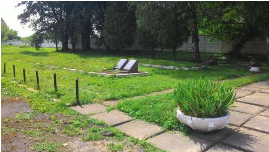
150. Братська могила воїнів Червоної Армії, 1941 р., 1975 р., вул. Чорновола, територія в/ч. Фото жовтень 2016 р. Пам'ятка історії місцевого значення.