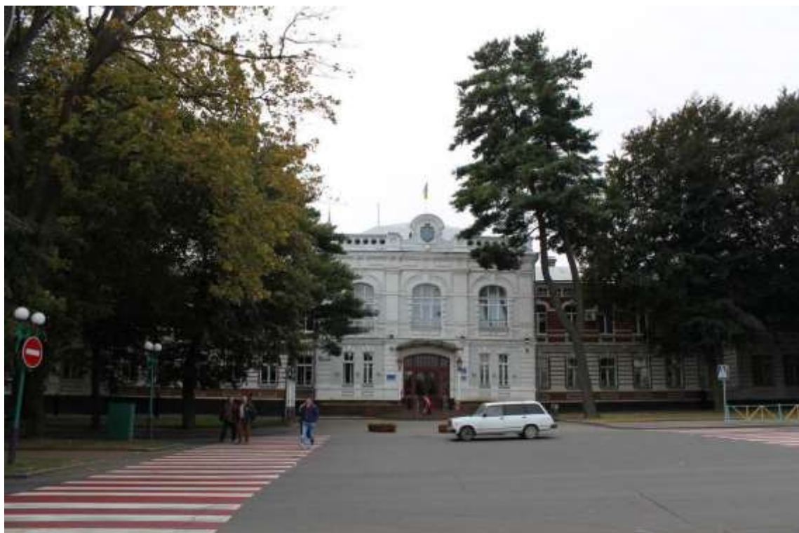
18. Будівля Олексіївського реального училища, в якому в 1919-20 рр. навчався письменник М. Трублаїні, 1904 р., 1919-20 рр., вул. Гагаріна, 3. Фото жовтень 2016 р.

Пам'ятка історії місцевого значення, щойно виявлений об'єкт культурної спадщини за видом архітектури.