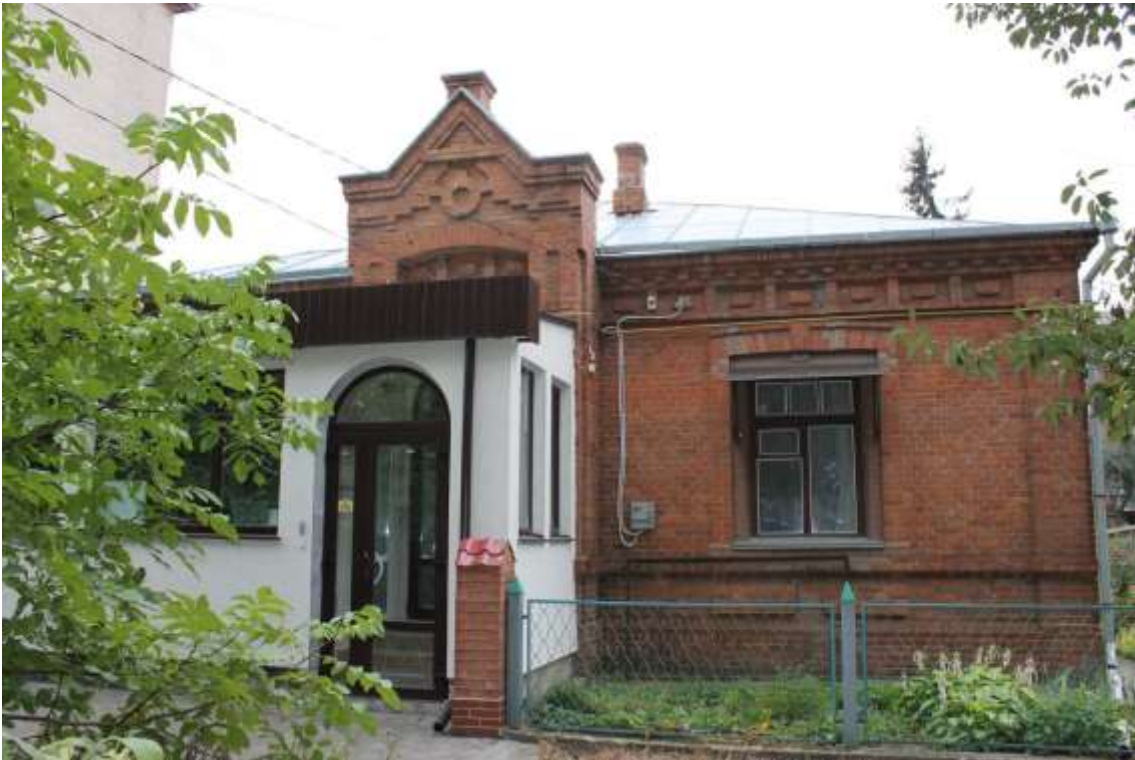
32. Будинок житловий, кін. ХІХ ст., вул. Герцена, 6. Фото жовтень 2016 р. Щойно виявлений об'єкт культурної спадщини за видом архітектури.