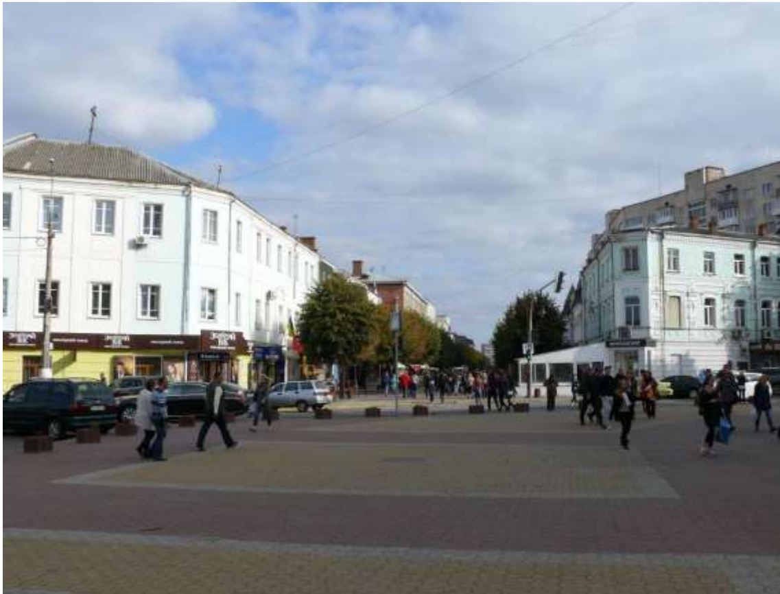
10. Забудова вул. Проскурівської. Фото жовтень 2016 р.