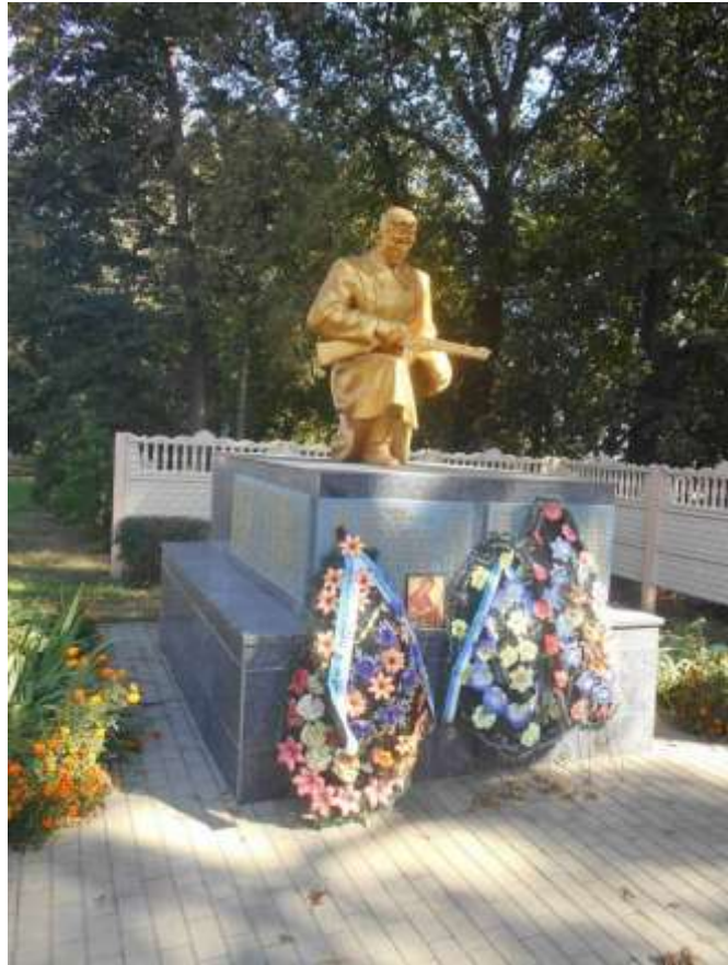
71. Братська могила воїнів радянської армії, 1944 р., 1955 р., пр. Миру, 53/1. Фото жовтень 2016 р. Пам'ятка історії місцевого значення.