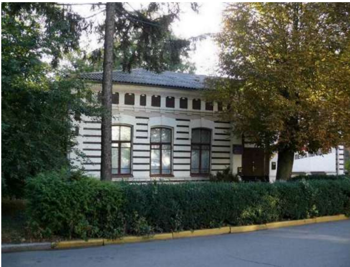
123. Особняк, 1907 р., пров. Пушкіна, 11. Фото жовтень 2016 р. Пам'ятка історії місцевого значення, щойно виявлений об'єкт культурної спадщини за видом архітектури.