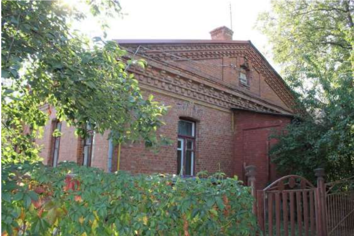
147. Будинок житловий, 1890-ті рр., пров. І. Франка, 3. Фото жовтень 2016 р.

Щойно виявлений об'єкт культурної спадщини за видом архітектури.