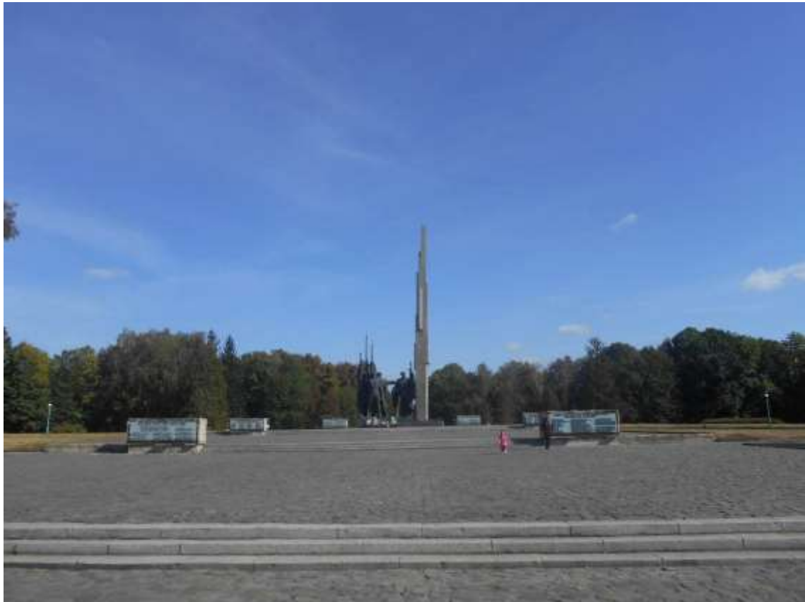
73. Монумент Вічної Слави, 1941-1944 рр., 1983 р., пр. Миру, 105. Фото жовтень 2016 р. Пам'ятка історії місцевого значення.